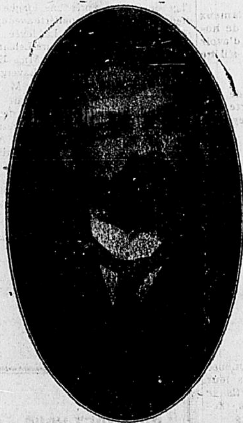
M. Henri Bourassa, directeur du "Devoir" qui a donné son précieux concours à la campagne de la Bonne Presse le printemps dernier en venant donner des conférences sur la Presse Catholique et Nationale dans six paroisses du diocèse.