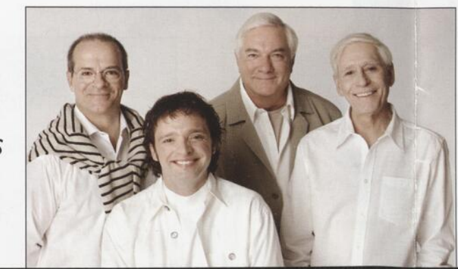
Un duel de titans