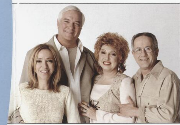
Un album de famille inoubliable

de Serge Boucher mise en scène de René Richard Cyr