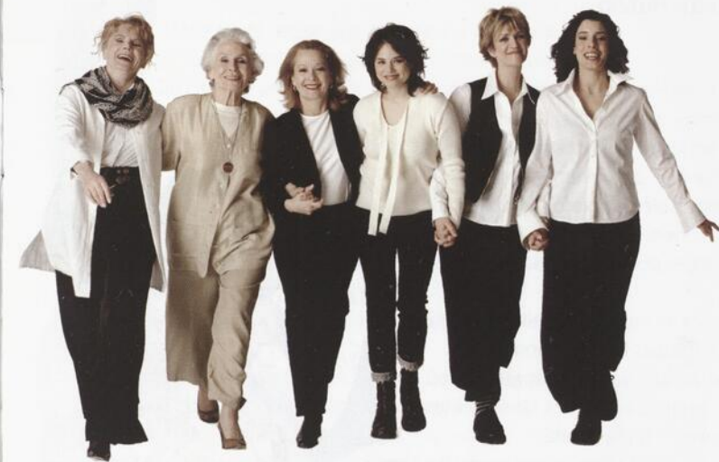
Des femmes drôles, touchantes, spirituelles

de Robert Harling mise en scène de Monique Duceppe