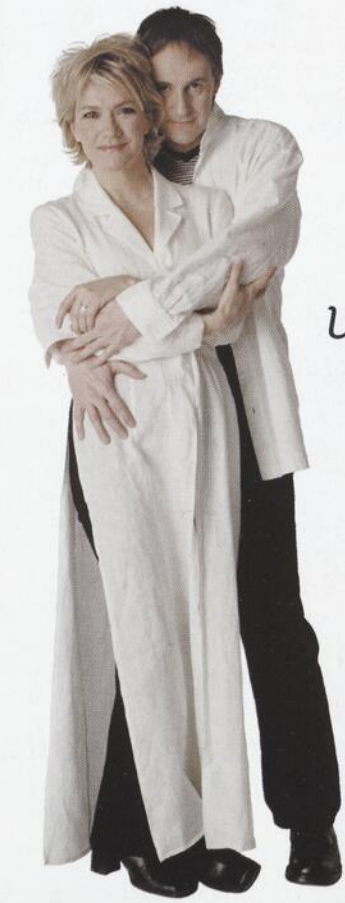
Une oeuvre sensuelle et forte

d'Ettore Scola mise en scène de Serge Denoncourt