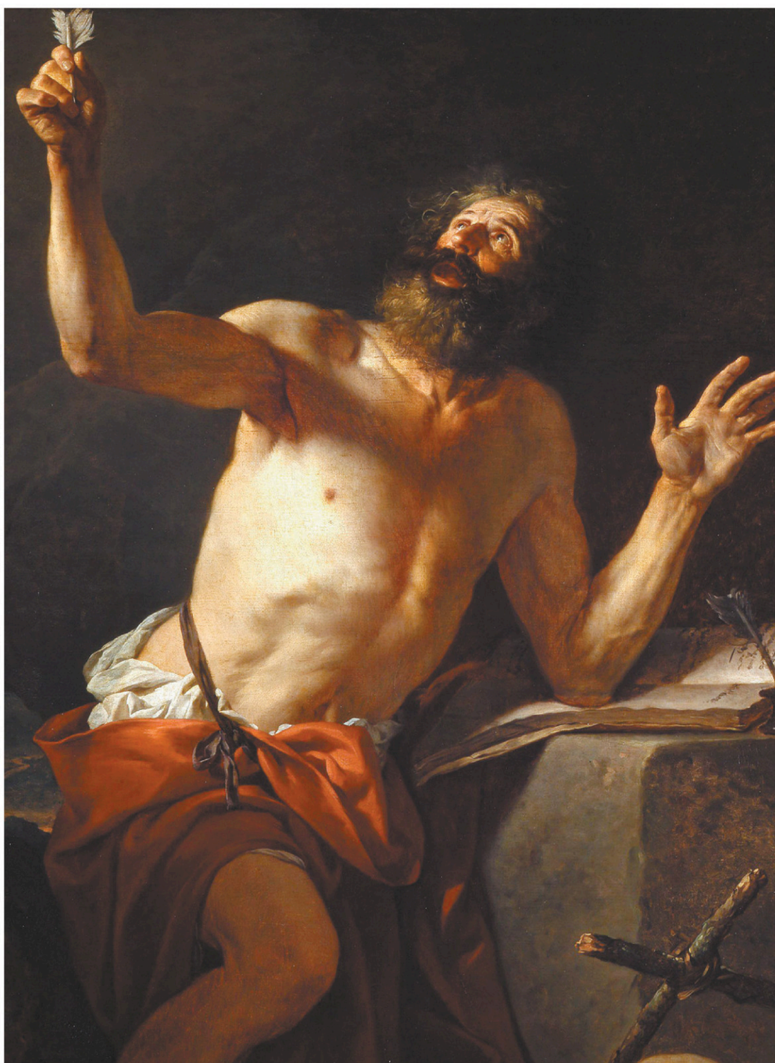
Détail de l'œuvre Saint Jérôme , dont la tentative d'acquisition par le MBAC soulève une tempête.