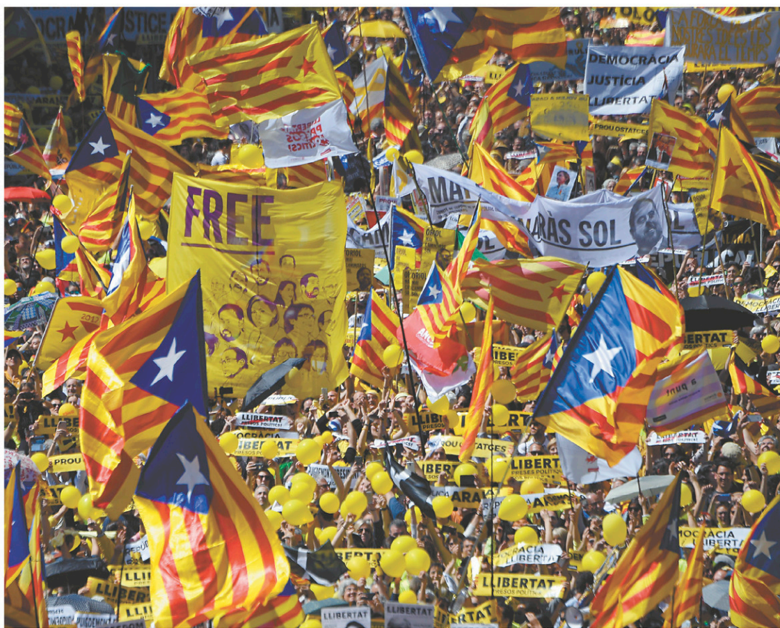
Les Catalans sont de nouveau descendus dans les rues de Barcelone cette semaine pour demander la libération des indépendantistes.

Dans la poudrière du Proche et du Moyen-Orient, la lumière du Printemps arabe s'est définitivement éteinte. Pratiquement partout règnent la dictature, la junte militaire, l'autoritarisme ou l'anarchie et le tribalisme. Les quatre grandes puissances de la région, l'Iran, la Turquie, l'Arabie saoudite et Israël, où les nationaux-théocrates dominent, jouent de leur influence respective pour déstabiliser les autres. En Inde, cinquième économie du monde et puissance nucléaire, le nationalisme hindou de Narendra Modi alimente à nouveau les divisions sectaires qui ont ensanglanté le sous-continent par le passé. Les affrontements au