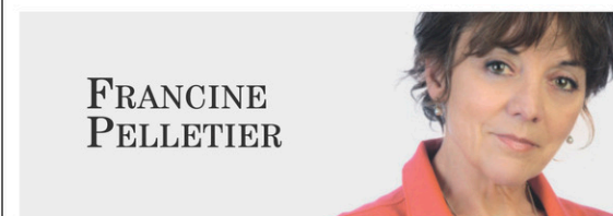
La chronique sera publiée exceptionnellement jeudi.

Il incombe au gouvernement de veiller à ce que les familles aient les bons soutiens pour promouvoir la réintégration des mères au marché du travail et réduire l'écart économique entre les sexes. Investir dans les services de garde d'enfants sera un pied dans la lutte contre les rôles stéréotypés de genre et accroîtra la prospérité nationale et individuelle.