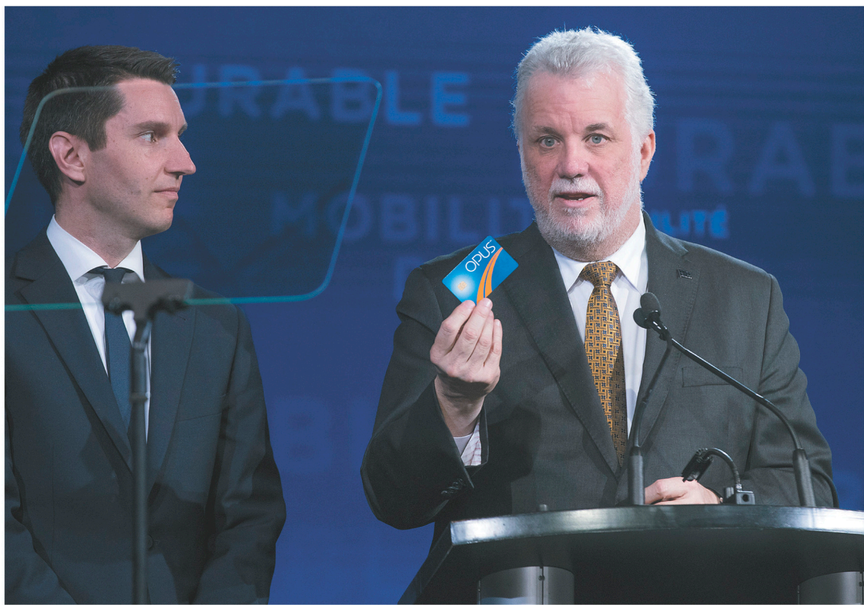
Accompagné de son ministre des Transports, André Fortin, le premier ministre Philippe Couillard a levé le voile sur la Politique de mobilité durable de son gouvernement pour les prochaines années.