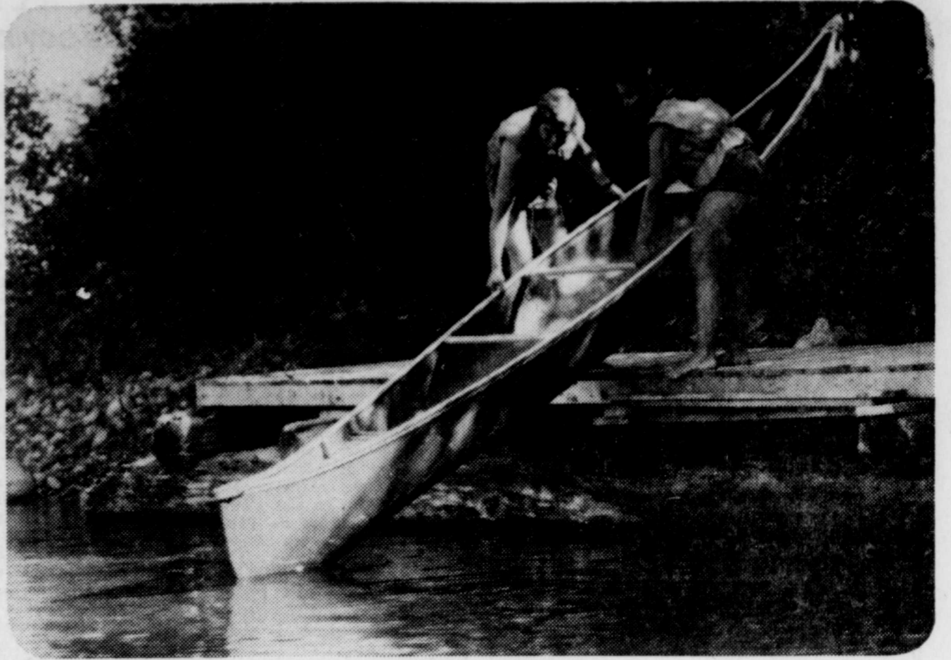
Les moniteurs de la Croix-Rouge seront au parc national de la Mauricie, samedi, pour vous initier aux notions de sécurité en canot ou en chaloupe.