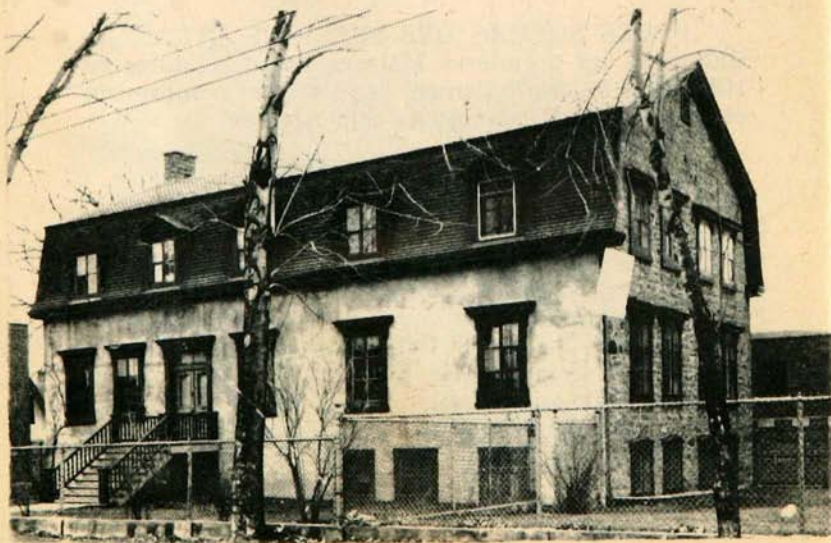
MAISON DE SAINT-LAURENT