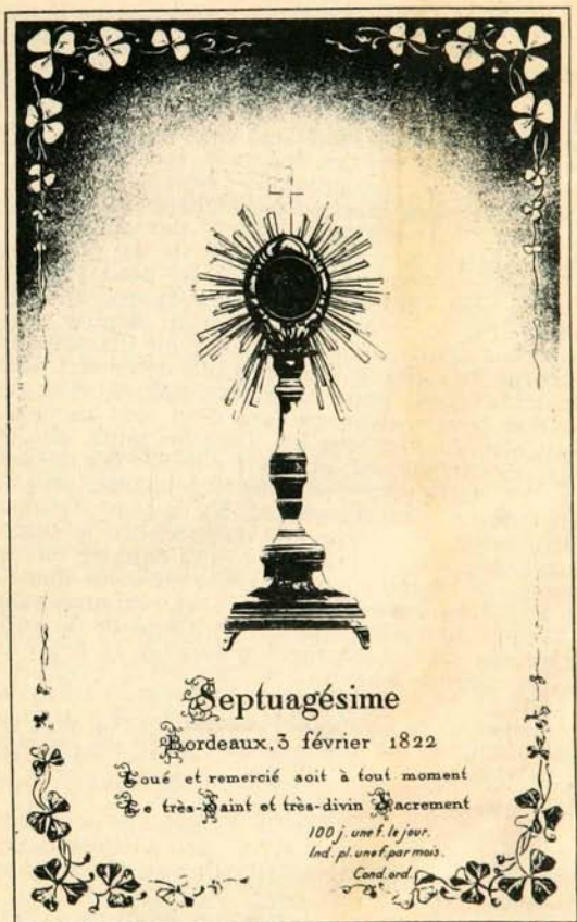
Ostensoir de l'Apparition