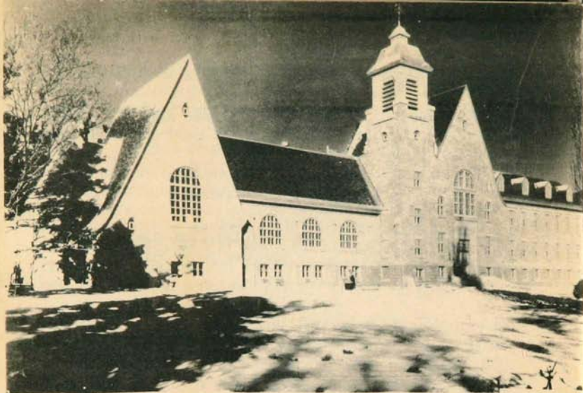
MAISON DU NOVICIAT DE SILLERY MAISON DE MONTRÉAL