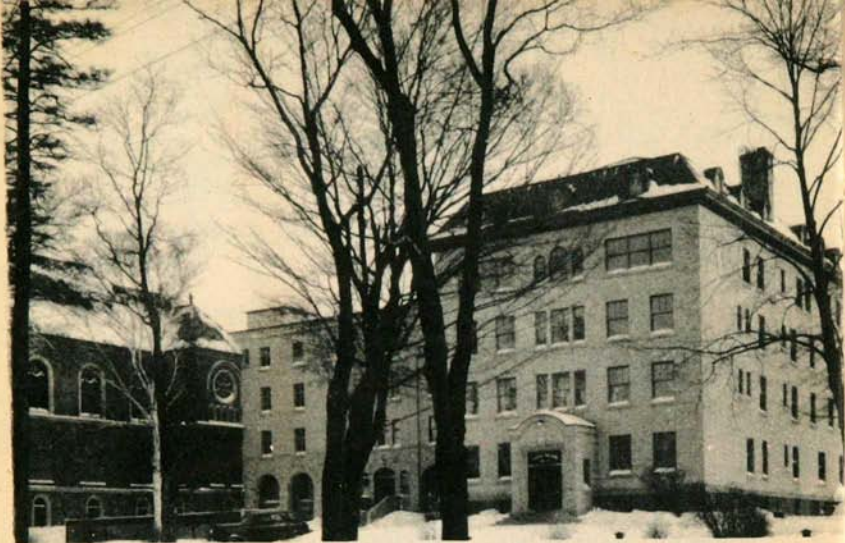
MAISON DE QUÉBEC