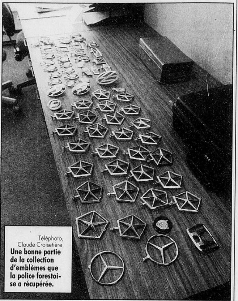
Une bonne partie de la collection d'emplèmes que la police forestoise a récupérée.

Quant aux propriétaires de véhicules intéressés à récupérer leur emblème, ils peuvent toujours communiquer avec la Sûreté municipale de Rock Forest, 564-6464.