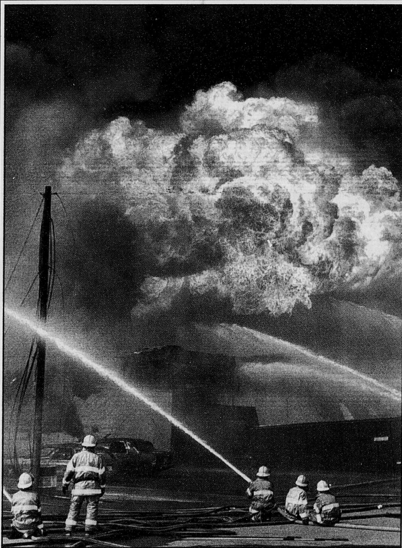
D'énormes boules de feu ont explosé dans le ciel de Laval, hier après-midi, causées par l'incendie de barils de peinture récupérée.