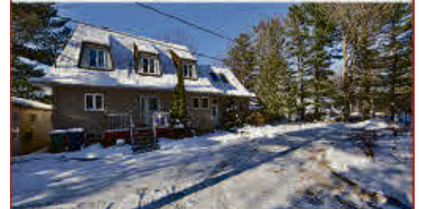
MLS 12179083, BORD DE L'EAU, Spacieux, ce cottage offre luminosité, boiserie, cachet et tranquillité!