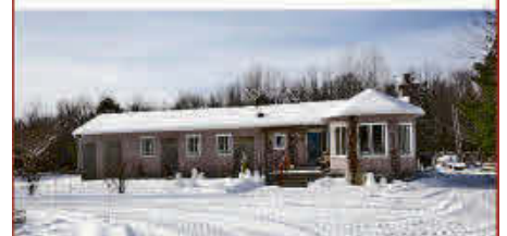
MLS 9949228, 45, de la Rivière, Roxton Falls, Belle d'autrefois, 4 chambres, garage, Libre immédiatement... Vendeur motivé, prix pour vendre!