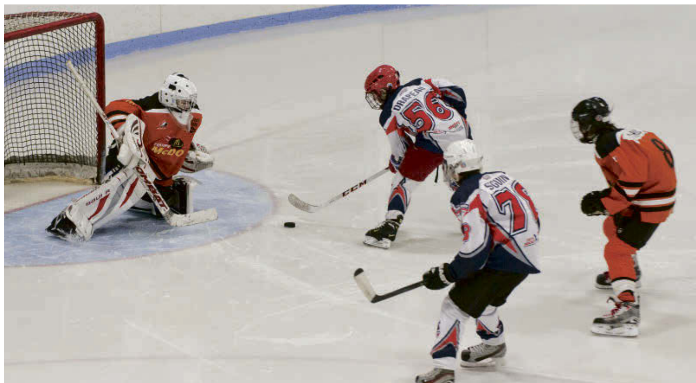
C'est dès demain que débutera la 50 e édition du Tournoi pee-wee, bantam et midget de Valcourt.

Il est possible de suivre le tournoi et de connaître le résultat des rencontres en visitant le www.tournoihockeyvalcourt.com .