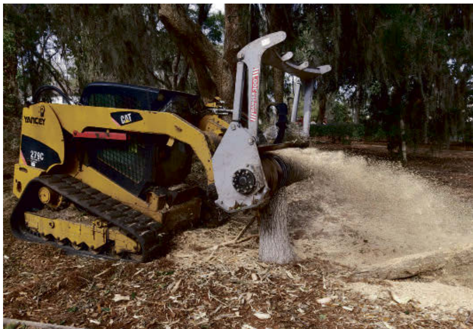
L'entreprise DENIS CIMAF, de Roxton Falls, passe aux mains de la compagnie américaine Morbark, ce qui lui permettra d'accélérer son développement au niveau international.