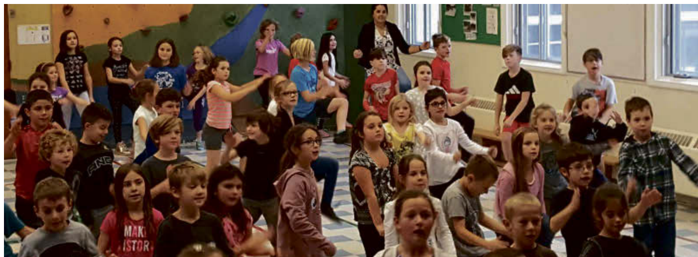
Dans le cadre de son activité « Un automne qui bouge ! », le RSEQ Montérégie a décerné son prix « coup de cœur » 2018 à l'école St-Pierre de St-Valérien de-Milton.