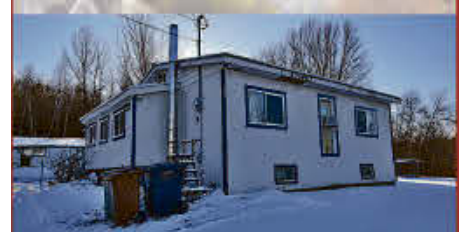
MLS 27298560, IDÉAL POUR UN FLU! Vous cherchez une propriété à mettre à jour? Voici une belle possibilité!