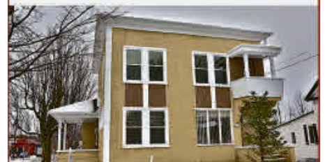
MLS 19862764, GRAND COTTAGE, Au cœur des services, cette propriété de 3 chambres, grand terrain à proximité de l'école, terrain de jeux, parcs, centre commercial!