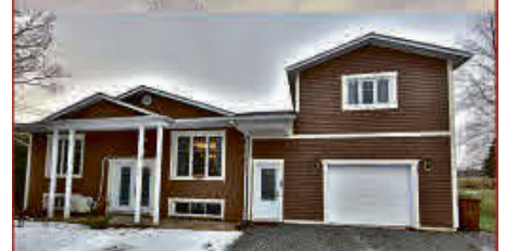
MLS 19443548, NOUVEAUTÉ, cette propriété au goût du jour offre 4 chambres et aucun voisin arrière. Un bijou à découvrir!