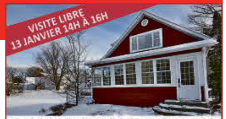
VISITE LIBRE 13 JANVIER 14H À 16H