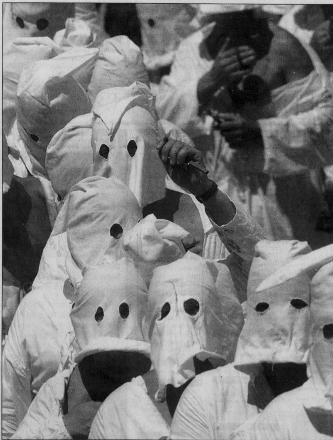
Les flagellants, au nombre de 4000 environ, parcourent les ruelles de Guardia Sanframondi, ce bourg perché aux maisons de pierre, protégées des regards par un capuchon blanc et une tunique immaculée entrouverte au niveau de la poitrine, en se frappant en signe d'expiation.