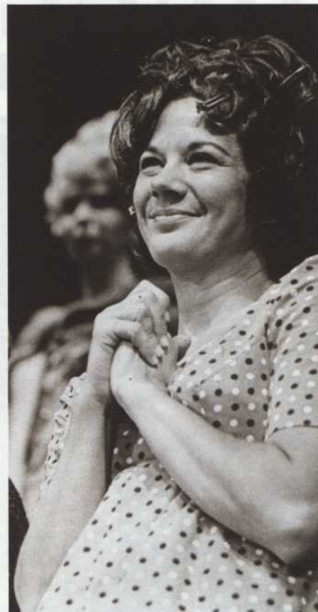
Denise Filiatrault 28 août 1968

D. F. : D'abord, j'ai un attachement profond pour Les Belles-Sœurs puis je trouve ça le fun de voir ces femmes qui sont pour la plupart des personnalités publiques, des journalistes ou des animatrices s'engager à relever ce défi. Je pense que ça va être une expérience mémorable pour elles, sur scène et une fête avec le public dans la salle.