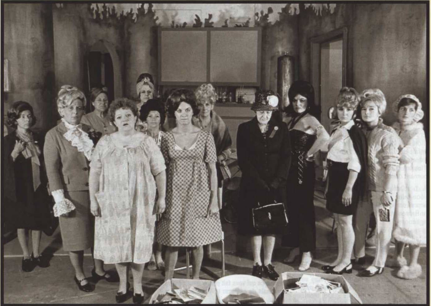
Les Belles-Sœurs, 1968