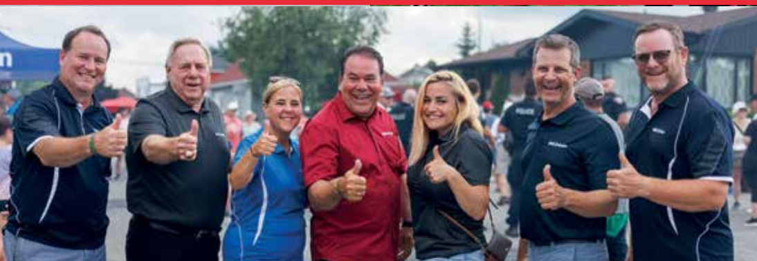
Épluchette de blé d'Inde