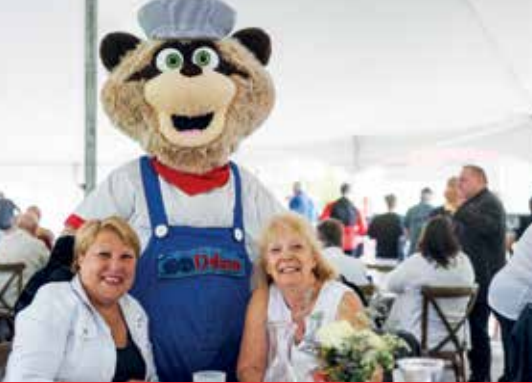
Brunch du conseil municipal