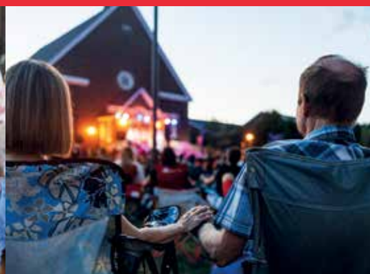
Spectacle de Vincent Vallières