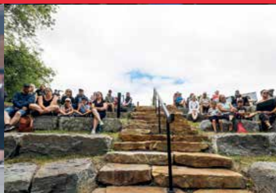
Concert au parc du Centenaire