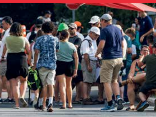
Épluchette de blé d'Inde