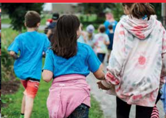
Camp de jour