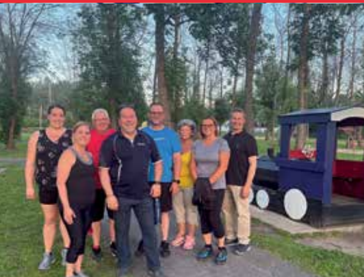
Vos élus dans les rues!