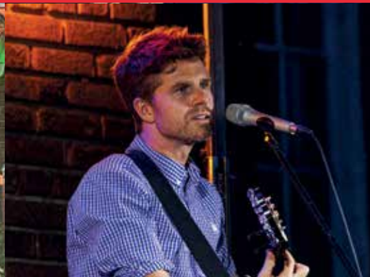
Spectacle de Vincent Vallières