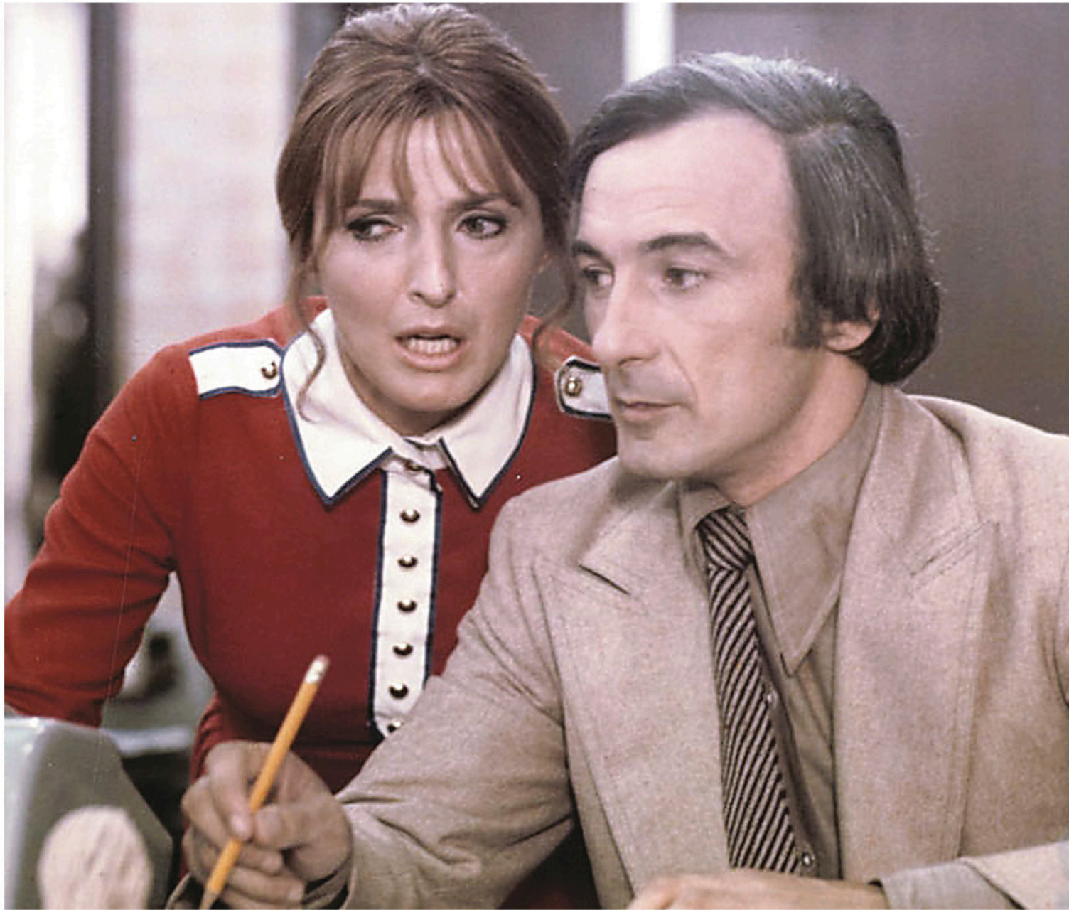
Dominique Michel et Yvon Deschamps partagent l'écran dans Tiens-toi bien après les oreilles à papa .

Dominique Michel y joue une dactylo fonceuse, amazone encombrée par son pucelage, travaillant pour des « pinottes », montée au créneau afin d'obtenir une aug-