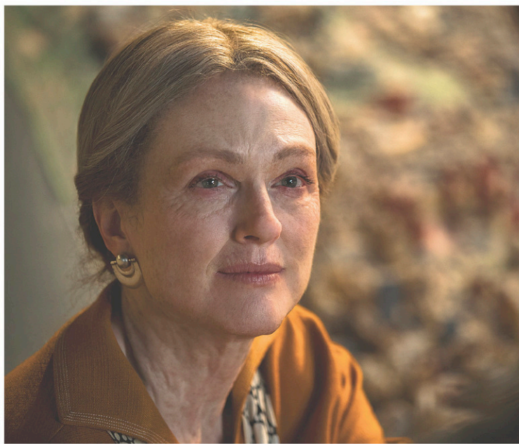
Julianne Moore dans Après la foudre , dont le scénario est basé sur le roman de Brian Selznick

« J'ai jamais l'idée de tourner un film pour les enfants qui serait unique, étrange et méticuleusement fabriqué, à l'ancienne, explique Todd Haynes. Ce n'est pas pour tous les enfants, j'en suis conscient, mais je voulais en