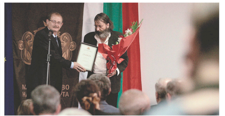
Inspiré d'un fait divers de 2001, Glory dénonce avec férocité la corruption du gouvernement bulgare.