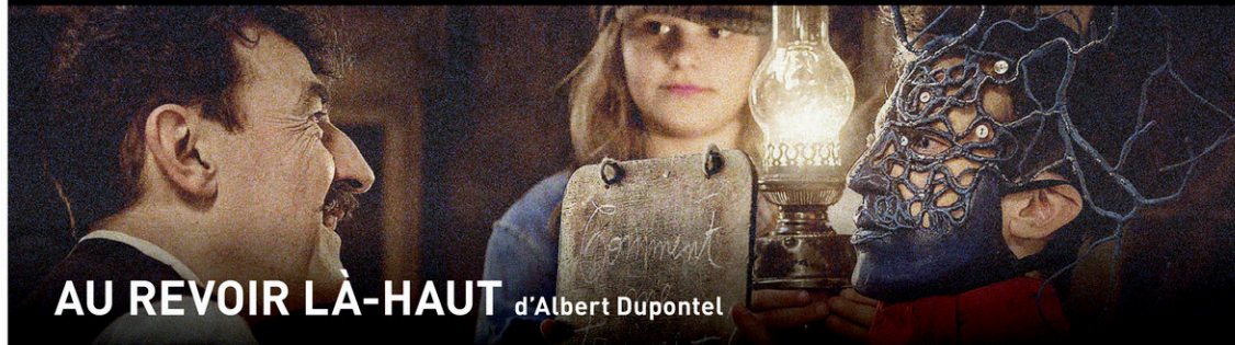
AU REVOIR LÀ-HAUT d'Albert Dupontel