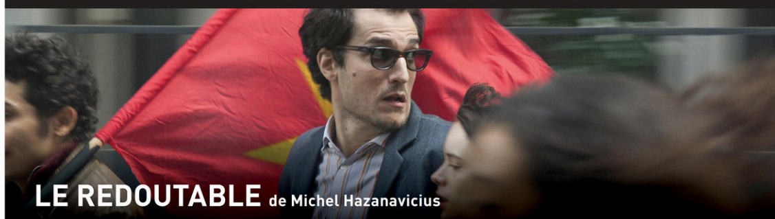
LE REDOUTABLE de Michel Hazanavicius