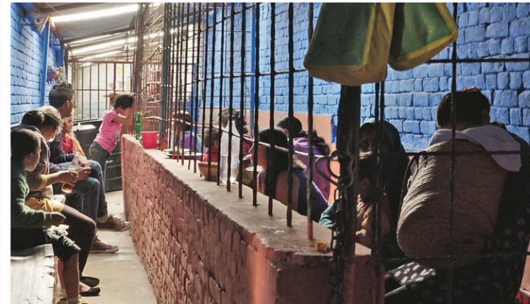
LES FILMS SÉVILLE

Au Népal, les enfants en bas âge vivent en prison avec leurs mères avant d'être placés dans une famille d'accueil ou recueillis par d'autres membres de la famille.