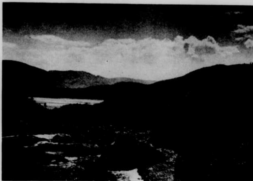
... des coins nouveaux et souvent inconnus

Chaque émission comportera également une interview avec un invité de marque interrogé par Gaétan Montreuil.