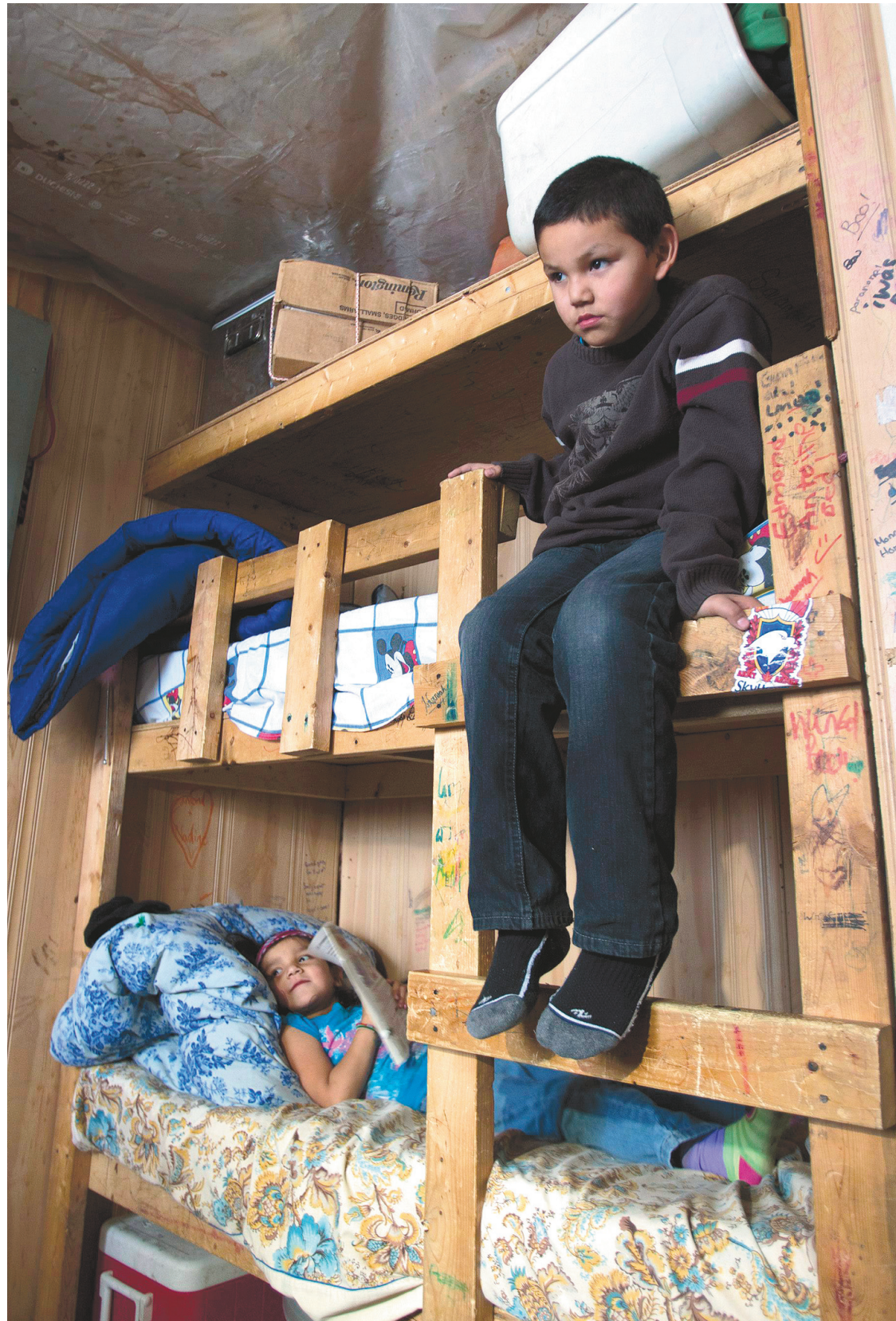
Les conditions de vie des autochtones canadiens contribuent aux taux élevés de prise en charge. Une vingtaine de personnes vivent dans cette maison de la communauté d'Attawapiskat, en Ontario.

La négligence — le défaut d'agir dans l'intérêt premier de l'enfant et posant un risque de préjudice au fil du temps — est le principal motif de prise en charge des enfants autochtones par les services sociaux, soit plus que les sé-