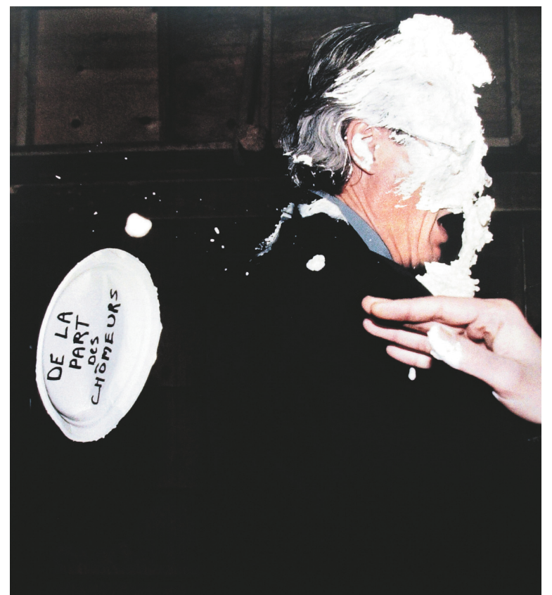
En 1999, le ministre libéral Pierre Pettigrew a subi la critique crémeuse des entartistes, qui dénonçaient l'accès de plus en plus restreint à l'assurance-emploi.