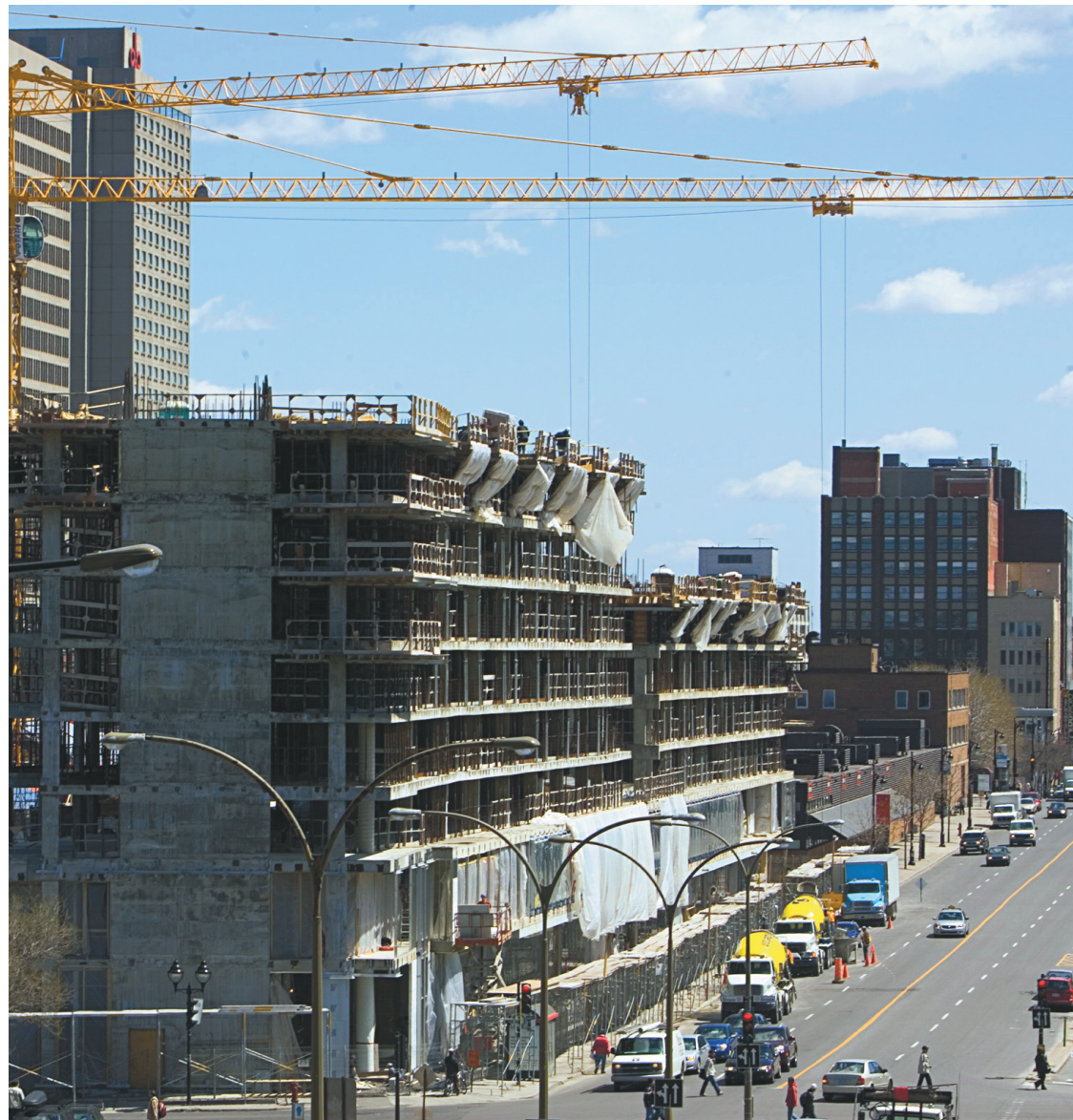
Les Montréalais qui s'aventurent au centre-ville peuvent contempler un monument rendant hommage aux prétentions entrepreneuriales de l'université: l'îlot Voyageur, ici photographié en 2007.

Outre la recherche subventionnée existe la recherche à des fins commerciales, lorsqu'une entreprise choisit de sous-traiter et d'offrir un