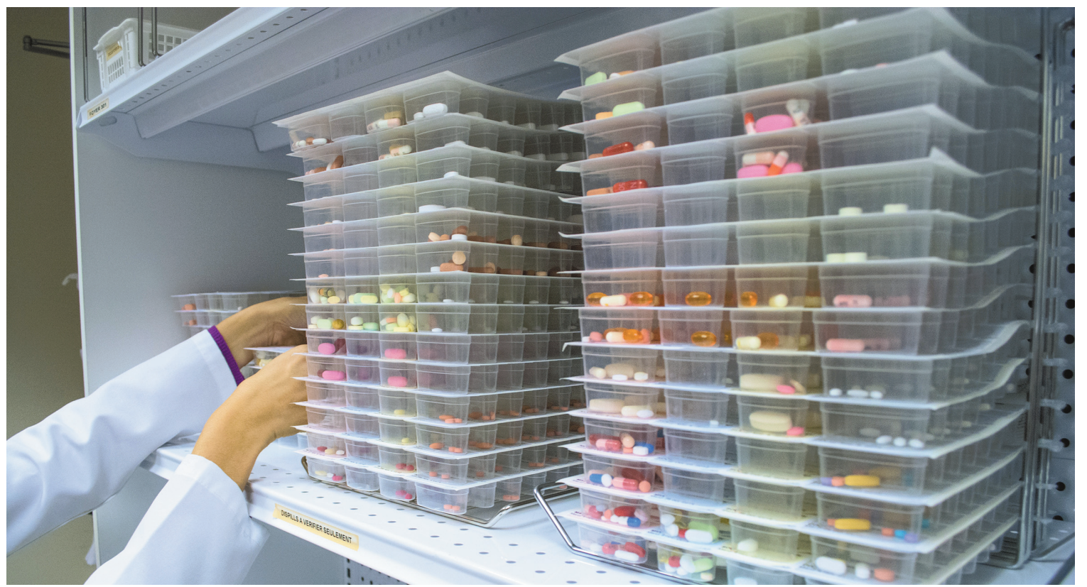
MICHAËL MONNIER LE DEVOIR

Les résultats présentés à Vancouver cette semaine marquent un tournant dans la lutte contre le sida.