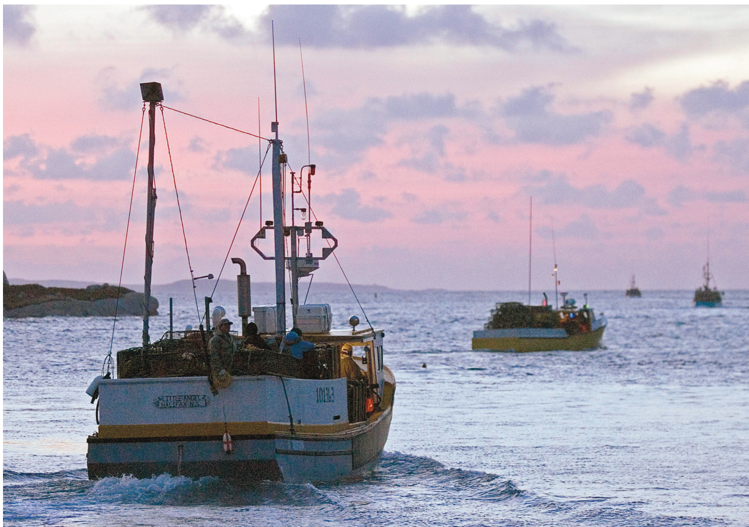
ANDREW VAUGHAN LA PRESSE CANADIENNE

Dans une lettre aux ministres fédéraux des Ressources naturelles, de l'Environnement et des Pêches, une vingtaine de communautés et d'associations de pêcheurs vivant et travaillant sur les côtes du golfe demandent au gouvernement de prendre le temps de bien mesurer les risques avant d'y entreprendre des travaux d'exploration.