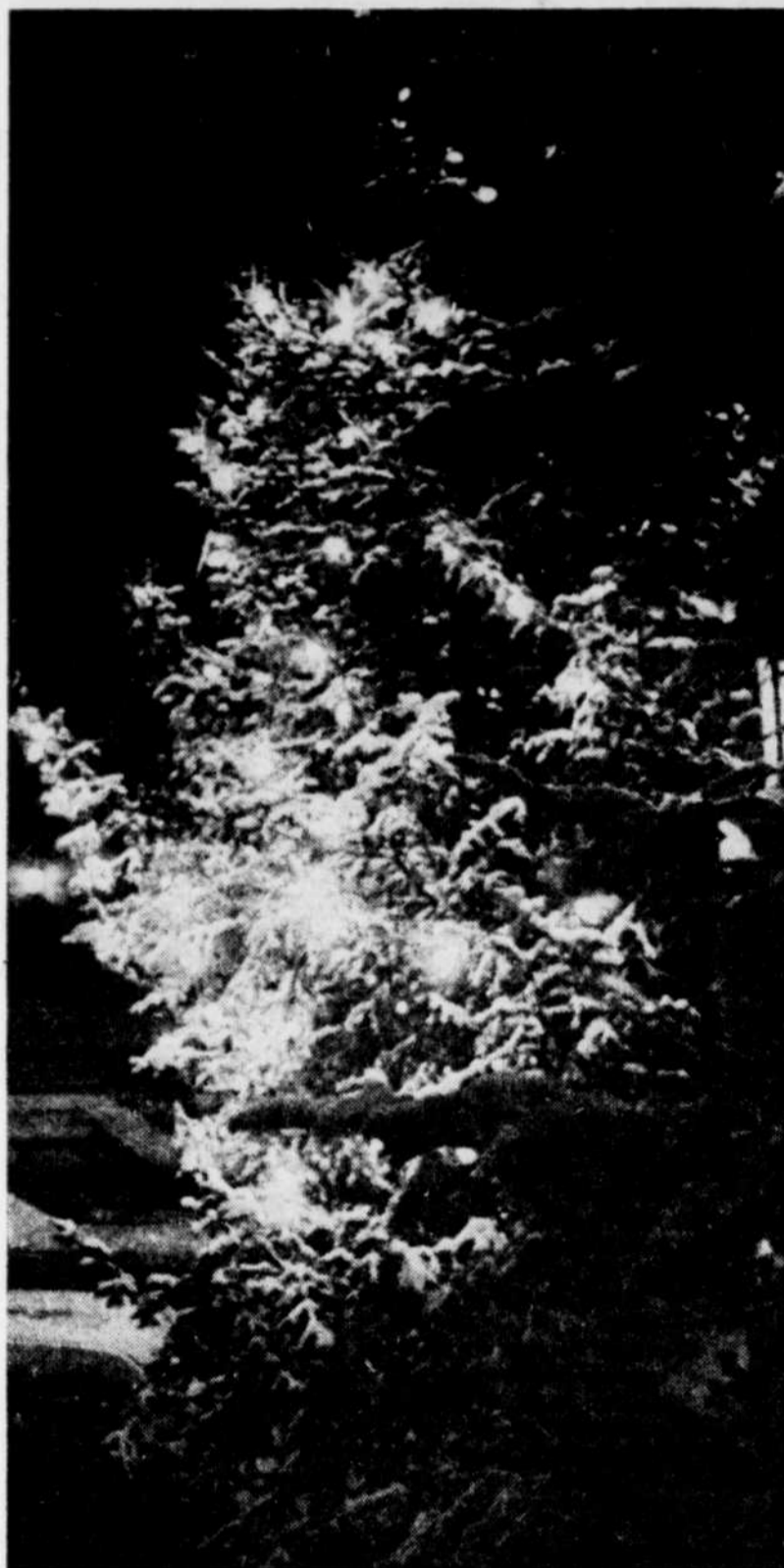
On peut décorer un arbre de son parterre à l'occasion de Noël, si on le fait avec délicatesse.

Finalement, ajoute M. Déry, il est très mauvais d'arroser l'arbre pour le glacer. Il y a alors danger de bris des branches, de brûlures par l'effet de loupe et même de courts-circuits. Un traitement qu'un conifère ne peut supporter.