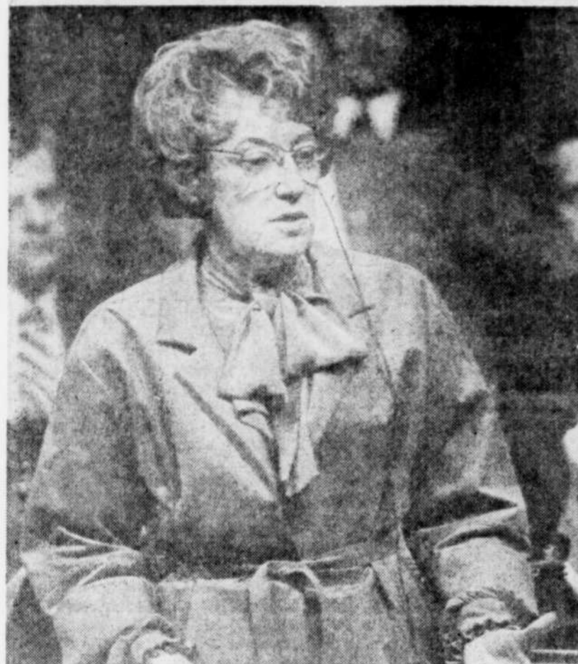
La ministre de l'Emploi et de l'Immigration, Mme Flora MacDonald.

Procurez-vous chaque jour la nouvelle section SPORT du SOLEIL