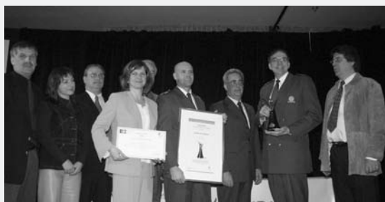
▲ CATÉGORIE RÔLE CONSEIL Sûreté du Québec Intégration des corps de police municipaux à la Sûreté du Québec