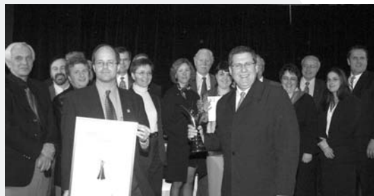
▲ CATÉGORIE RAYONNEMENT DE LA PROFESSION Groupe interministériel Organisation et tenue de la Conférence internationale francophone 2002