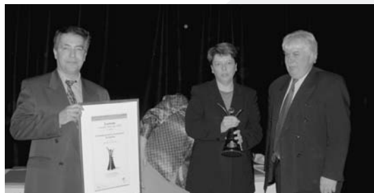
▲ CATÉGORIE MANDAT DE VÉRIFICATION Commission de la construction du Québec Gestion des examens de qualification professionnelle