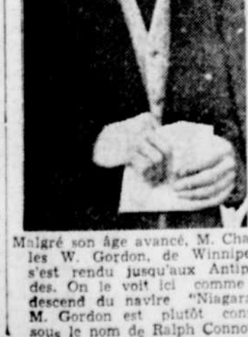
Malgré son âge avancé, M. Charles W. Gordon, de Winnipeg, s'est rendu jusqu'aux Antipodes. On le voit ici comme il descend du navire "Niagara". M. Gordon est plutôt connu sous le nom de Ralph Connor.