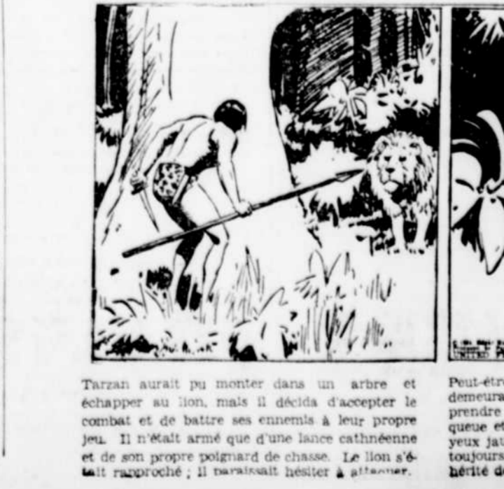
Tarzan aurait pu monter dans un arbre et échapper à son ennemi...