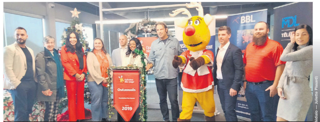
La fondation Pat-Burns a lancé la 39 e campagne de l'Opération nez rouge en Outaouais avec pour but de récolter 25 000 $ de dons pour rendre les routes plus sécuritaires durant le temps des fêtes du 24 au 31 décembre.

Si, depuis la pandémie, il est plus difficile de recruter des bénévoles, ce dernier assure qu'environ 150 bénévoles sont déjà inscrits malgré un contexte économique précaire. «C'est sur qu'on doit faire face à certains défis notamment dans le contexte économique actuel, mais je pense que les gens vont mettre la main à la pâte, et qu'on va avoir du monde», explique-t-il. Cette année, l'entrepreneur général BBL Construction offrira un local pour toute la durée de la campagne. Les bénévoles pourront s'y retrouver dès 18 h