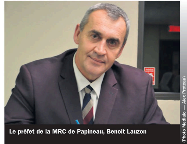
Le préfet de la MRC de Papineau, Benoit Lauzon

La MRC de Papineau a déposé à cette séance un avis de motion concernant le suffrage universel. Rappelons que la MRC souhaite que le préfet soit élu par la population lors des prochaines élections municipales qui auront lieu en 2025.