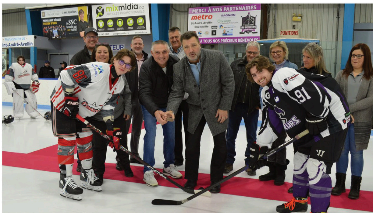
Stéphane Richer a fait plaisir aux hockeyeurs présents à l'aréna portant son nom le 24 novembre dernier.

En discutant avec l'ancien attaquant de la LNH, celui-ci explique pourquoi il est primordial pour un jeune joueur d'avoir la chance de rencontrer son idole. «Je suis très impressionné par l'implication des parents dans ces types d'événements, ils sont si bénéfiques pour le succès des jeunes. J'ai un grand respect envers eux et j'aime bien voir l'enthousiasme de tout le monde. Il ne faut pas oublier l'organisation d'une telle soirée qui est derrière ça, je lève mon chapeau aux bénévoles qui ont fait du bon boulot», ajoute-t-il. «J'espère que les jeunes, surtout dans mon patelin, puissent s'identifier à moi et croire qu'ils peuvent réussir peu importe leur choix futur de carrière. C'est bien d'avoir un aréna en son nom, je souhaite simplement que ces gens qui sont dans la fleur de l'âge prennent conscience de tout le travail que cela demande pour accomplir un rêve», poursuit-il.