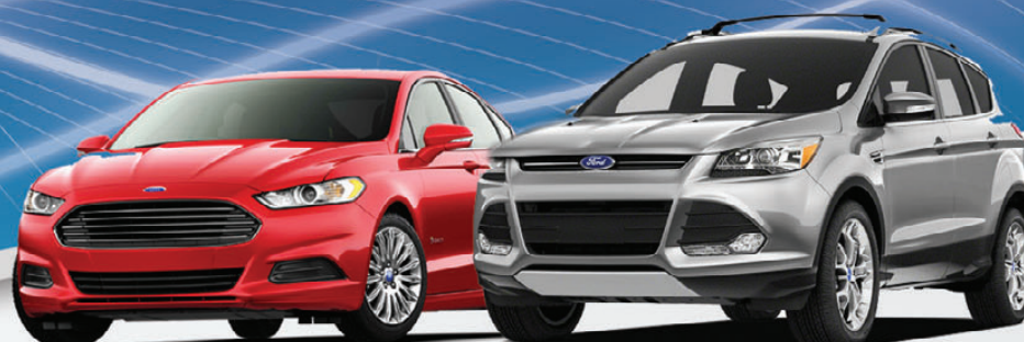
Ford Fusion 2013