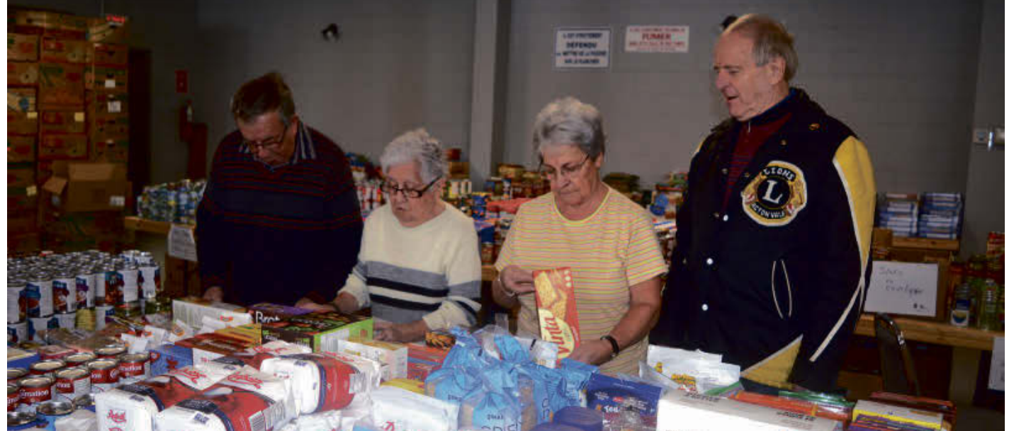
La traditionnelle Guignolée du Club Lions d'Acton Vale démarrera le 15 décembre.