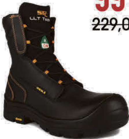
STC - S1LOCUSNOI