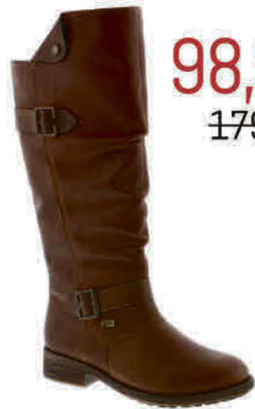
Remonte - RMD80751T2