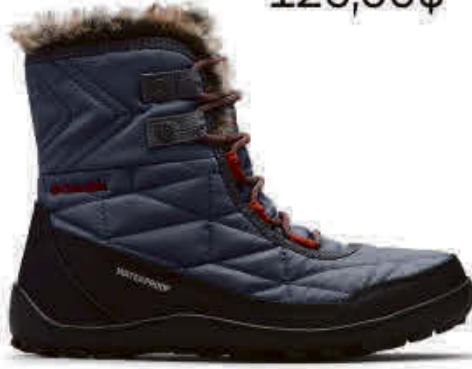
Columbia - CB180317G9