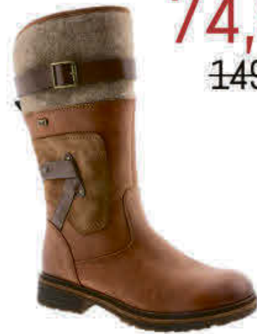
Rieker - RK947616T9