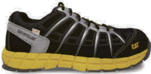
Caterpillar - CT20031NOI