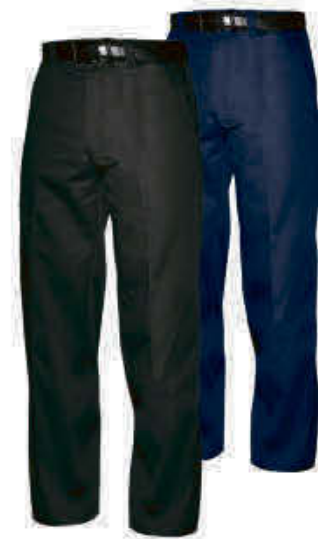
Nat's - NTWS150NOI/MAR

* Les clients sous contrat sont exclus de ces promotions. ** Les rabais de 25% sur les vêtements de travail et 15% sur les chaussures de sécurité s'appliquent uniquement sur les prix réguliers.