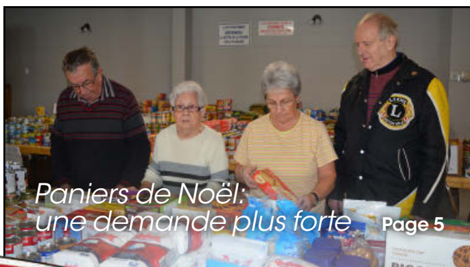
Paniers de Noël: une demande plus forte Page 5