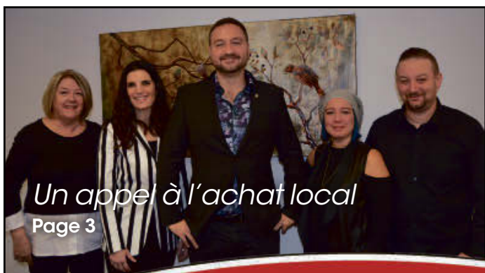
Un appel à l'achat local Page 3