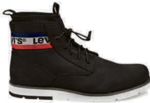
Levis - L2JAXLI4N9