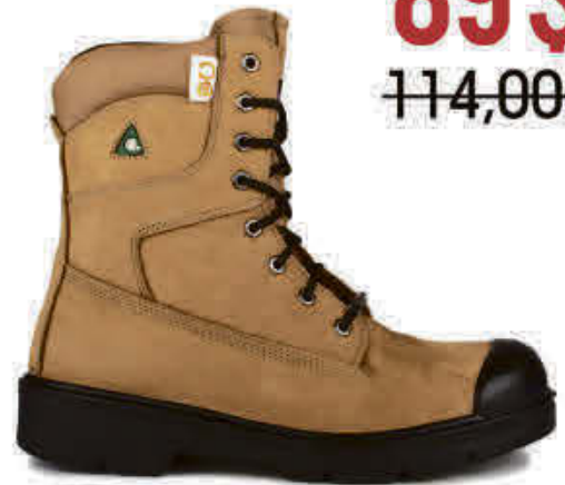
Acton - AC9045-TAN/NOI