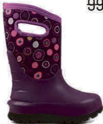
Bogs - BG724416M0