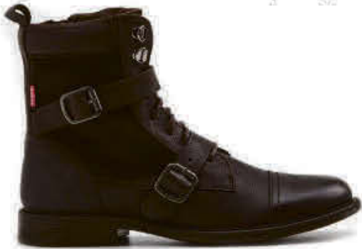
Levis - L2MAINE1N1