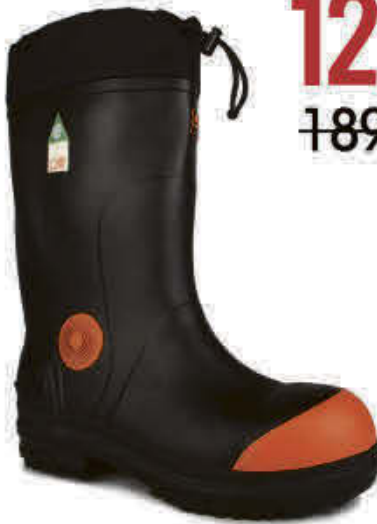
STC - S1BEAUFNOI