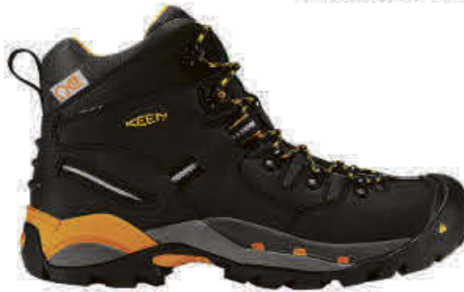
KEEN - KN16982NOI