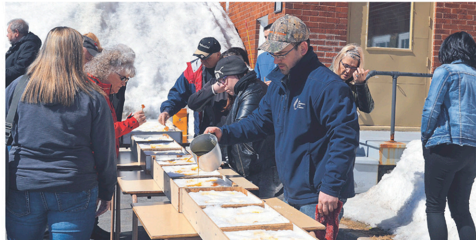
En après-midi, les gens pouvaient se sucrer le bec avec la traditionnelle tire sur la neige à l'extérieur de la salle paroissiale.