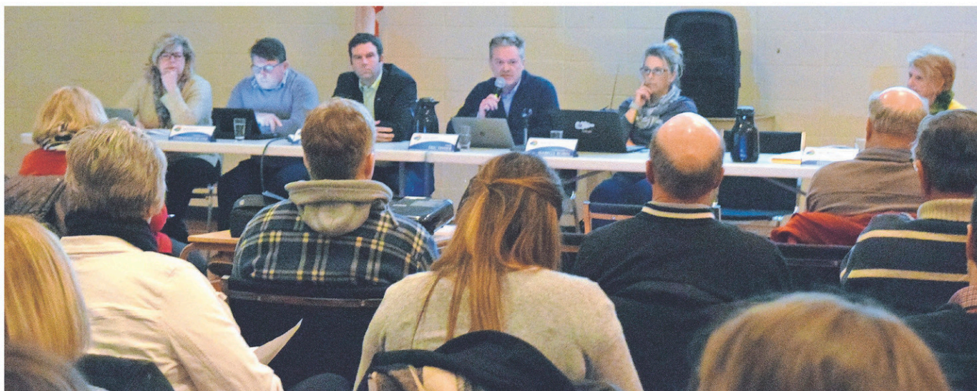
Près de 80 personnes se sont déplacées pour la séance de lundi soir dernier.

La municipalité a d'ailleurs adopté des résolutions dans le but de recruter de l'expertise en matière légale et de mieux communiquer avec ses citoyens, lors de sa séance régulière de lundi dernier. Des initiatives qui en ont fait sourciller plusieurs. Le maire Tessier estime toutefois que ces démarches sont essentielles. «Saint-Michel est en changement et nous avons besoin d'aide pour gérer ce changement. Nous sommes rendus à se transformer et il faut non seulement que le conseil soit accompagné, mais aussi le personnel et le citoyen. On sort tout le monde de la zone de confort où nous étions et il faut investir pour tout ça. Des fois il faut dépenser pour sauver de l'argent. On investit avec la conviction que nous ferons plus avec moins de ressources.»