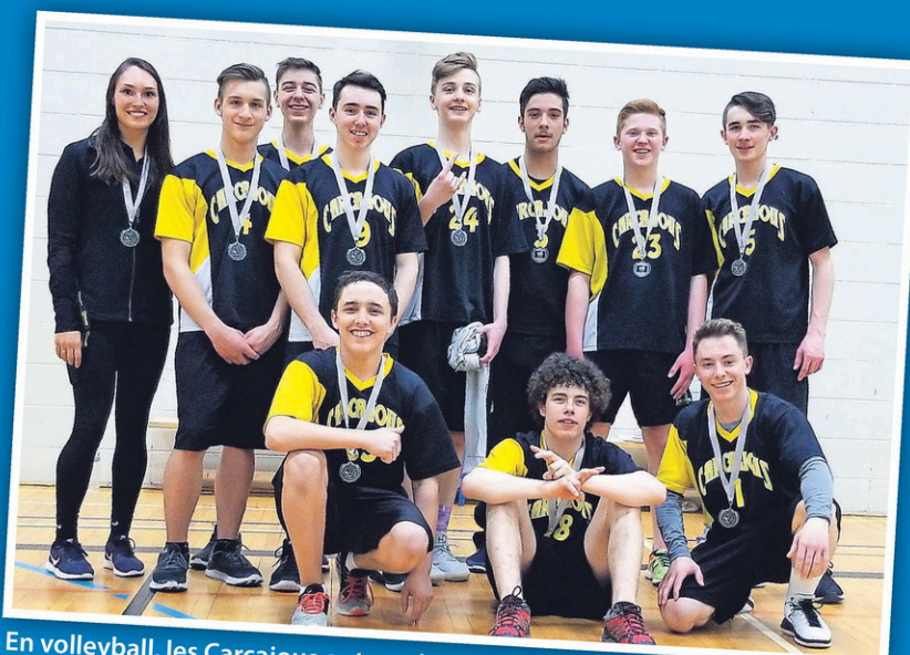
En volleyball, les Carcajous ont perdu en grande finale chez les cadets également.