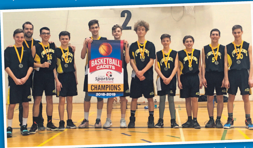
La formation de basket-ball a remporté la bannière de champions chez les Cadets.

Soulignons par ailleurs que la formation Cadet masculin des Carcajous est passée bien près de remporter la bannière de champions en volleyball, s'inclinant 25-22 devant les Patriotes de la Polyvalente Saint-Martin lors de finale de la Ligue interscolaire. Cette rencontre avait lieu le 20 mars dernier au gymnase de la Polyvalente des Abénaquis. (S.L.)