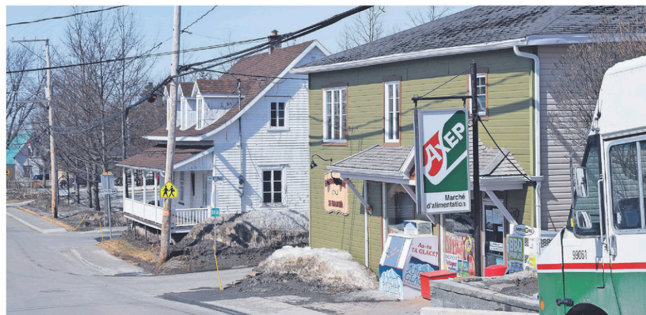
Voisine de l'épicerie du village, la Maison Bissonnette de Saint-Malachie sera finalement démontée et reconstruite ailleurs, pour ensuite faire place à un stationnement public.