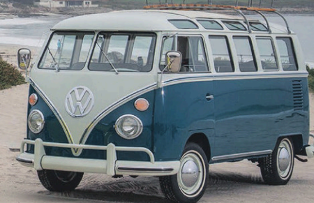
Le concept I.D. Buzz de Volkswagen

Après s'être fait l'apôtre des moteurs diesels, voilà que Volkswagen change son fusil d'épaule. À la suite du développement de la plateforme MQB, qui se trouve sous la majorité des véhicules à essence de la marque, Volkswagen a investi dans la plateforme MEB, qui servira de base pour tous les futurs modèles électriques de sa famille modulaire I.D. Grâce à cette flexibilité, ce châssis pourrait donner à VW un avantage décisif sur la concurrence dans le secteur des économies d'échelle. En effet, cette plateforme est conçue pour générer du volume en utilisant les mêmes pièces dans une grande variété de modèles. D'ici la fin de 2022, les marques VW, Audi, Skoda et Seat auront lancé 27 modèles basés sur cette nouvelle plateforme.