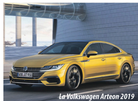
La Volkswagen Arteon 2019

Après une remise à niveau de la Jetta plus tôt l'an dernier, c'est au tour de la Passat de faire peau neuve cette année. Volkswagen a aussi commencé la vente de l'Arteon, qui succède à la Passat CC comme berline, au style coupé à 4 portes qui vient avec un petit 4 cylindres 2,0 litres turbo de 268 chevaux. Enfin, 2019 sera la dernière année de la Beetle, la plus célèbre des voitures du groupe Volkswagen, apparue en 1936.