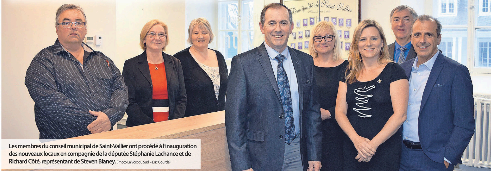
Les membres du conseil municipal de Saint-Vallier ont procédé à l'inauguration des nouveaux locaux en compagnie de la députée Stéphanie Lachance et de Richard Côté, représentant de Steven Blaney.