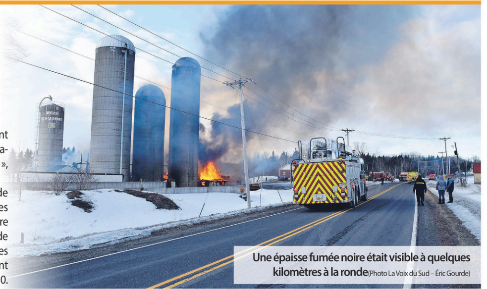
Une épaisse fumée noire était visible à quelques kilomètres à la ronde

Ce dernier ajoute que la cause probable de l'incendie serait une défaillance mécanique des équipements servant à mouler le grain, ou encore une simple défaillance électrique. Une vingtaine de vaches laitières du troupeau d'environ 160 bêtes ont pu être sorties du bâtiment. Les pompiers sont demeurés sur les lieux jusqu'aux environs de 23h30.