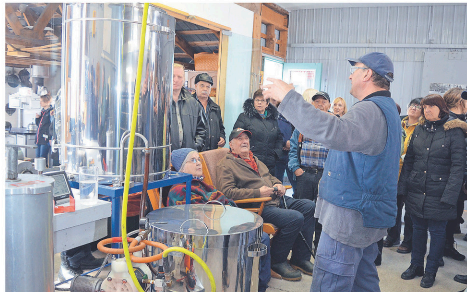
Des visiteurs attentifs à l'Érablière Goupil.

Le comité des loisirs assure que l'activité sera de retour en 2020 avec une programmation bonifiée.