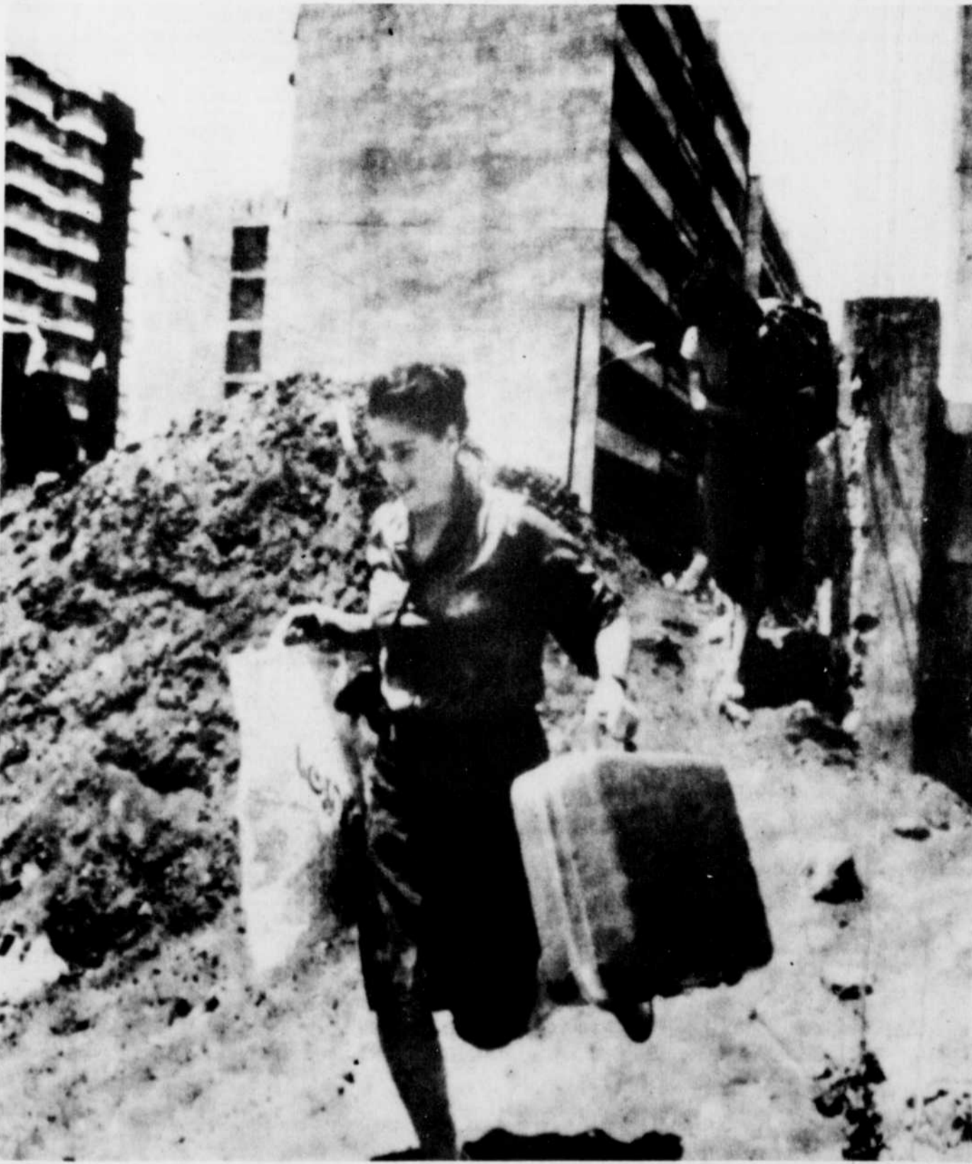
Tout est en ruines dans Beyrouth ouest et quand le bruit des canons et des bombes se fait entendre, on voit des femmes s'enfuir à toutes jambes, portant un sac ou une valise.

L'entretien de dimanche après-midi, à Jambour (est de Beyrouth), entre M. Habib et le ministre israélien de la Défense, M. Ariel Sharon, n'a débouché sur aucun accord politique. Selon la "Voix du Liban" (radio phalangiste), M. Sharon a déclaré, après cette rencontre, que l'absence d'un accord politique pour le départ des Palestiniens était dû au refus des pays arabes d'accueillir les combattants palestiniens. "Les combattants palestiniens doivent quitter Beyrouth d'une manière ou d'une autre", a-t-il ajouté. Pourtant, les discussions concernant l'arrivée éventuelle d'une force multinationale semblaient avoir sensiblement progressé. De source diplomatique occidentale, on avait indiqué, samedi, que la première étape de l'évacuation des combattants palestiniens s'effectuerait par mer, à destination du port jordanien d'Akaba, via le canal de