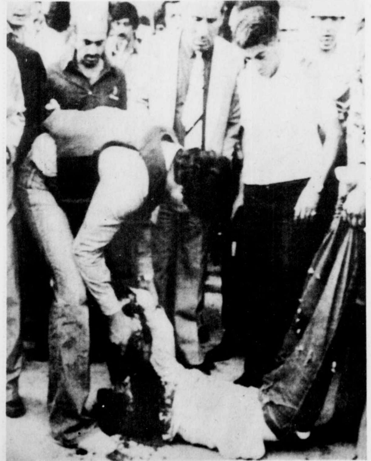
Le corps d'un des membres du "commando-suicide" est recueilli à l'aéroport d'Ankara après qu'il ait été tué par des policiers lors du massacre qui a coûté la vie à six personnes.

Les deux membres du commando, selon d'autres sources, auraient présenté à l'hôtel des passeports égyptiens établis aux noms de (Yusuf) Samir et (...) Vejdi, dont les restes, brûlés, ont été retrouvés dans les toilettes de l'établissement.