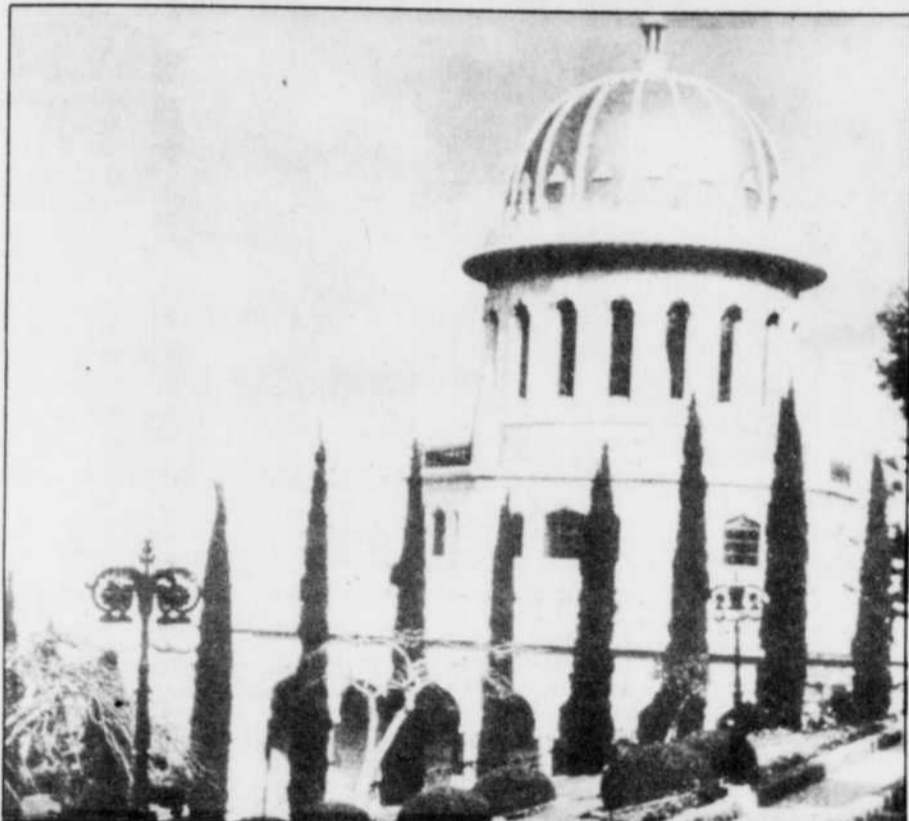
Le Mausolée du Bab, à Haïfa, en Israël.

Un jeune homme de 19 ans, Mirza Yahia, surnommé "Sobhe Azal" (matin de l'éternité) prend alors la direction de la secte dont le nombre d'adeptes augmente de jour en jour, surtout en milieu rural. Des bandes armées de Babis parcourent le pays pour propager la nouvelle religion et tentent de s'emparer de diverses villes. Accusé déjà d'avoir complété le meurtre du premier ministre, ils se rendent responsables, en août 1852, d'une tentative d'assassinat sur la personne même du souverain, Nasser-edine Chah. A partir de cette date, s'ouvre en Iran une période de répres-