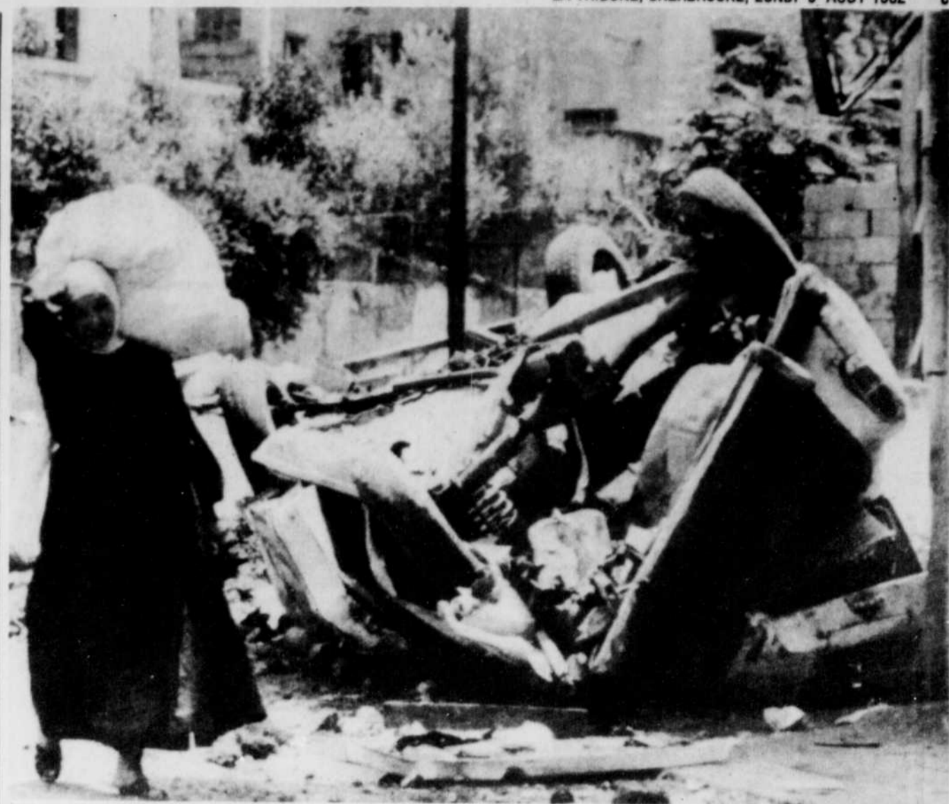
De nombreux habitants de Beyrouth ouest continuent à abandonner leur foyer détruit, en transportant leurs maigres biens, pour venir grossir les rangs des réfugiés dans l'est de la ville.