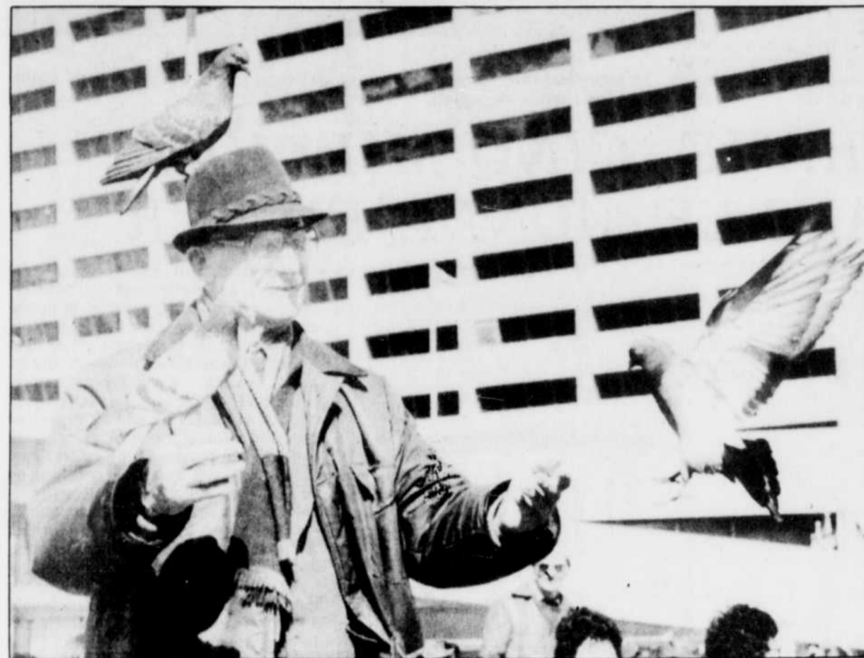
L'humanité se voit pour la première fois confrontée au phénomène du vieillissement.

sant des victimes innocentes, notamment parmi les personnes âgées", rappelle-t-on.