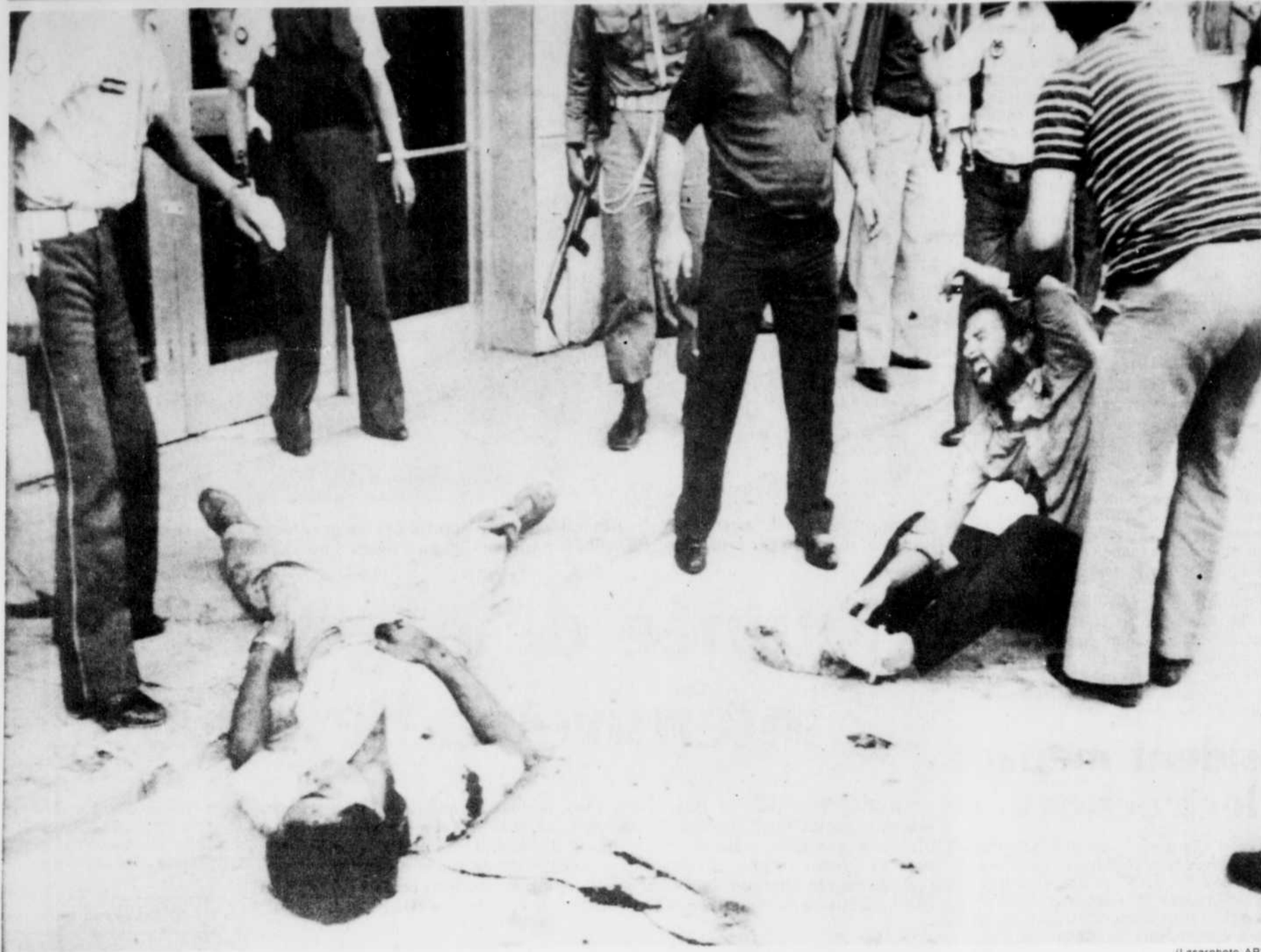
Un citoyen turque n'a pu réprimer des larmes après avoir vu son frère tomber sous les balles du "commando-suicide" arménien, samedi à Ankara.

ANKARA (AP) — Un "commando-suicide" arménien de deux personnes a attaqué à la bombe et à la mitrailleuse l'aéroport d'Ankara, samedi après-midi, tuant neuf personnes et en blessant 71.