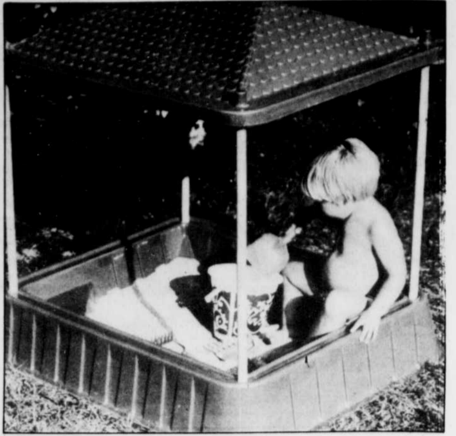
Le bac de sable sous abri permet aux tout petits de jouer sans craindre les rayons du soleil.

Un autre jeu d'adresse, c'est celui qui se joue avec des bâtons et une balle un peu plus grande qu'une balle de tennis. Il faut la lancer avec la batte et la diriger entre deux baguettes dressées sur le terrain.