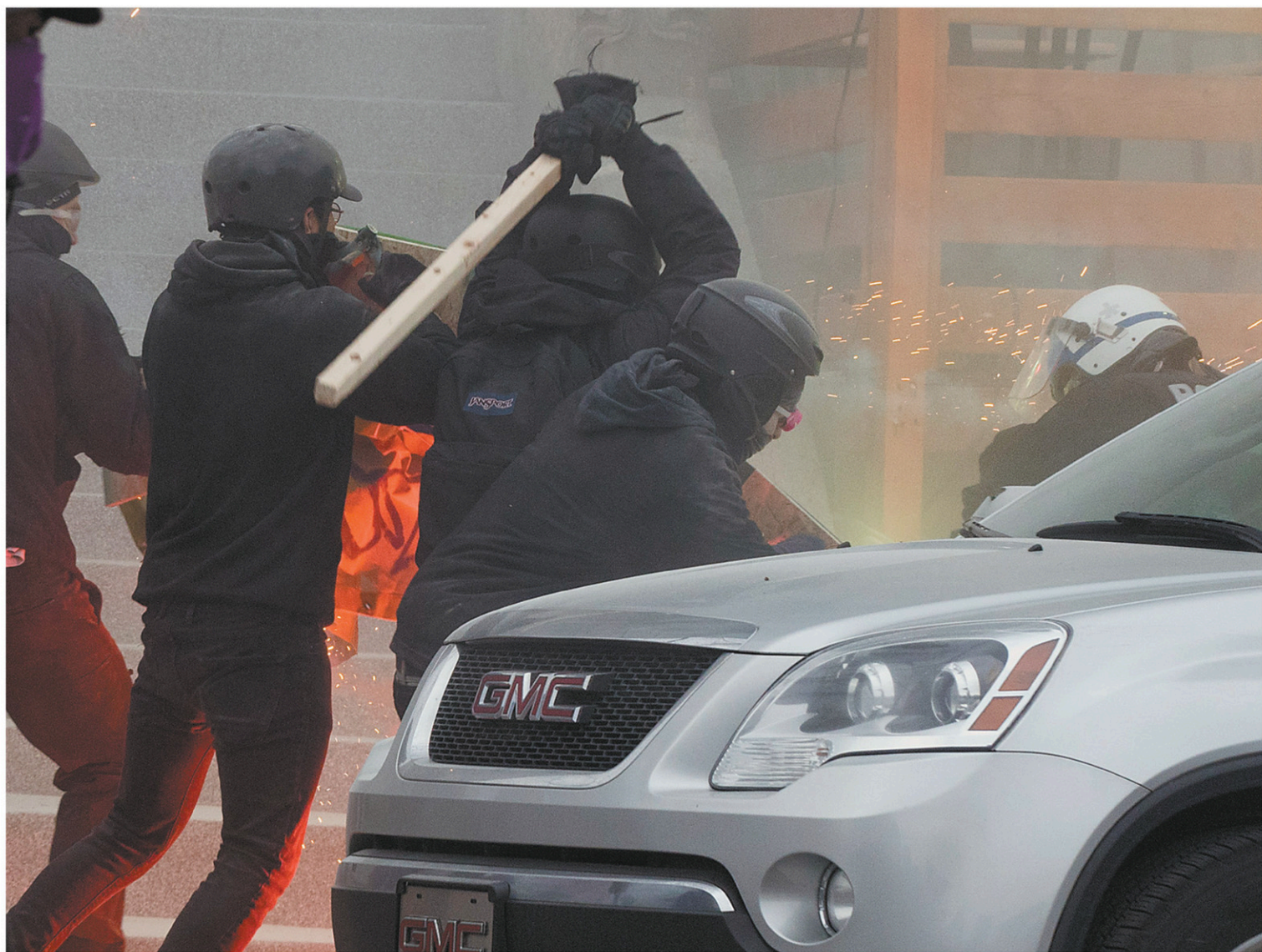
Un affrontement entre des protestataires cagoulés et des policiers a divisé le groupe de manifestation à peine cinq minutes après le début du rassemblement.