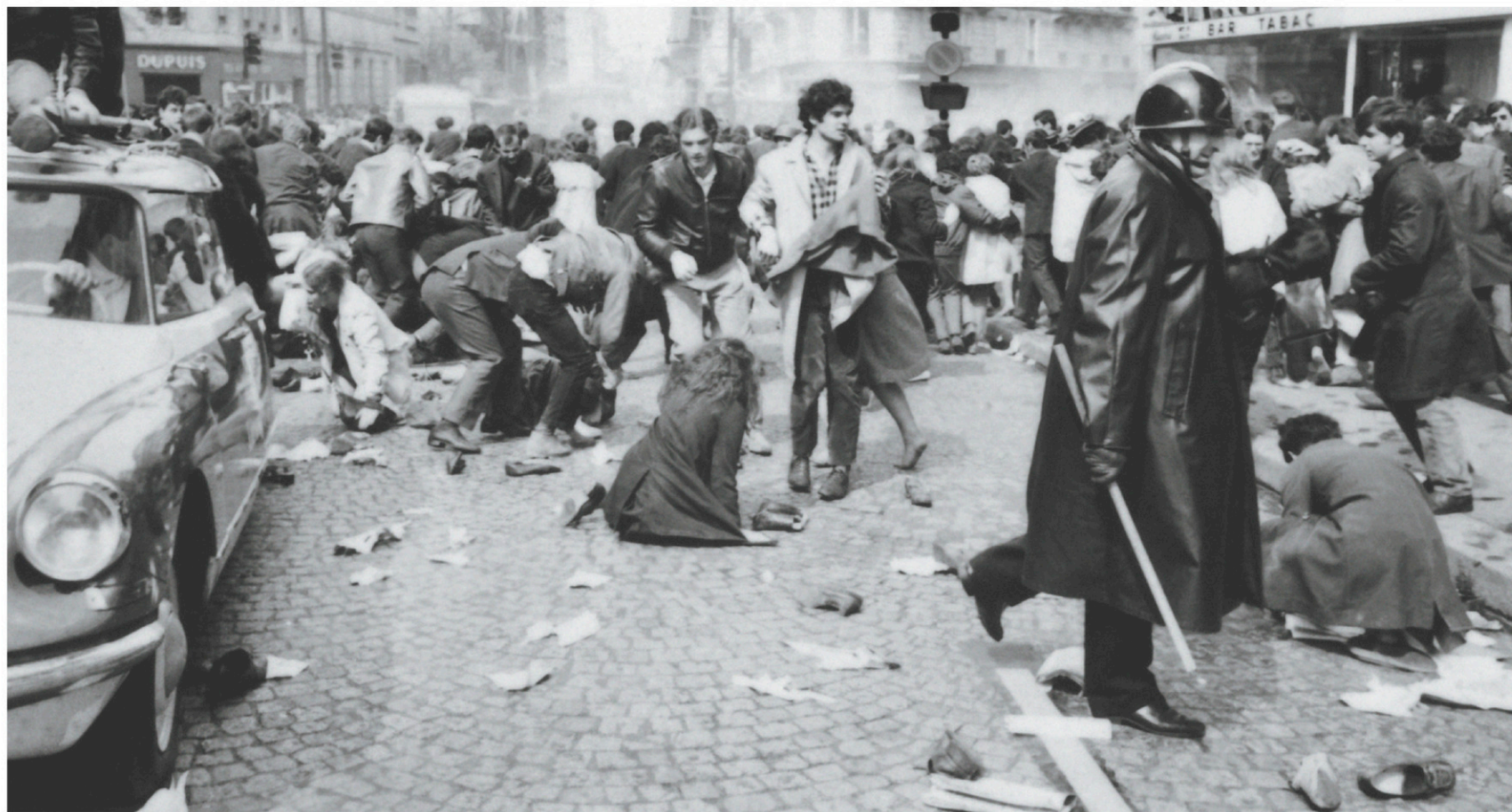
Des policiers manient la matraque rue Saint-Jacques, à Paris, lors des heurts entre les manifestants et les forces de l'ordre qui bouclaient le Quartier latin le 6 mai 1968, pendant les événements de mai-juin 1968.

fpelletier@ledevoir.com Sur Twitter : @fpelletier1