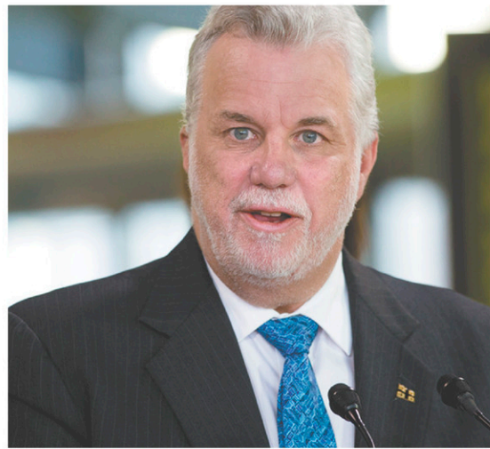
Le premier ministre Philippe Couillard

La Cour suprême a d'ailleurs reconnu la nature quasi constitutionnelle du droit à l'information, car il touche des droits fondamentaux reconnus par la Constitution.