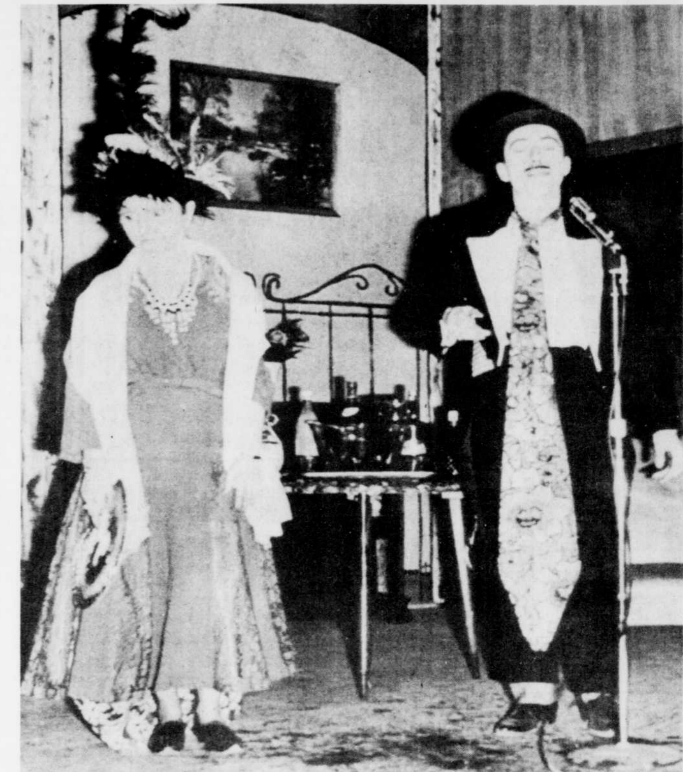
La Poutine, une des grandes comédiennes du burlesque québécois pendant une quarantaine d'années, lorsqu'elle jouait en compagnie de Gilles Latulippe au Théâtre des Variétés.

M. Latulippe, cependant, refusa de se déclarer vaincu, et en 1967 donna au burlesque québécois un nouveau