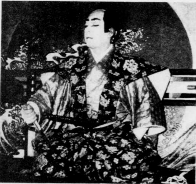
Le Dieu Japon

Pour les Fils du Soleil Levant, le Japon est éternel. Pour beaucoup d'entre nous, cependant, le doux pays des cerisiers en fleurs, des estampes et des geishas est chose du passé, ou conservé dans un vaste musée pour touristes. Pourtant, c'est dans l'équilibre des forces matérielles et spirituelles que le Japonais a toujours puisé son énergie.