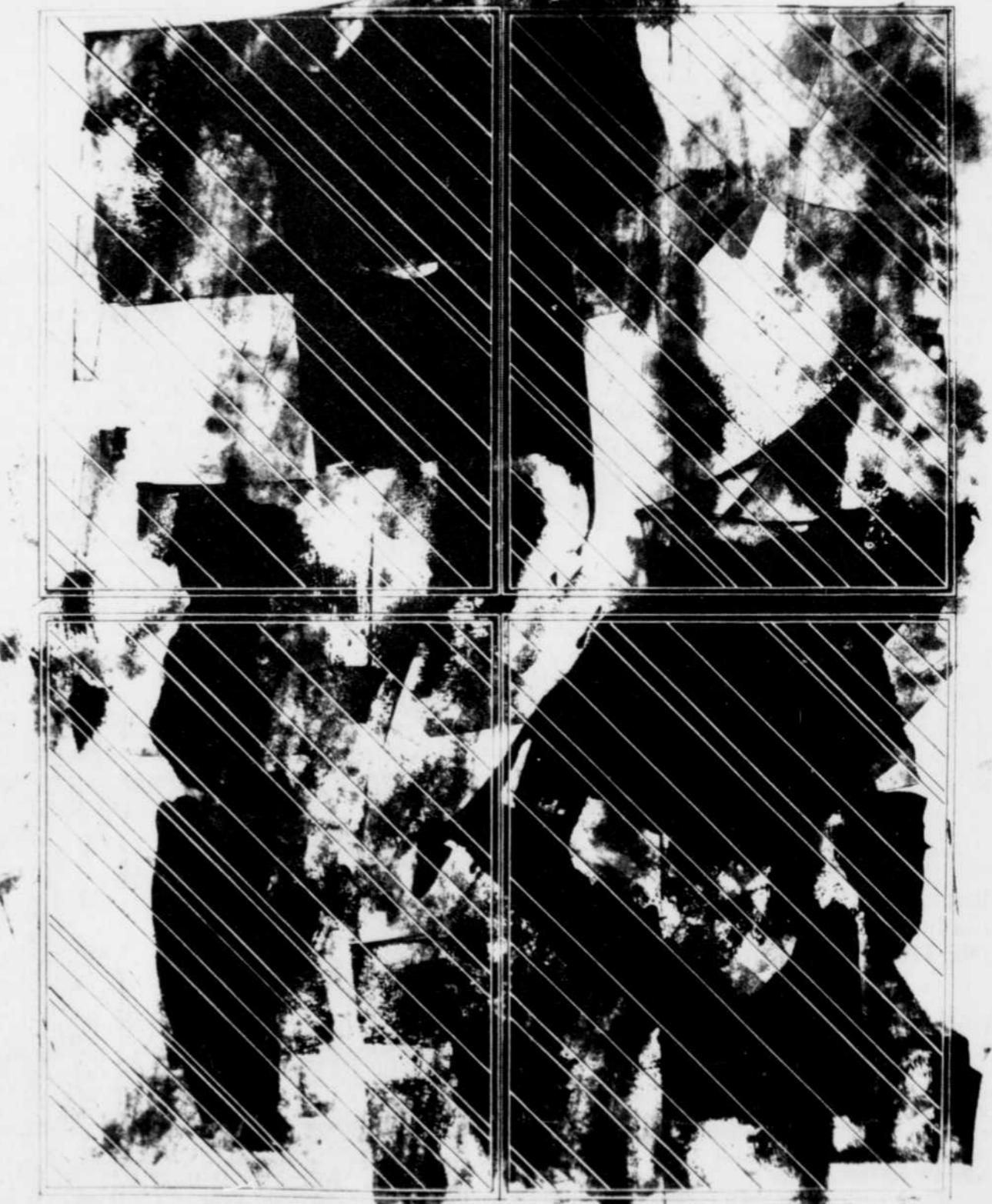
Dessin de Claude Lafrance