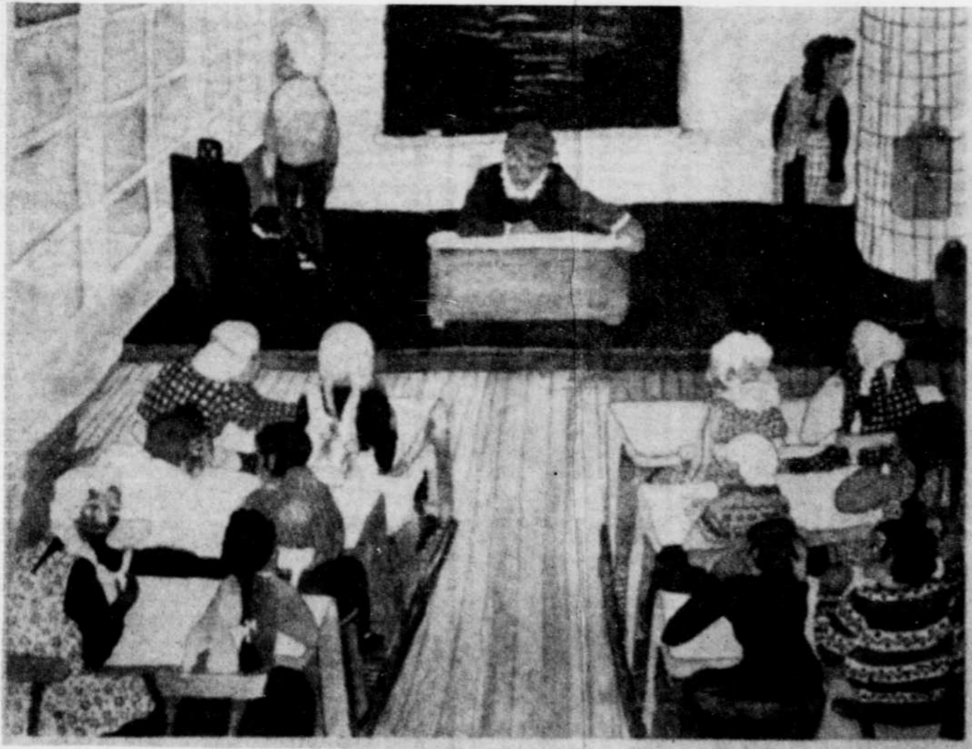
Thelma Aulio-Paanaen, En pénitence , 1978, lithographie, 61 x 12 cm

En comparaison avec les gravures de la première moitié du XXe siècle, tout ce qui a été fait ensuite — et surtout pendant les dernières quinze années — traduit un puissant engagement politique. Vers la fin des années 60 et au début des années 70 il s'agissait d'un engagement contre l'oppression politique dans les différents pays du monde. Les œuvres qui virent le jour pendant ces cinq dernières années traduisent cet engagement et veulent surtout participer à la lutte pour la protection de notre environnement et pour l'économie de nos ressources naturelles.