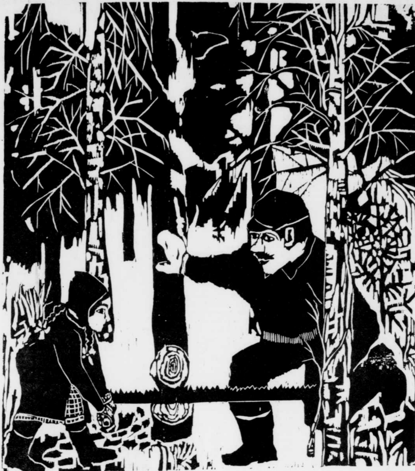
Thelma Aulio-Paanaen, Au temps de la scie à main , 1976, gravure sur bois, 63 x 56 cm

Vers les années 50, la couleur s'installa pour de bon, surtout dans la lithographie. Les thèmes d'inspiration changèrent, en même temps que les artistes s'engageaient plus activement dans tous les nouveaux courants internationaux. Le format des images restait encore petit. Ce n'est qu'au cours des années 60 et 70 que ce dernier s'agrandit.