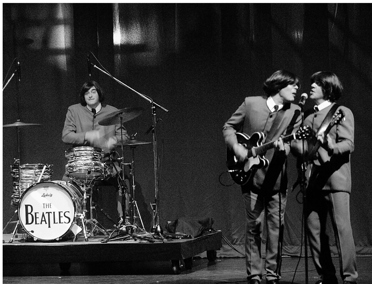
Showtime , de retour pour sa quatrième saison, reprend les grands succès des 40 dernières années, dont ceux des Beatles.