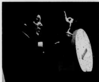
"Concert avec Bruno Maderna" — 2 déc.

Symphonie no 95 de Josef Haydn. Concerto no 3 pour piano et orchestre de Serge Rachmaninov, avec Ashkenazy, comme soliste invité. Cette émission sera probablement diffusée directement de la Grande Salle de la Place des Arts, grâce au car de reportages de Radio-Canada.