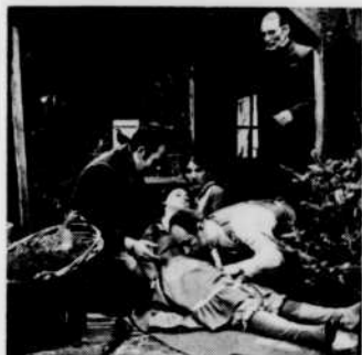
"Le Canard sauvage" — 16 jan.