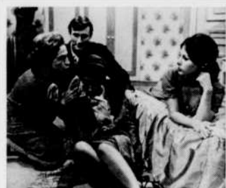
"Trois femmes, un homme" — 7 nov.