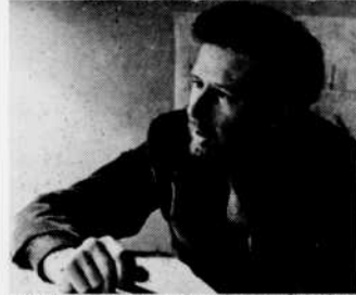
"Opéra canadien de Murray Schafer" — 3 fév.