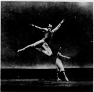
"Concert varié" — 18 nov.