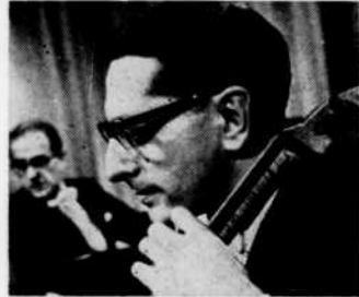
"Concert Mozart-Boccherini" — 10 fév.