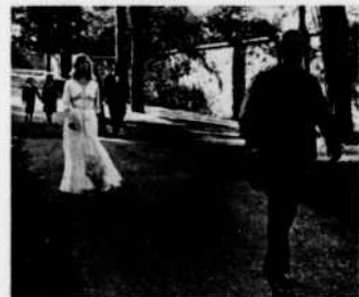
"Un cri qui vient de loin" — 28 nov.