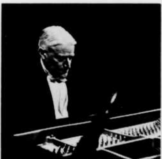
"Concert varié — Musique française" — 4 nov.