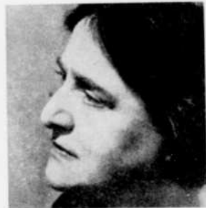
Myra Hess, aux "Maître du piano", jeudi soir à 8 heures.