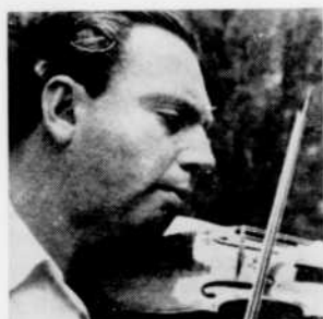
Isaac Stern, aux "Chefs-d'oeuvre de la musique", lundi à 4 heures.

11.00—Université Radiophonique Internationale