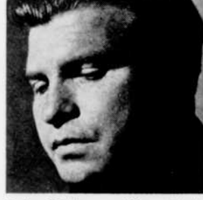
Emile Guilels, au "Concert" de samedi soir à 9 heures.