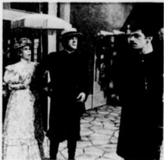
"Il est important d'être aimé" — 30 jan.