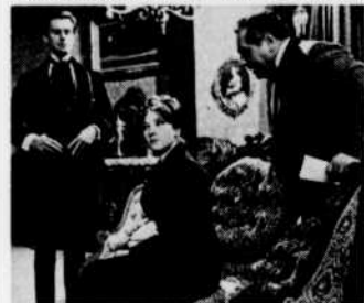
"L'Homme au parapluie" — 9 jan.