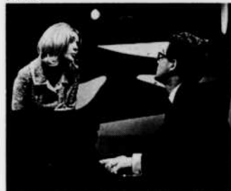
"Concert Michel Legrand" — 6 jan.