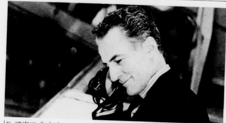
Les amateurs de hockey pourront entendre les descriptions de René Lecavalier, tous les dimanches soir à 7 heures. De plus, le vendredi soir, de 7 h. 02 à 7 h. 15, des commentaires sur notre jeu national vous seront donnés, à la nouvelle série "Le Hockey, avec René Lecavalier".