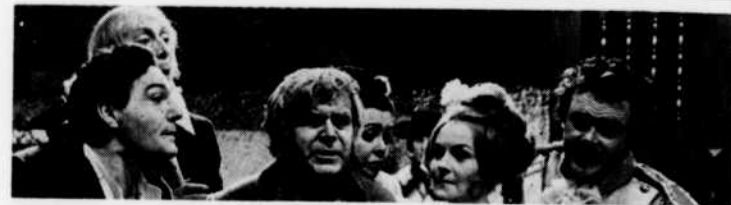
"Le Barbier de Séville", mercredi à 9 h. 30, au réseau anglais.