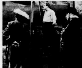
"Le Disciple du diable" — 14 nov.