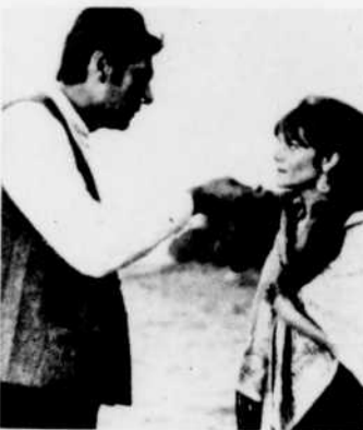
"Codine" est le film à l'affiche de "Cinéma de Paris", mercredi à 8 h. 30.