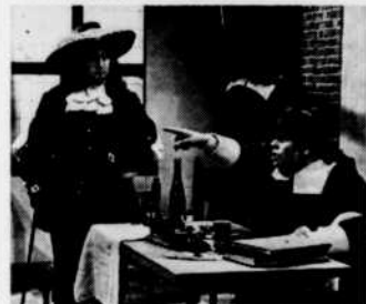
"La Cruche cassée" — 21 nov.