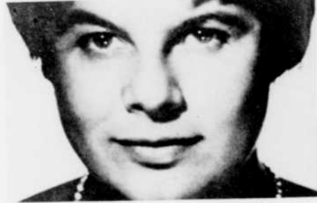
Irmgard Seefried interprétera des "Mélodies et lieder" de Schubert, dimanche soir à 10 heures.