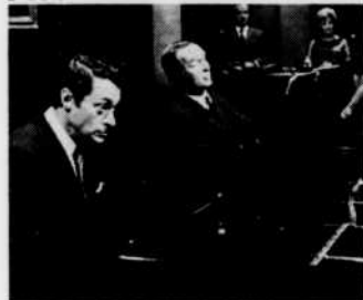
"Concert Schumann-Mendelssohn" — 14 déc.