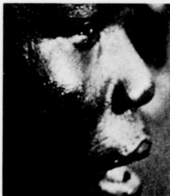
Un film de Jean Rouch, "Moi, un Noir", sera à l'affiche de la série "D'hier à demain", dimanche soir à 11 h. 30.

11.30—D'hier à demain "Moi, un Noir". Les espoirs et les difficultés d'une partie de jeunes Africains. Film de Jean Rouch.