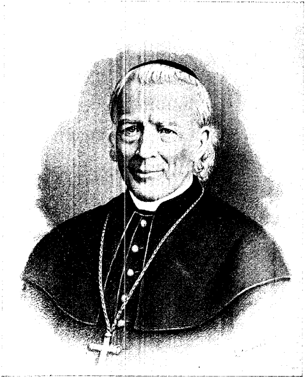
MGR. IGNACE BOURGET