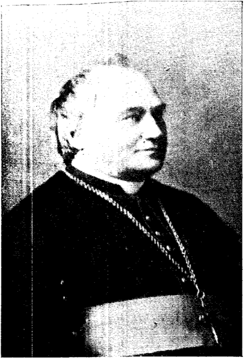
MGR. ALEXANDRE-ANTONIN TACHÉ