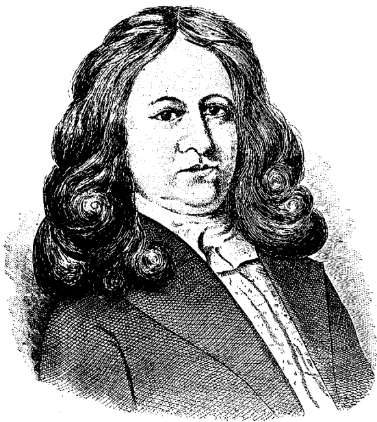
PIERRE BOUCHER SEIGNEUR DE BOUCHERVILLE