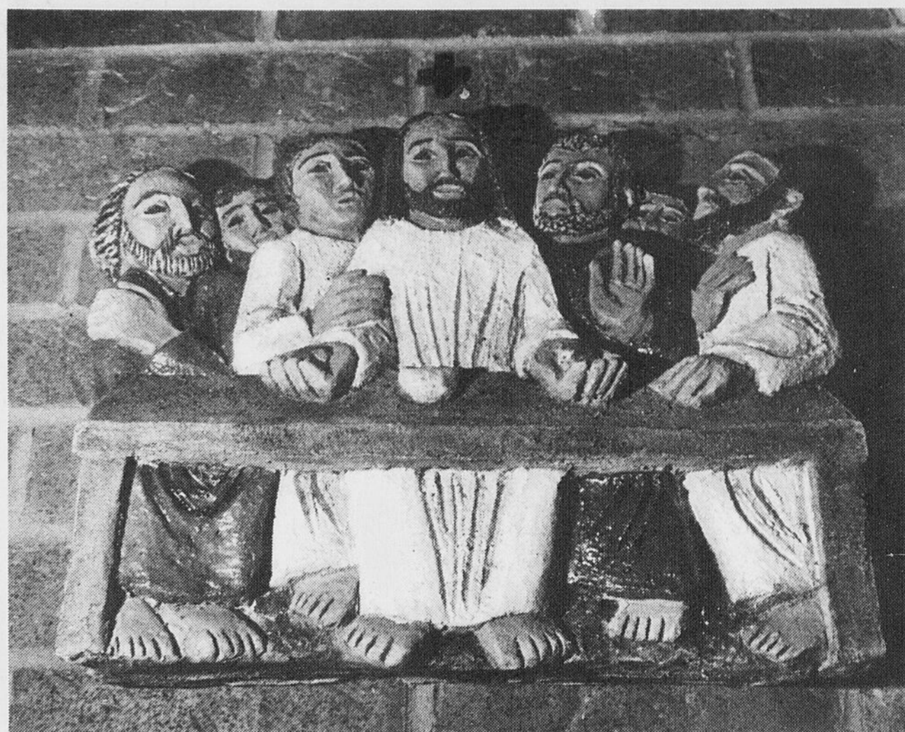
Chemin de la Croix à l'église Saint-Isidore.