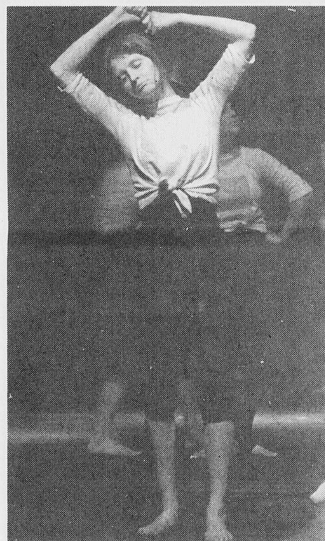
Danser pieds nus.