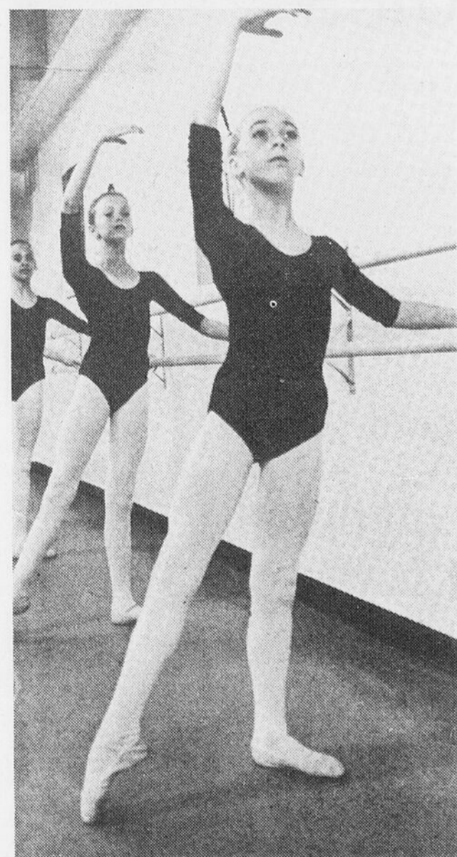
Inscriptions à l'école Pierre-Laporte.