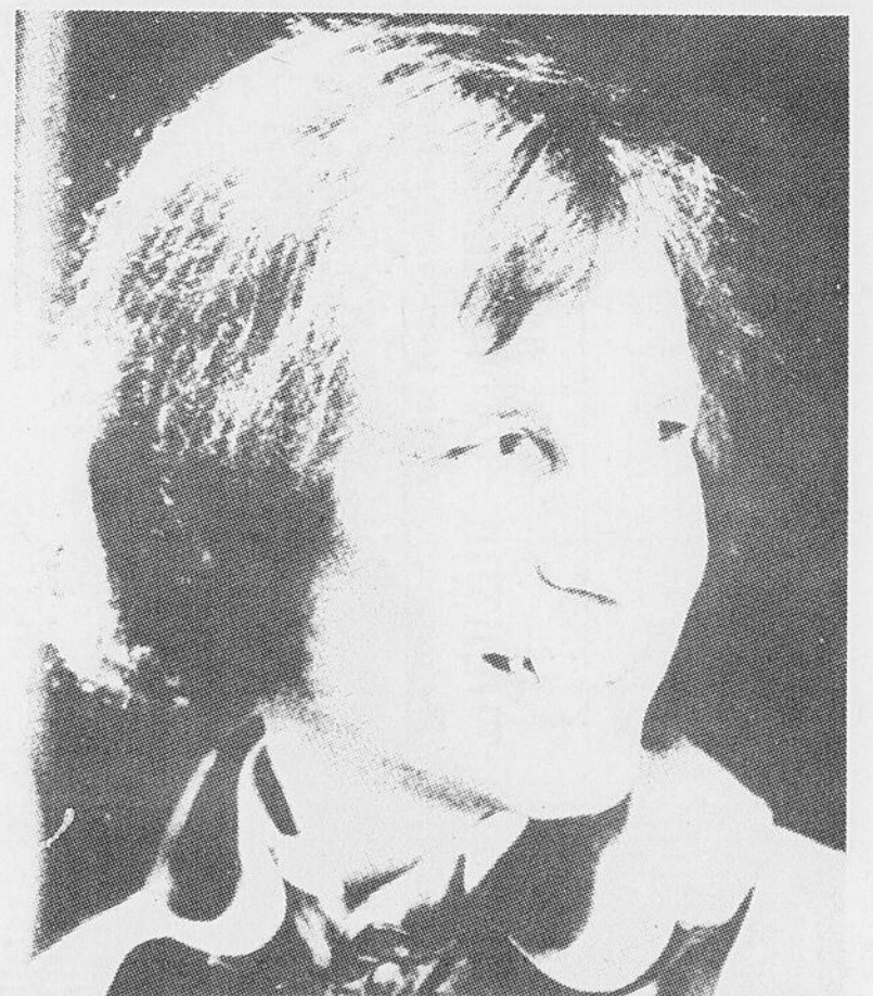
SPECIAL — "Un peu d'émotion, mesdames et messieurs" mettra en vedette Jean-Pierre Ferland.