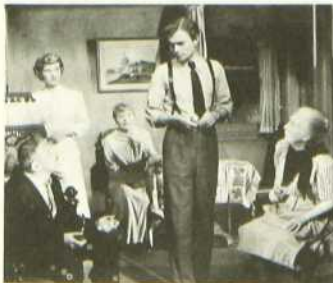
Prise au piège

Bien que Prise au piège date déjà de trente ans (1949) les cinéphiles en noteront l'actualité et l'éternelle jeunesse.