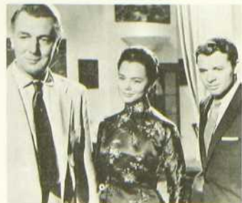
Un Américain bien tranquille

Fowler nie toute responsabilité dans l'assassinat de Pyle même si celui-ci était son rival en amour et qu'en outre il entretenait des relations plutôt louches avec les Rouges. L'inspecteur finit par faire avouer à Fowler que s'il avait voulu il aurait pu empêcher Pyle de se rendre au lieu où il a trouvé la mort; un piège tendu par ses anciens collaborateurs qui, ne le trouvant plus utile, voulaient se débarrasser de lui.