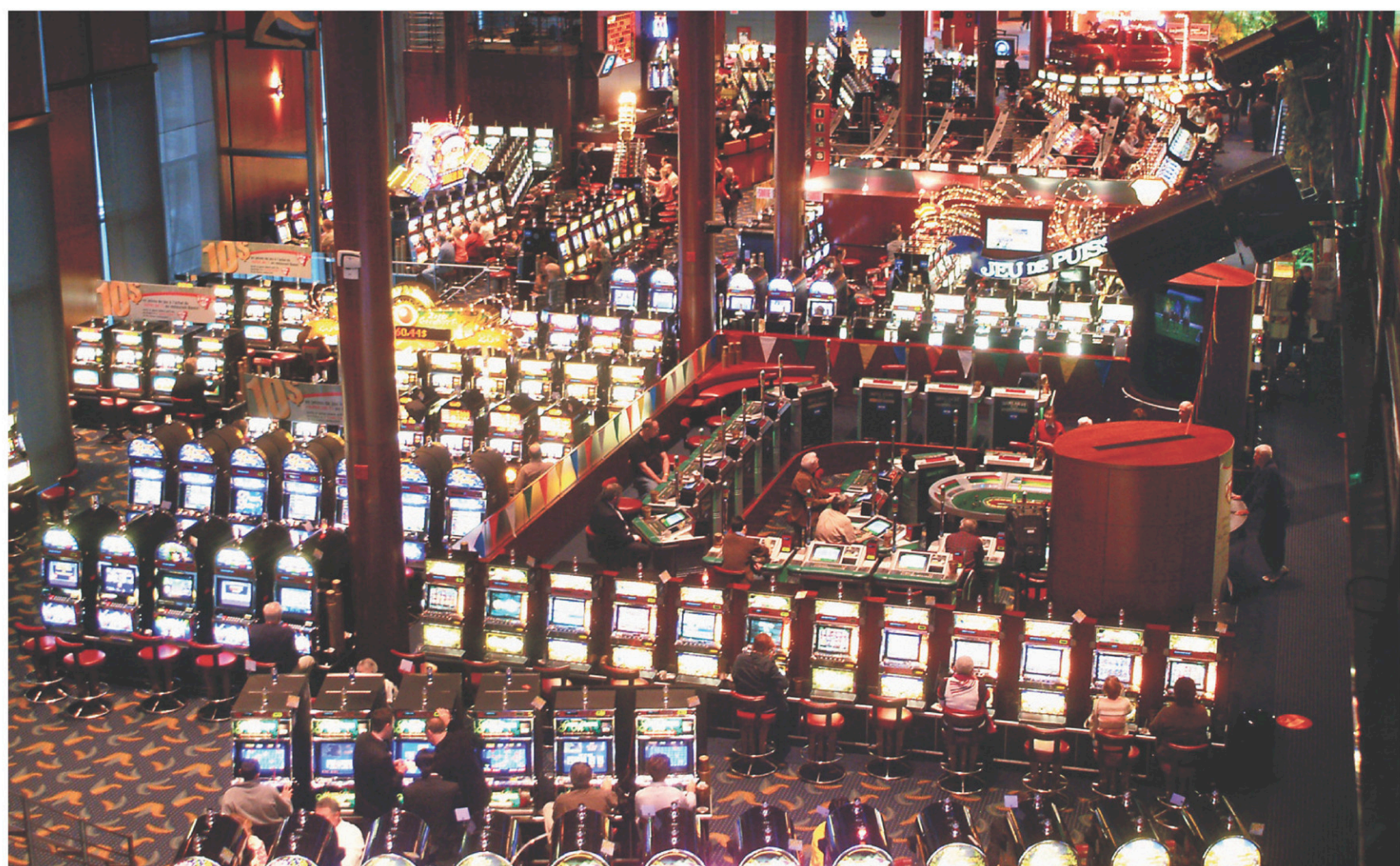
OLIVIER ZUIDA LE DEVOIR

Loto-Québec estime que le marché du jeu a atteint sa maturité.