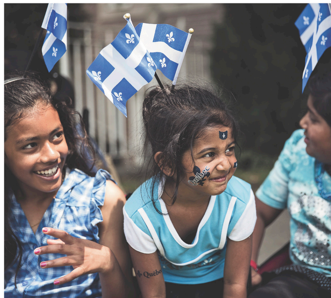
Si'il est très vrai que la société d'accueil se doit de s'ouvrir toujours plus et mieux, elle n'a pas à « cacher ses statues », expression d'actualité, métaphore de ses valeurs, de ses us et coutumes.

Il est malheureux que d'autres personnes venues d'ailleurs ne veuillent pas adopter le Québec dans ce qu'il est : une nation francophone, en marche vers l'officialisation de sa laïcité, attentive à l'égalité entre les femmes et les hommes, déjà multiculturelle mais pas « multiculturaliste ».