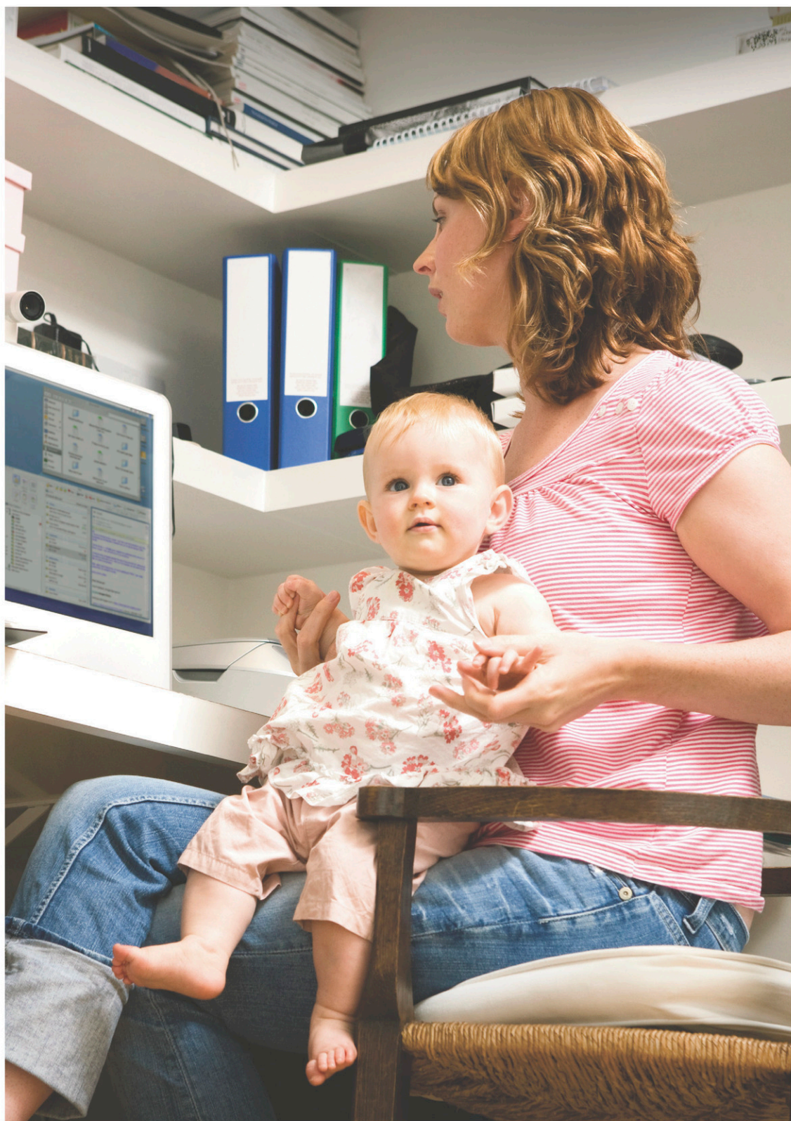
Les politiques du travail ne protègent plus adéquatement les travailleurs, plus particulièrement les travailleurs autonomes et les salariés atypiques, qui forment environ 37 % de la main-d'œuvre québécoise.

«En somme, nous avons besoin de recentrer le discours sur la notion de meilleur travail comme véhicule de développement économique et d'inclusion sociale à l'échelle planétaire», conclut Gregor Murray.