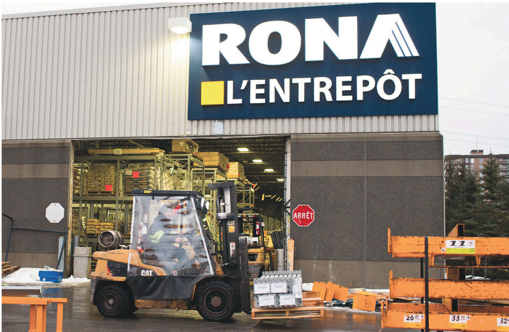
ANNIL MH DE KARUFEL LE DEVOIR

CAHIER B • LE DEVOIR, LES SAMEDI 6 ET DIMANCHE 7 FÉVRIER 2016