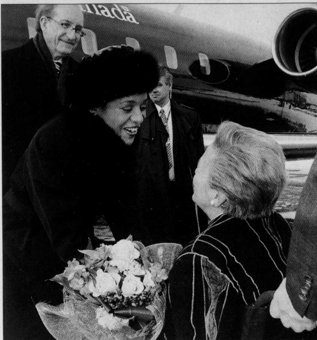
La lieutenant-gouverneure du Québec, Lise Thibault, accueillant la gouverneure générale du Canada, Michaëlle Jean, et son conjoint, Jean-Daniel Lafond, lors d'une visite officielle à Québec.

Cela sera d'autant plus nécessaire si le Québec instaure une mesure de représentation proportionnelle. Plus on accroît la représentation proportionnelle, plus on augmente la possibilité d'un Parlement où aucun parti ne détiendrait la majorité. Dans ces conditions, seul un chef d'État disposant d'une légitimité politique et d'une autorité morale confirmées peut piloter prudemment le processus de mise en place d'un nouveau gouvernement, en accordant priorité à l'intérêt public davantage qu'aux ambitions des partis, ou conclure à la nécessité d'en appeler à l'électorat.