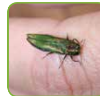
Un exemple des ravages causés par l'agrile du frêne.

8,5 à 14 mm (longueur) 3,1 à 3,4 mm (largeur)