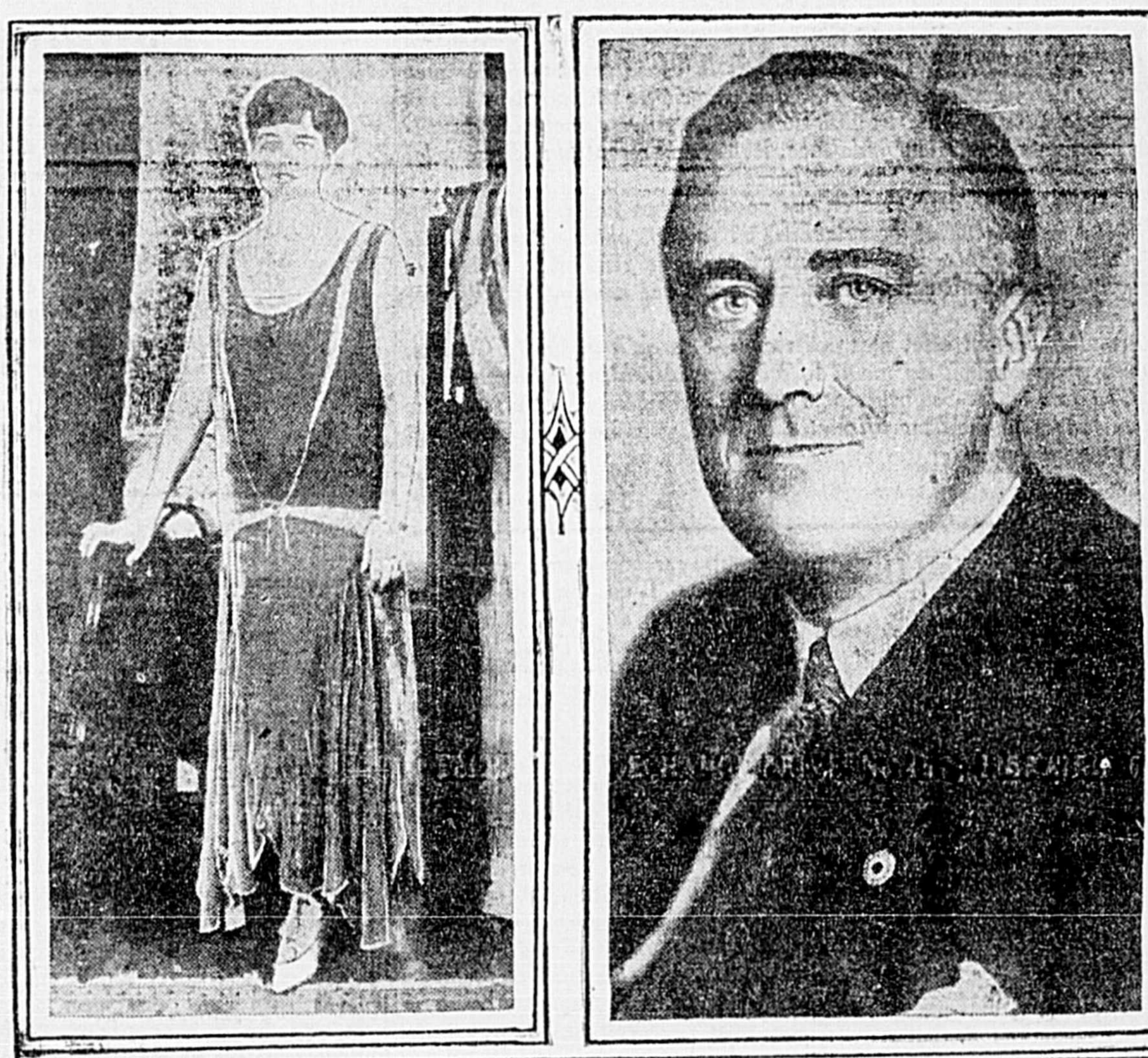
Le nouveau gouverneur de l'état de New-York, Franklin-Delano Roosevelt vient de démontrer qu'il est un réformateur et un homme d'affaires. Il n'a pas peur des idées nouvelles. Il prétend établir une commission pour étudier les réformes nécessaires dans le domaine de la justice. Il prétend même nommer un ou deux condamnés pour faire partie de la Commission. M. Roosevelt a eu une longue carrière au service du public. Il fut sept années durant assistant secrétaire au département de la marine des Etats-Unis. On voit ici le gouverneur Roosevelt et son épouse.