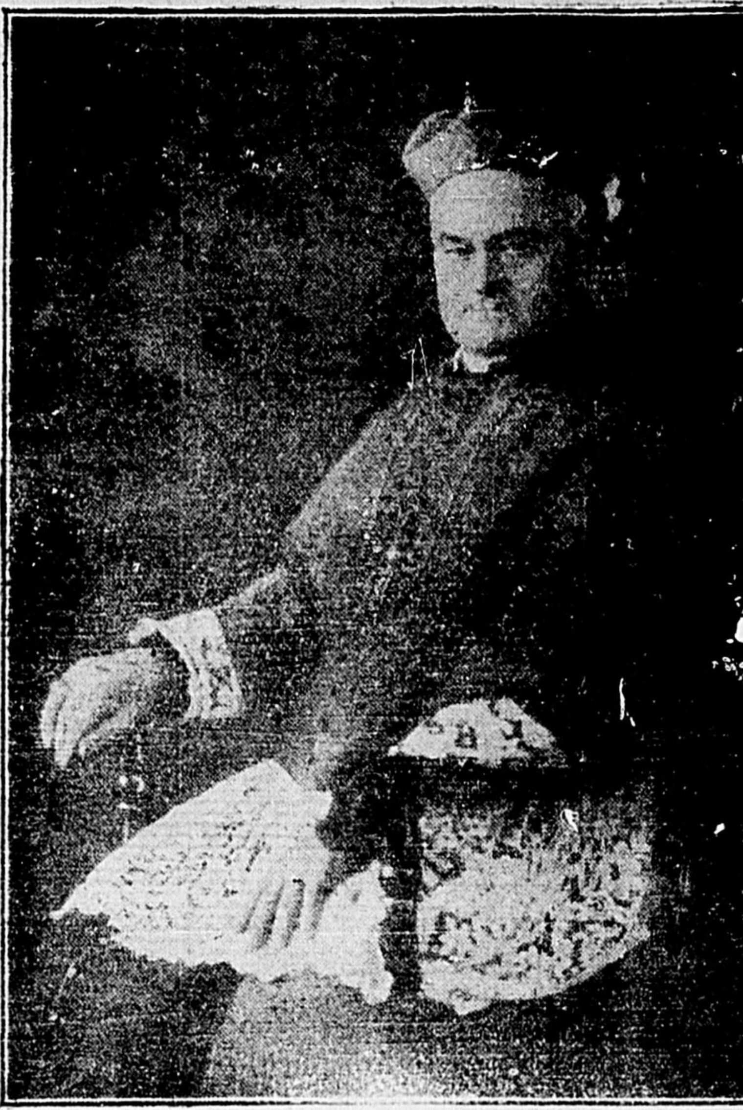
Dans l'intérêt de la région