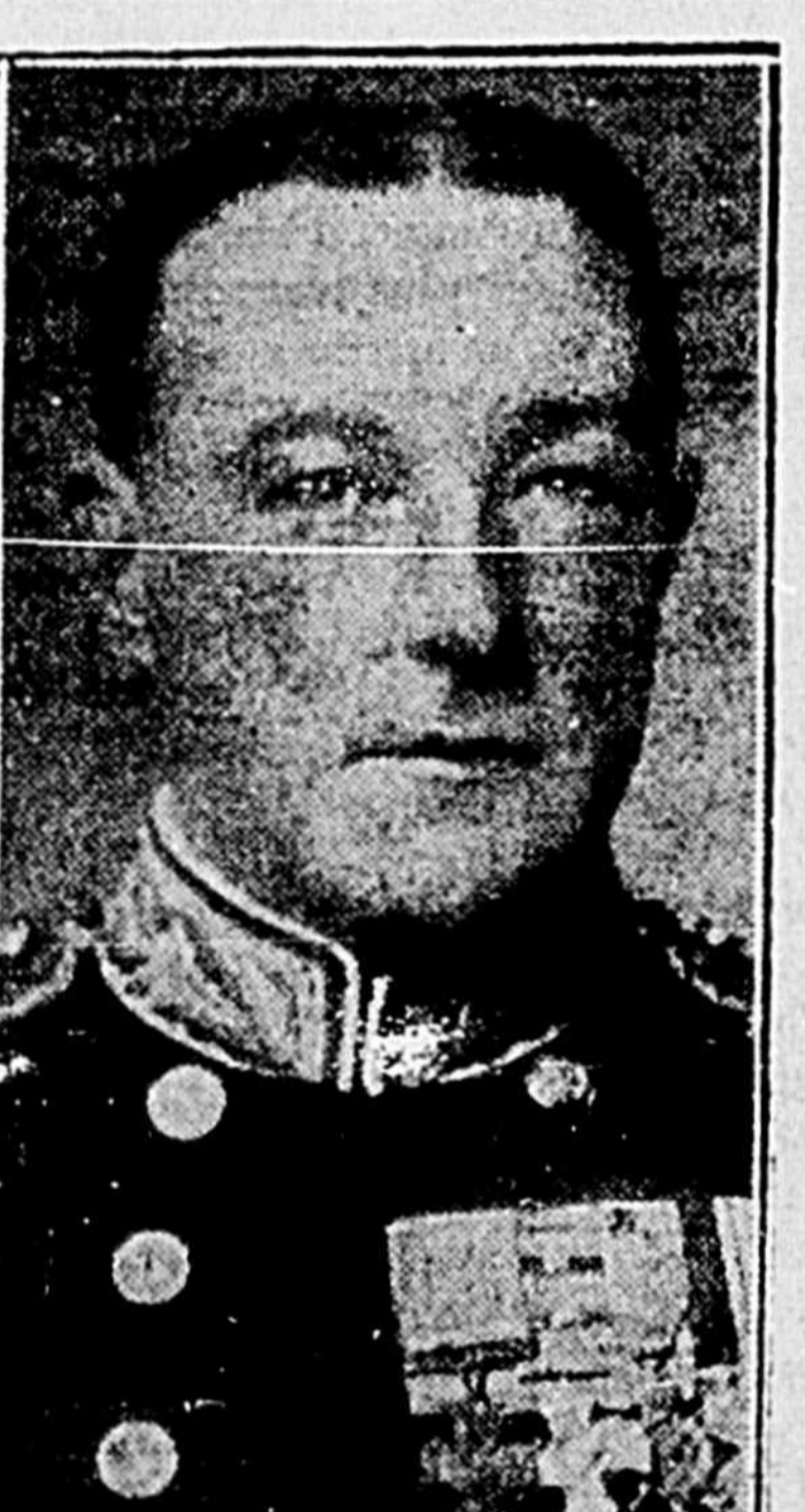
L'amiral Gordon Campbell, l'un des plus jeunes amiraux de la flotte anglaise, actuellement en visite au Canada.