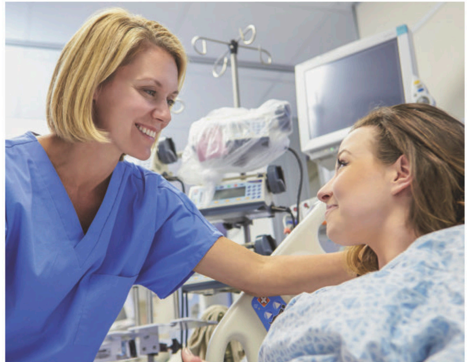
Les infirmières qui œuvrent au bloc opératoire de l'Hôpital de Saint-Eustache sont à bout de souffle.

Le CISSS des Laurentides procède en effet à la formation de nouvelles infirmières à l'heure actuelle. Celles-ci, nous dit-on, pourront se joindre à l'équipe du bloc