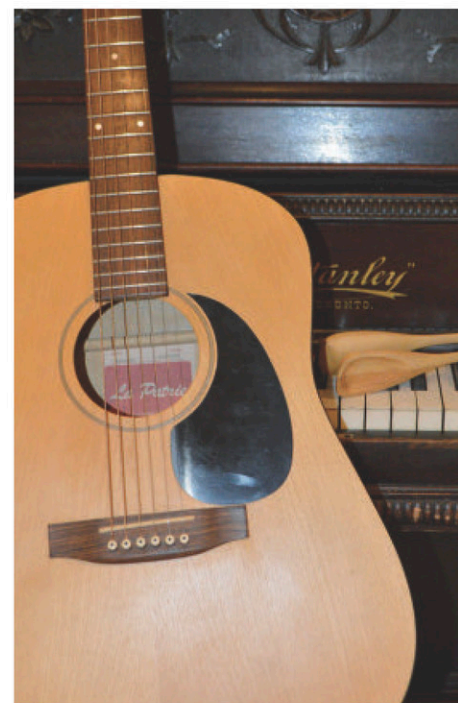
Déjà, dans l'Antiquité, le célèbre philosophe Pythagore reconnaissait en la musique «un remède à prescrire pour les troubles liés à l'émotivité».