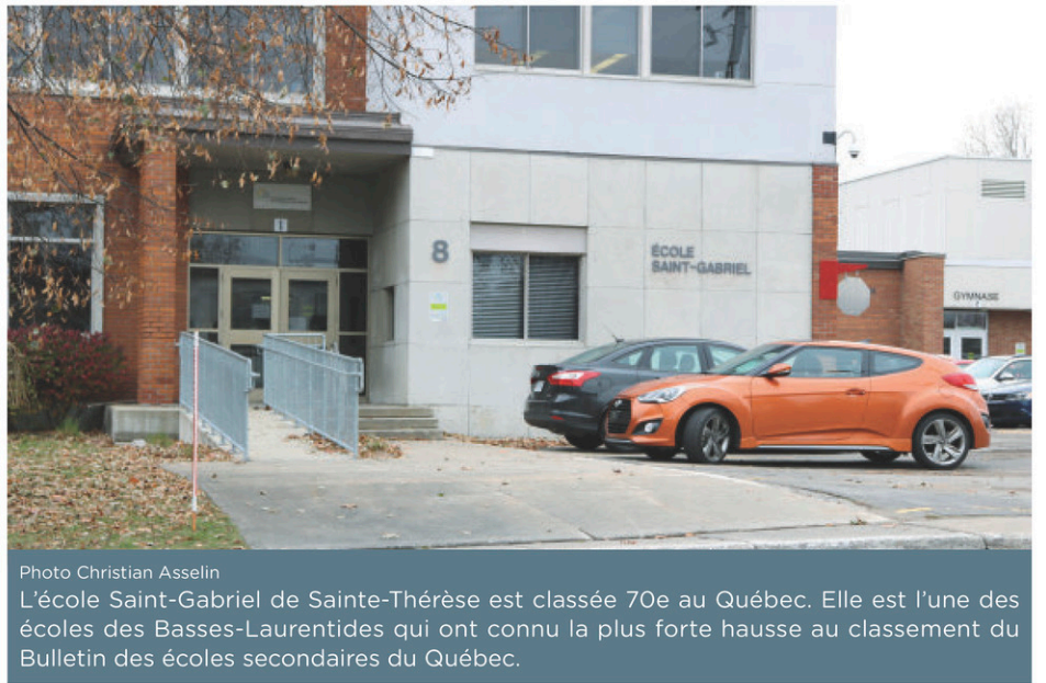
L'école Saint-Gabriel de Sainte-Thérèse est classée 70e au Québec. Elle est l'une des écoles des Basses-Laurentides qui ont connu la plus forte hausse au classement du Bulletin des écoles secondaires du Québec.