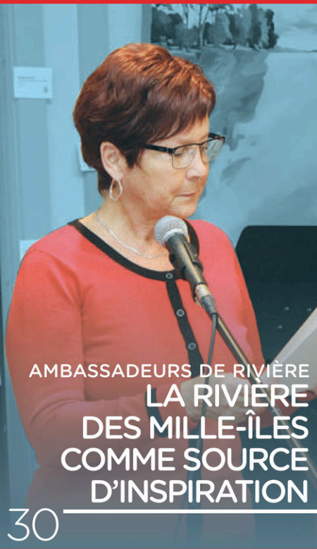
AMBASSADEURS DE RIVIÈRE LA RIVIÈRE DES MILLE-ÎLES COMME SOURCE D'INSPIRATION