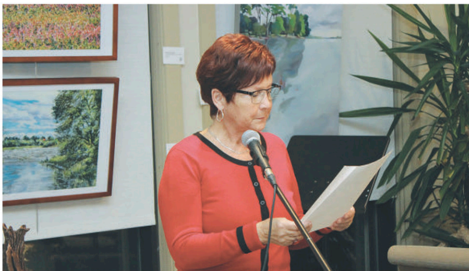
Plusieurs artistes ont lu leurs œuvres pendant la soirée, dans le cadre d'un large concours littéraire.