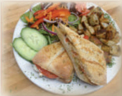
Table d'hôte en semaine