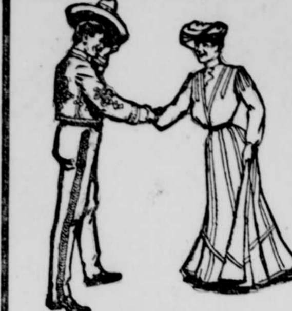
Les Huitres arrivent à Montréal à pleines goeulettes.

LES HUITRES ARRIVENT A MONTRÉAL A PLEINES GOEULETTES — ETYMOLOGIE, PHILOSOPHIE, BIENFAITS ET CULTURE DE L'HUITRE — APTHEOSE DE LA MALPECQUE.