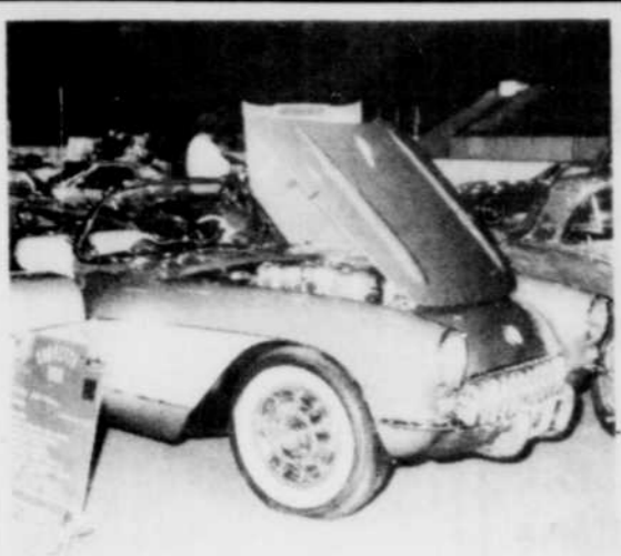
La Super Expo Corvette se poursuit toute la journée aujourd'hui au Palais des Sports de Sherbrooke.

Derrière ces trois grands favoris, la Ferrari turbo de Didier Pironi, 3e temps (1:23:47), sera également candidate à la victoire. La fir-