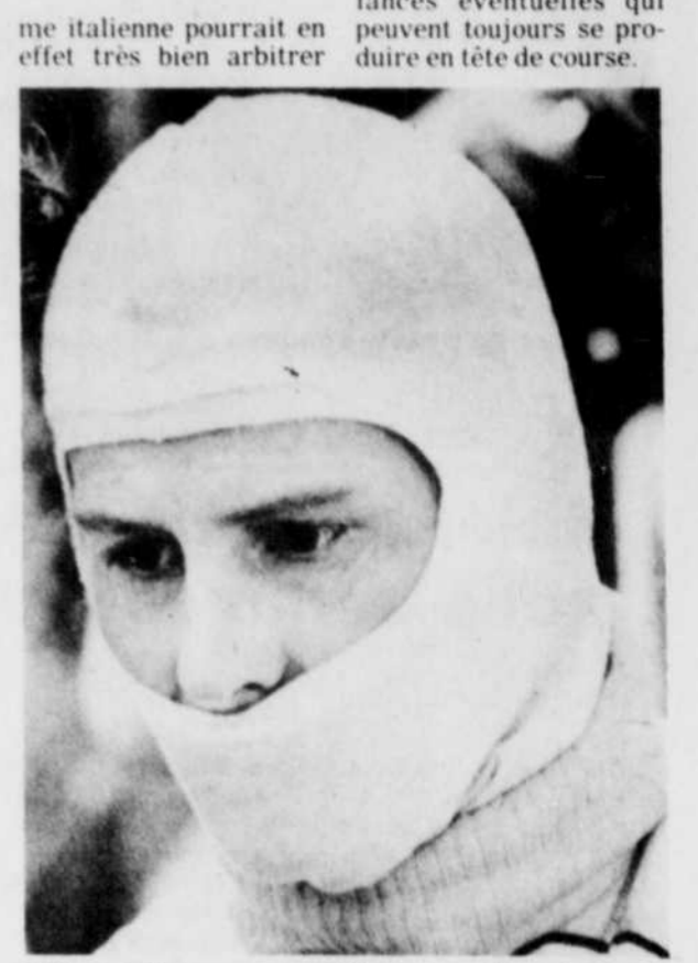
Gilles Villeneuve a été incapable de faire mieux qu'une 7e position jusqu'à maintenant dans les qualifications.

Quoi qu'il en soit, les deux Williams, qui sont dotés, comme les Brabham, d'une suspension hydro-pneumatique, seront parmi les grands favoris de l'épreuve.