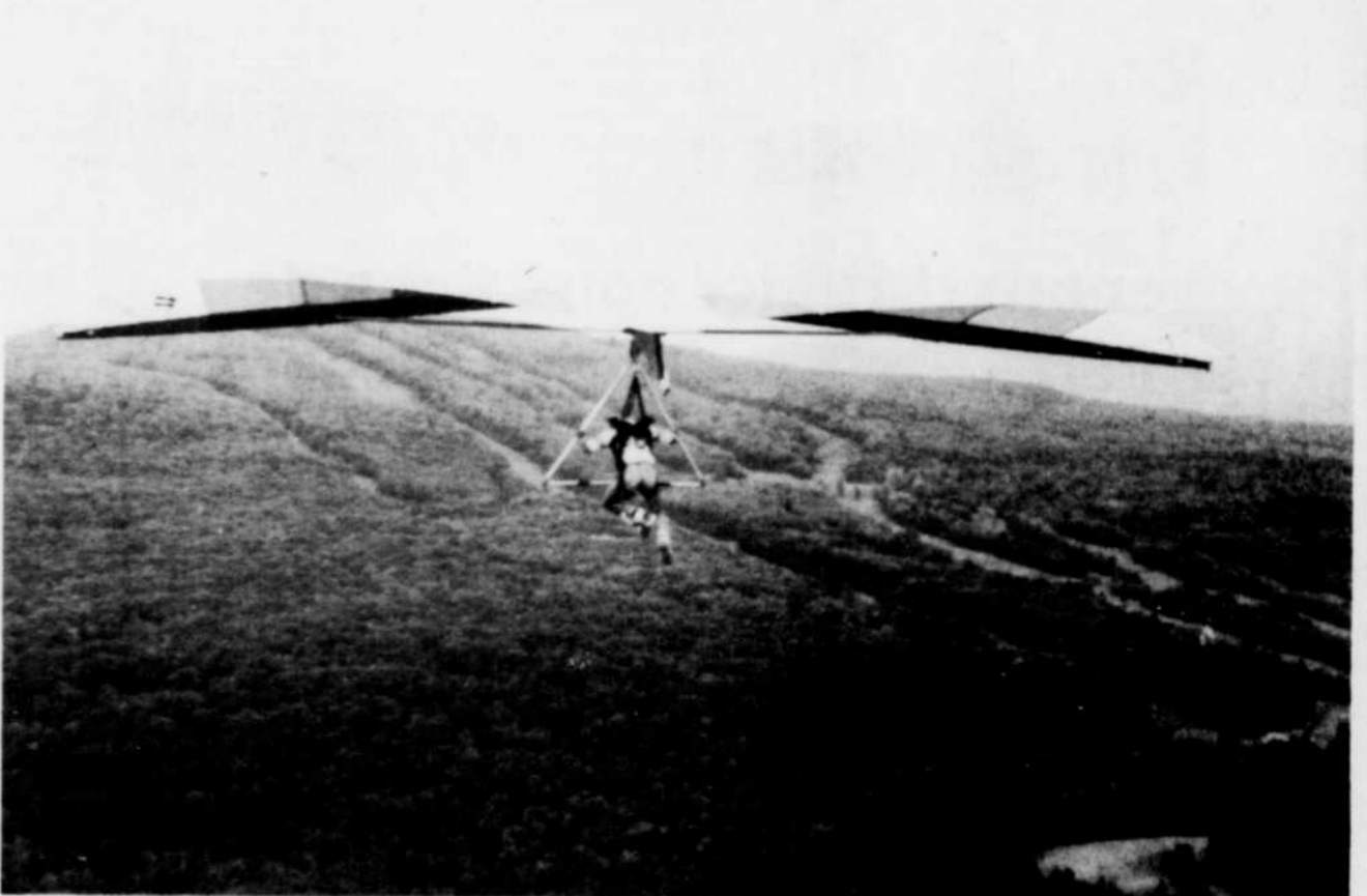
...voilà qui est fait. Il vole librement, comme un oiseau.