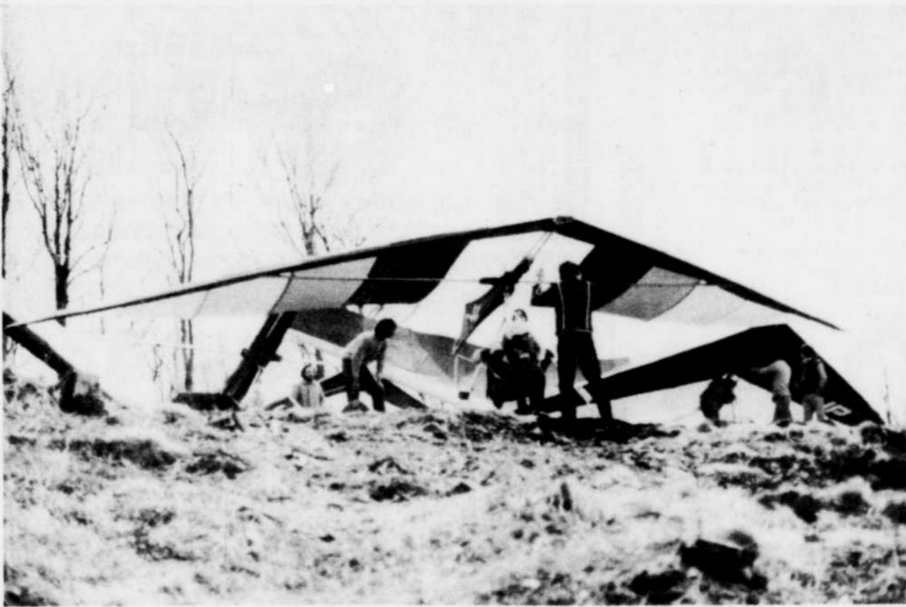
Quelques compagnons aident ce pilote à prendre le départ...