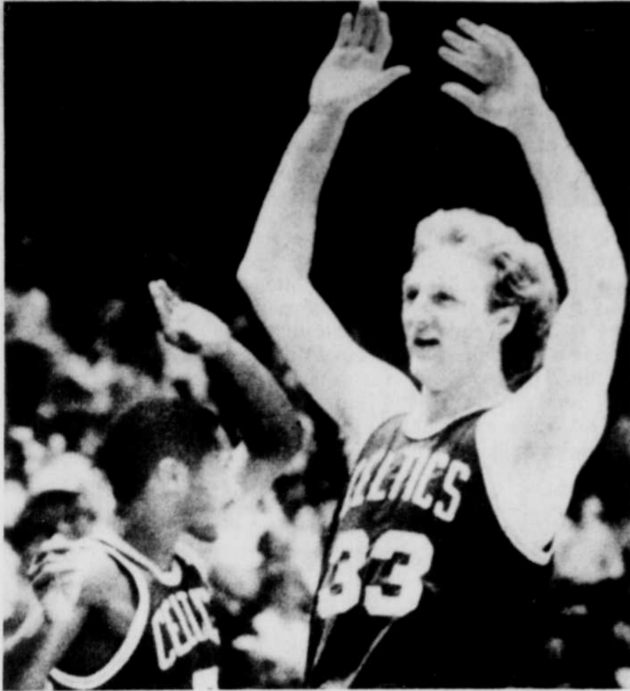
Larry Bird a été l'homme-clé des Celtics depuis deux ans.