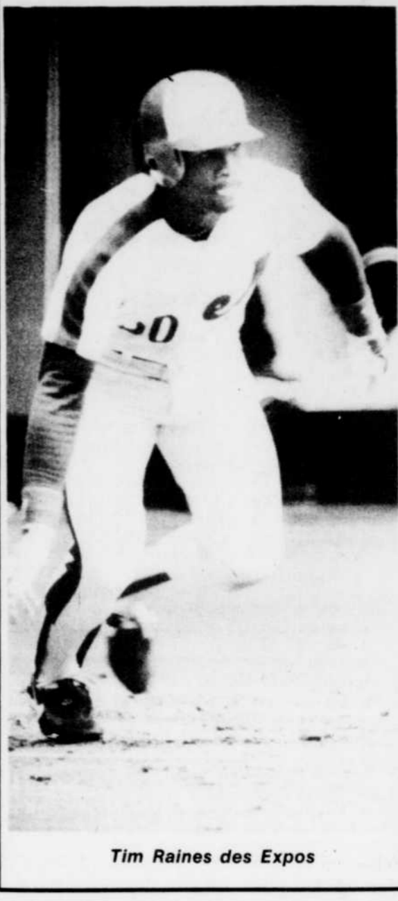
Tim Raines des Expos

Faites parvenir vos suggestions à: La Tribune, section des Sports, 1950 rue Roy, Sherbrooke, Québec, J1K 2X8