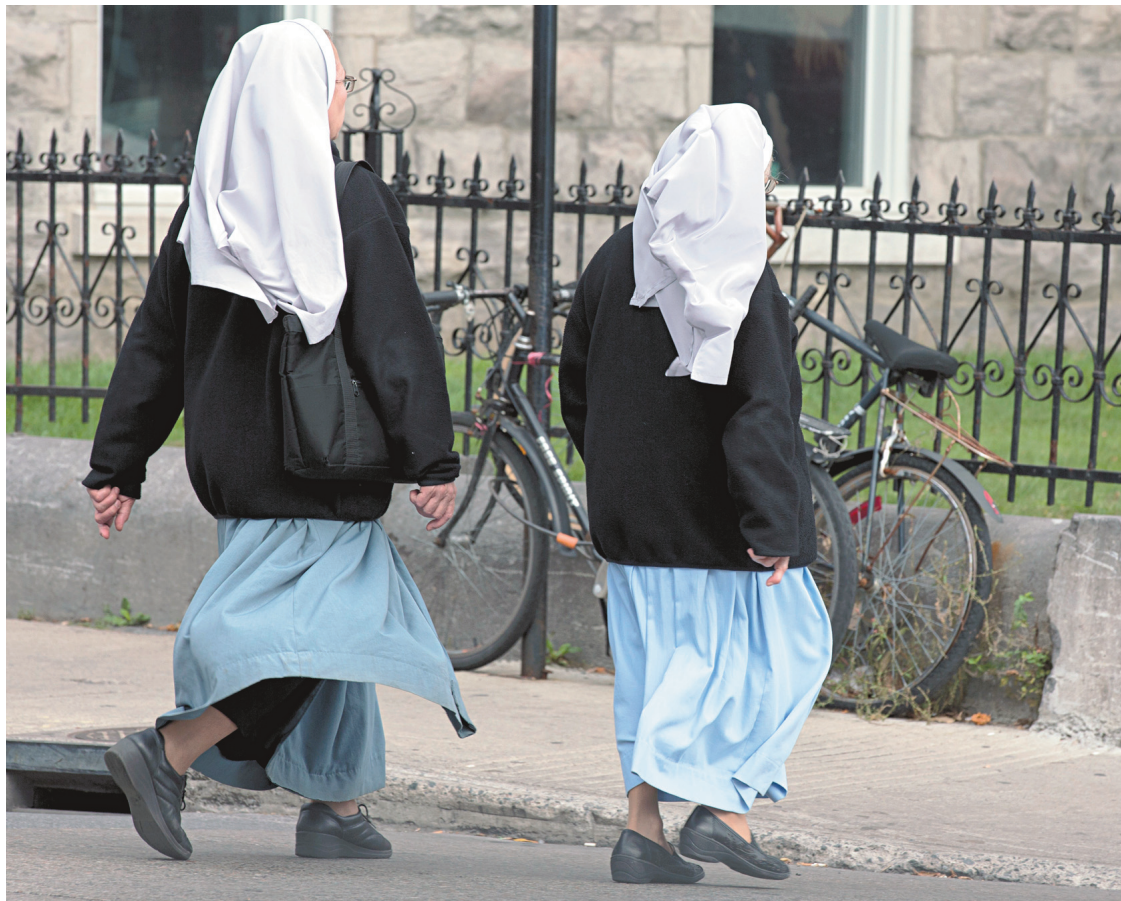
Le projet québécois n'interdit aucun signe religieux dans l'espace public en général.

Que celles-ci puissent être laïques, au sens lockéen du terme, en laissant leurs agents « libres » d'afficher leur appartenance religieuse, est un argument valable mais, d'une perspective réellement progressiste, réducteur et conservateur. Il insiste sur l'impératif de neutralité alors que l'État et ses représentants pourraient, symboliquement, incarner aussi cette sécularisation dont l'essor historique est menacé par l'une des véritables tendances réactionnaires de notre époque: la réaffirmation du théisme qui, tant sous ses formes dites modérées que de plus en plus radicales, est contraire à la véritable liberté de conscience et d'expression de tous, celle qui ne se réduit pas à et qu'on confond trop souvent avec la liberté négative de s'imposer à soi-même, sur le plan individuel ou communautaire, un code de vie fondé sur un ensemble de superstitions.