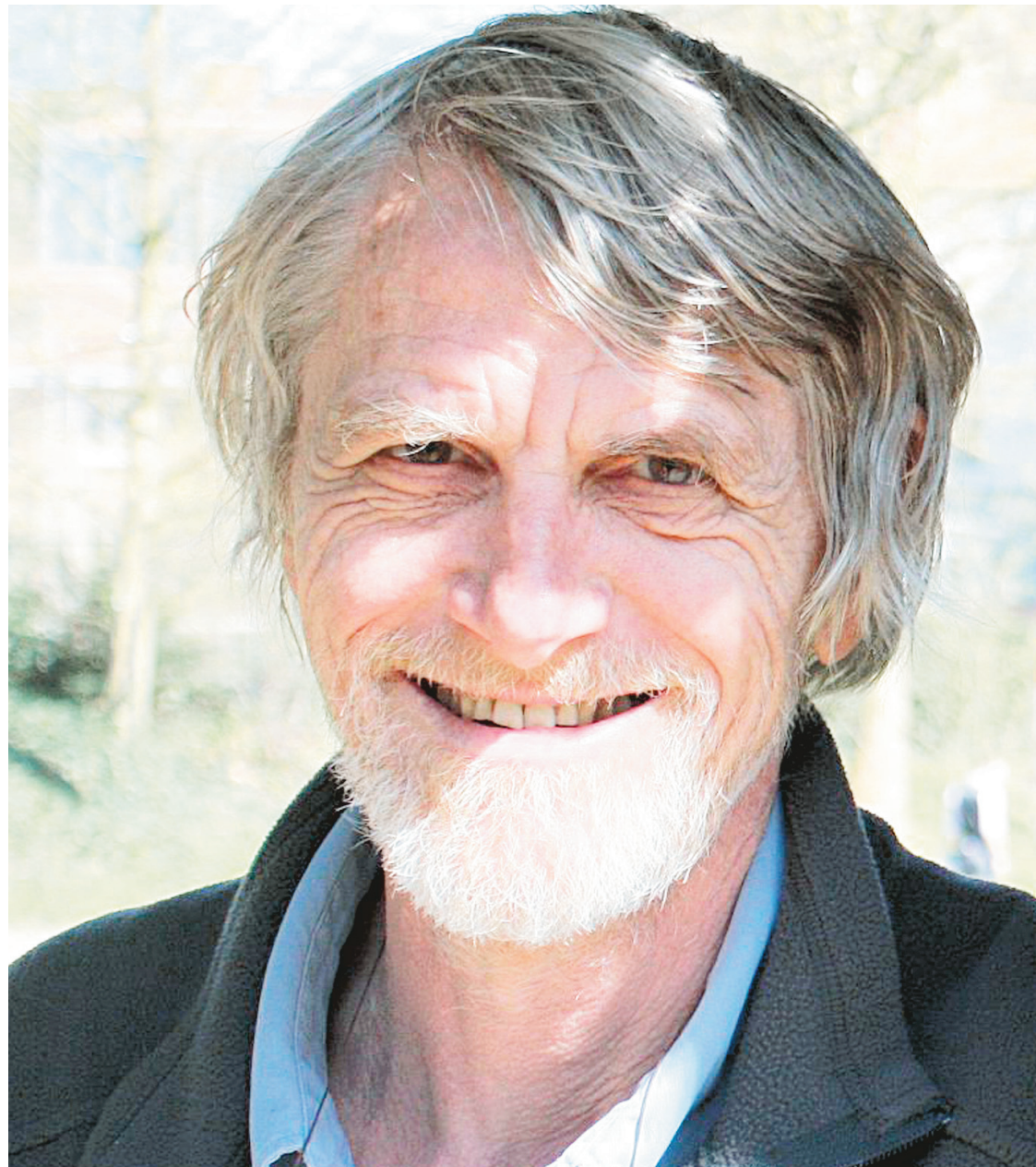
UNIVERSITÉ CATHOLIQUE DE LOUVAIN