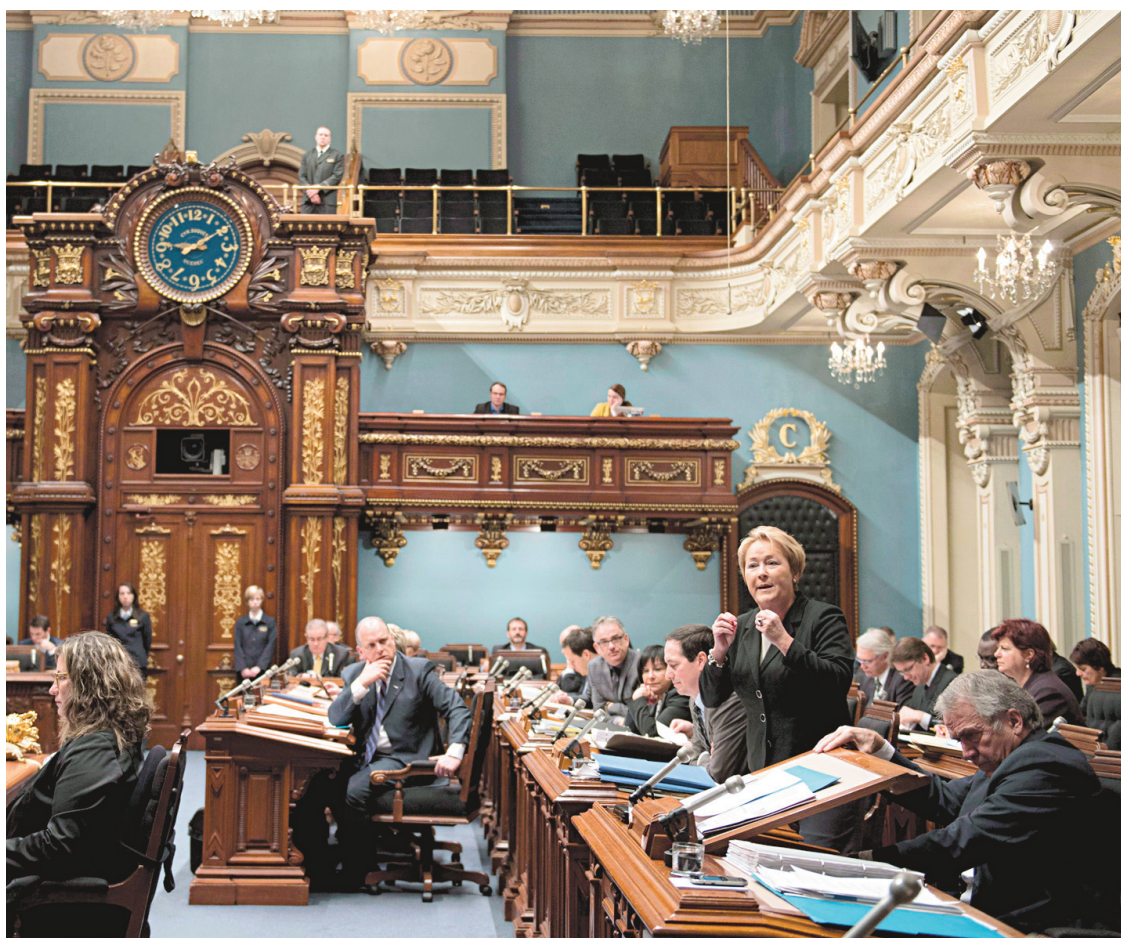
La dernière session a permis au gouvernement Marois de trouver un second souffle.