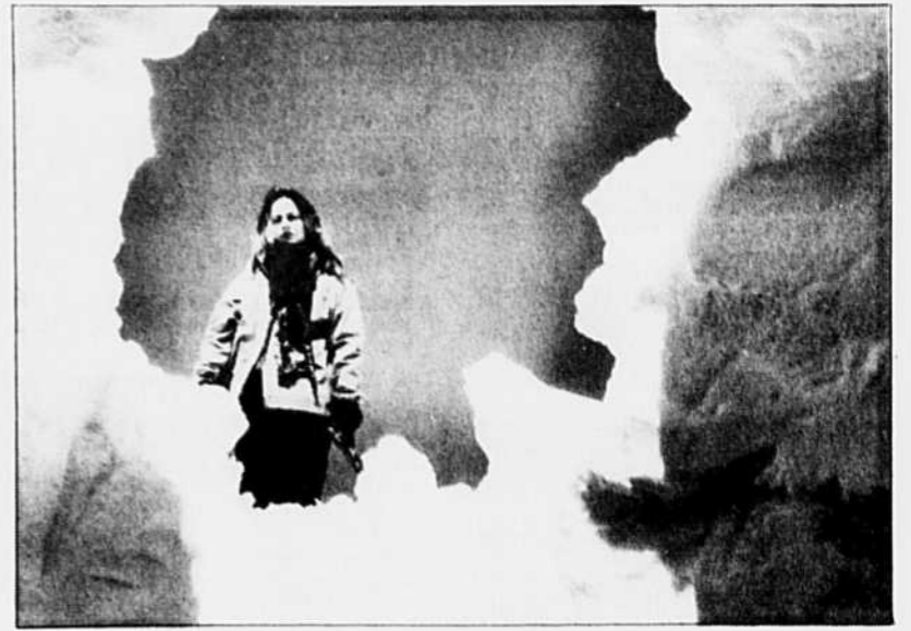
Sandrine Bonnaire dans Jaune revolver d'Olivier Langlois.