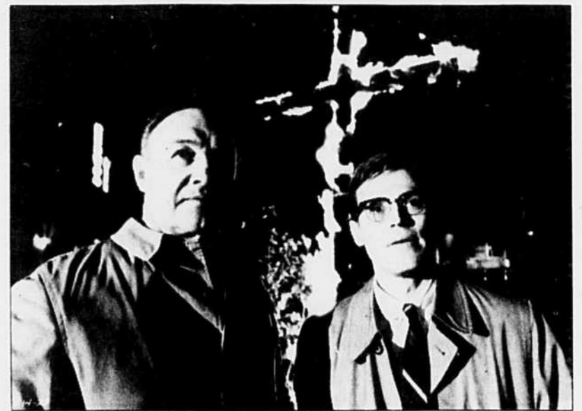
Une croix brûle dans la nuit. Une des scènes de Mississippi Burning , avec Gene Hackman et Willem Dafoe.

De ce film aux accents nostalgiques qui appartient au réalisateur de A Trip to Bountiful , on ne retient hélas pas grand chose si ce n'est une vaine démonstration de la fragilité