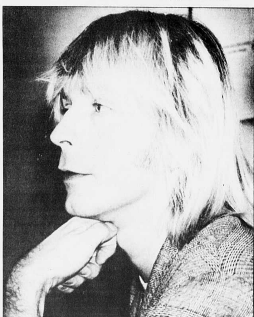
... et sans.