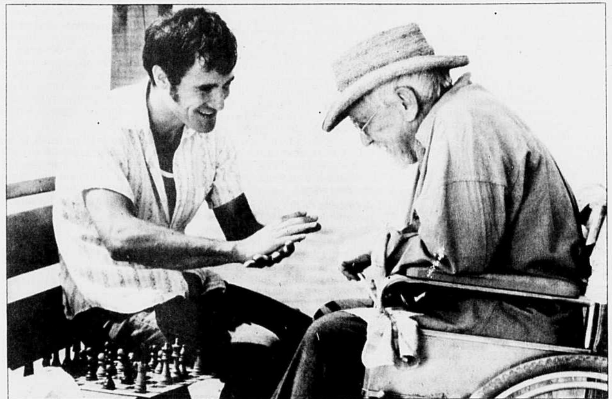
Burgess Meredith, à droite, dans le rôle du Général, qui tue le temps avec son copain Jimmy (Elias Koteas), dans Full Moon in Blue Water .

des sentiments et un joli décor balnéaire et romantique comme il n'en existe que sur la côte pacifique américaine avec ses cottages, ses bars-restaurants sur pilotis et sa corniche verdoyante. Car, pas grand chose se passe dans le commerce de Floyd où ne se profile jamais l'ombre d'un seul client. Pas grand chose si ce n'est quelques engueulades entre