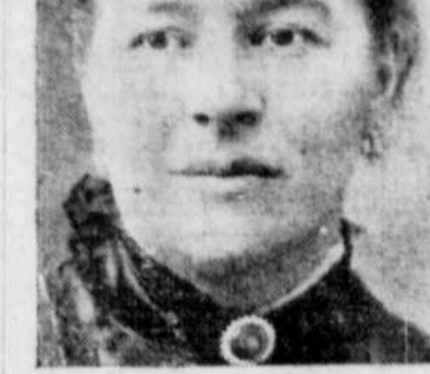
L'épouse de l'ancien gouverneur général, qui arrivera bientôt au Canada.