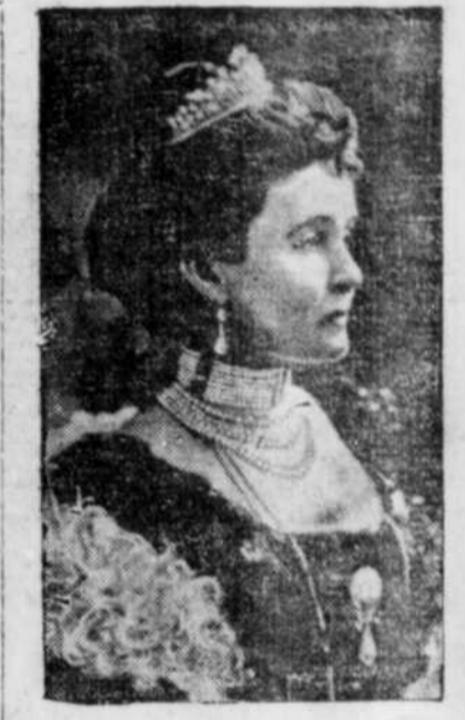
Une dépêche nous apprend que Son Altesse Royale est encore souffrante.