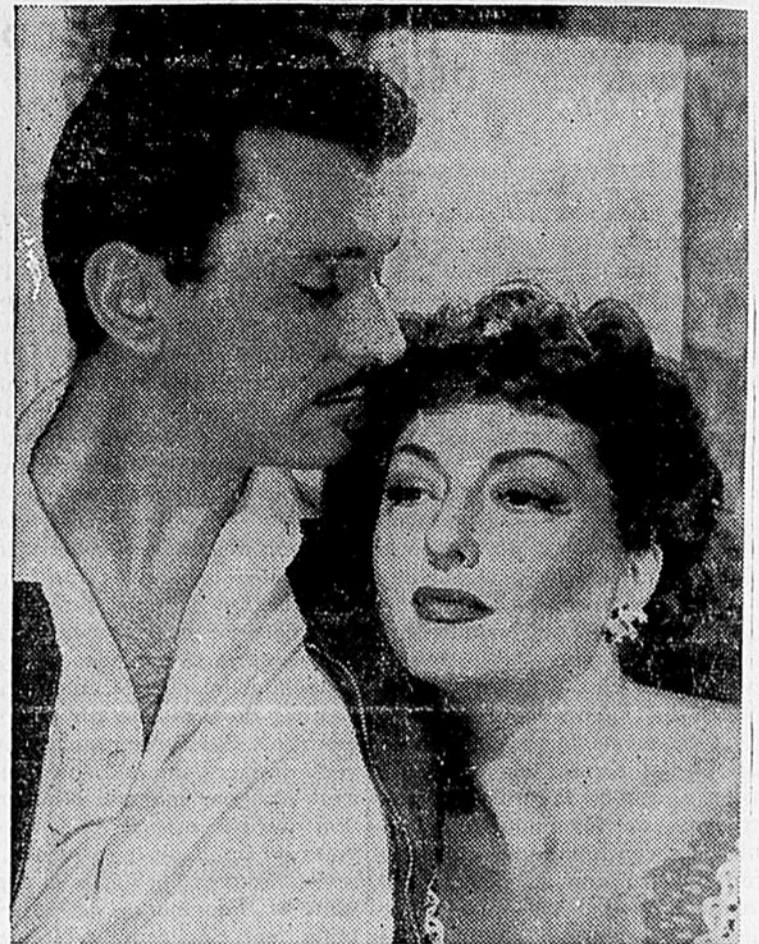
Frank Villard et Viviane Romance, en vedette dans l'un des sketches de la grande production "Les Sept Péchés Capitaux" qui prendra l'affiche dès samedi, au Cinéma de Paris.