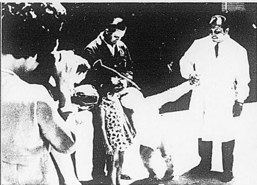
«Jardins zoologiques», tel est le titre du reportage présenté à «Des grands reportages» mardi, à 21 h 30, au canal 10.

6 h 45 5 Around the City with Bob 9 Le 9 vous informe