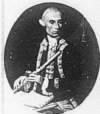
Musique ancienne... avec flûte si possible.

Ces émissions, toutes semblables, sont chapeautées de titres farfelus et parfaitement interchangeables. Que cela s'appelle Au gré de la fantaisie , Avec ou sans soleil , Les Notes inégales , Contrepoint , De la musique avant toute chose , Sur la pointe des pieds ou Les Petits Ensembles , sous un titre ou sous un autre, le résultat reste le même, comme si quelqu'un pressait au hasard les boutons d'une machine à disques, sans regarder et, surtout, sans se soucier le moins du monde de ce qui en sortira. Titres qui ne veulent absolument rien dire en effet: ainsi, l'autre matin, à Sur la pointe des pieds , on a fait jouer de toni-