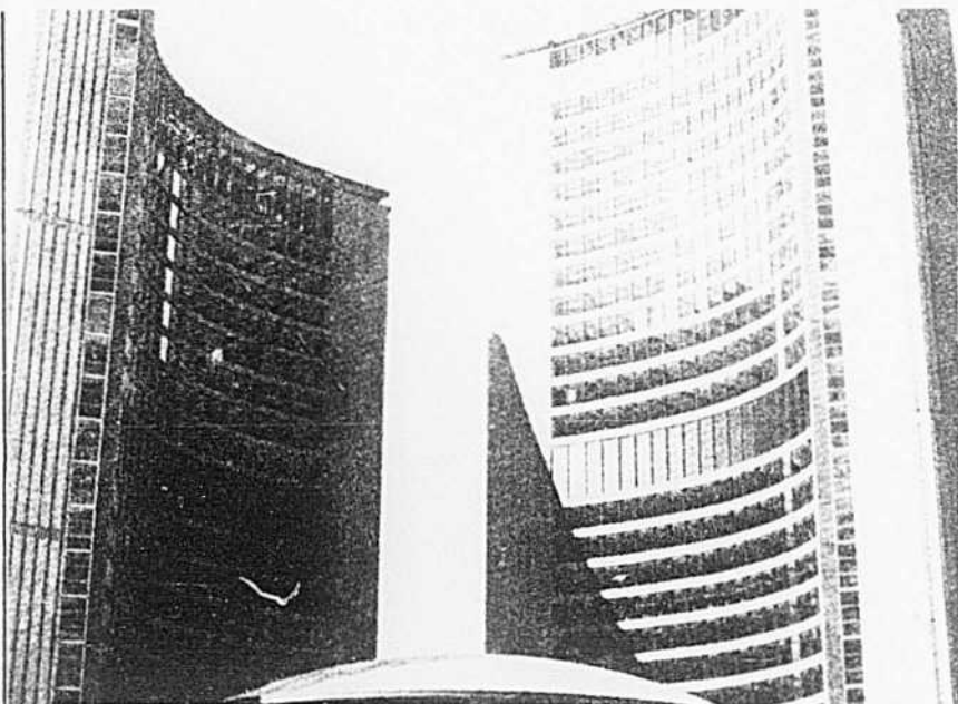
Célébration du fait français à Toronto — Plusieurs Canadiens ont décidé cette année de célébrer le fait français. Un groupe de Franco-Ontariens de Toronto a organisé une semaine française dans cette ville, anglophone par excellence. Cet événement se termina le 24 juin par un spectacle en plein air sur la place Nathan Phillips, devant l'hôtel de ville. Michel Gélinas a réalisé une émission qui sera diffusée le 16 juillet à 19h 30 aux Beaux Dimanches, et qui nous présentera des extraits de ce spectacle.