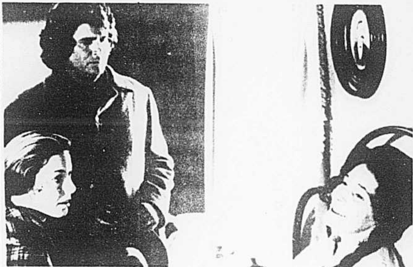
Une scène de «La petite maison dans la prairie» présentée mercredi à 19 h 30, au canal 10.