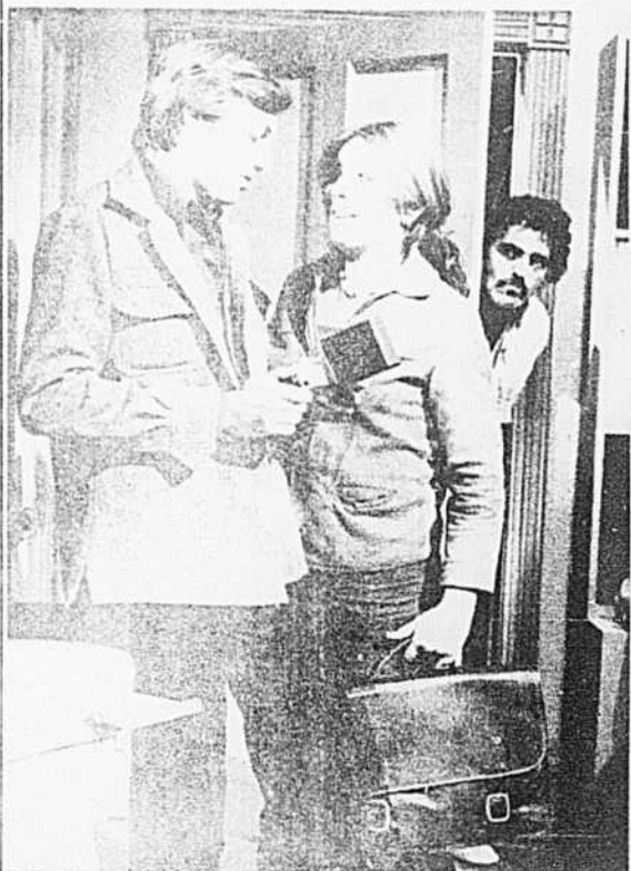
Scène de «Dominique» présenté tous les mercredis à 19 h, au canal 10.