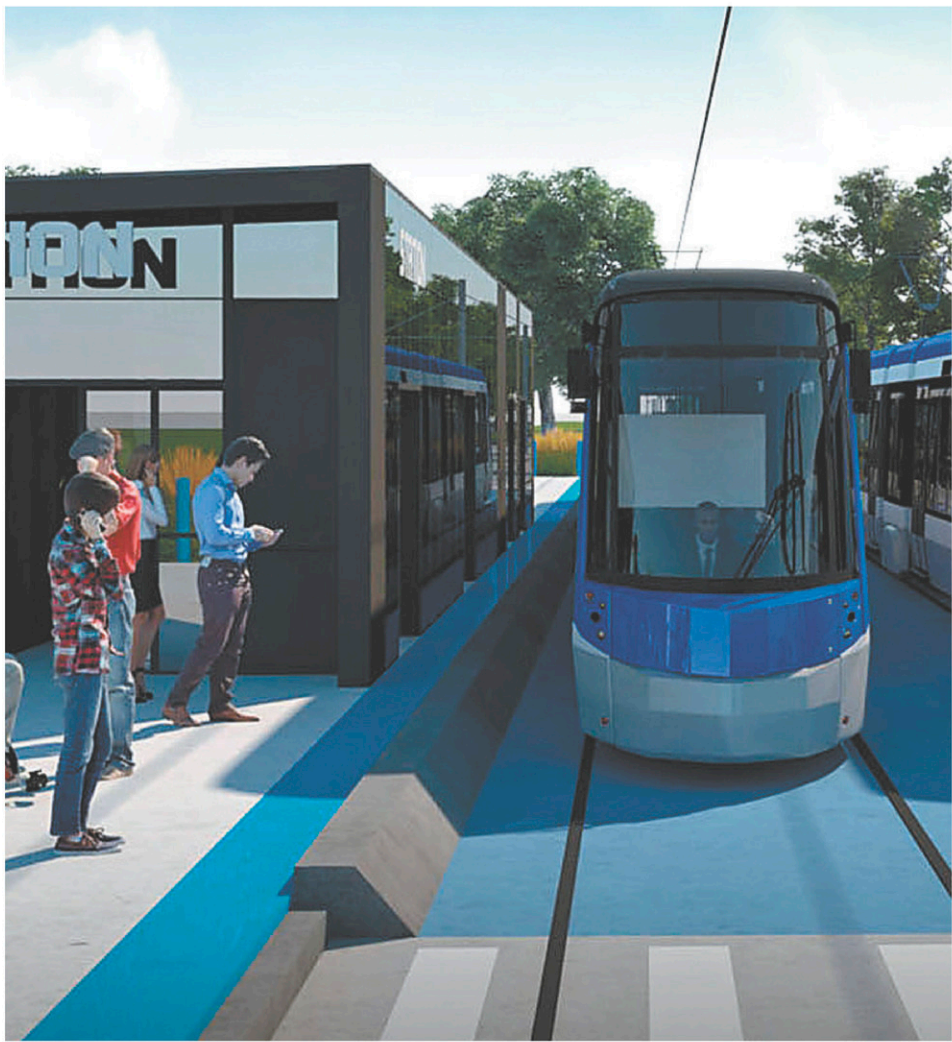
VILLE DE QUÉBEC