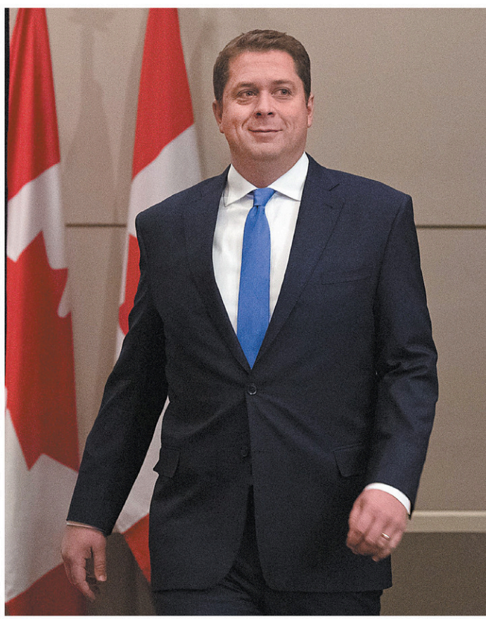
Le chef conservateur Andrew Scheer tente de se maintenir à la tête de son parti en dépit de l'échec électoral qu'il a subi.