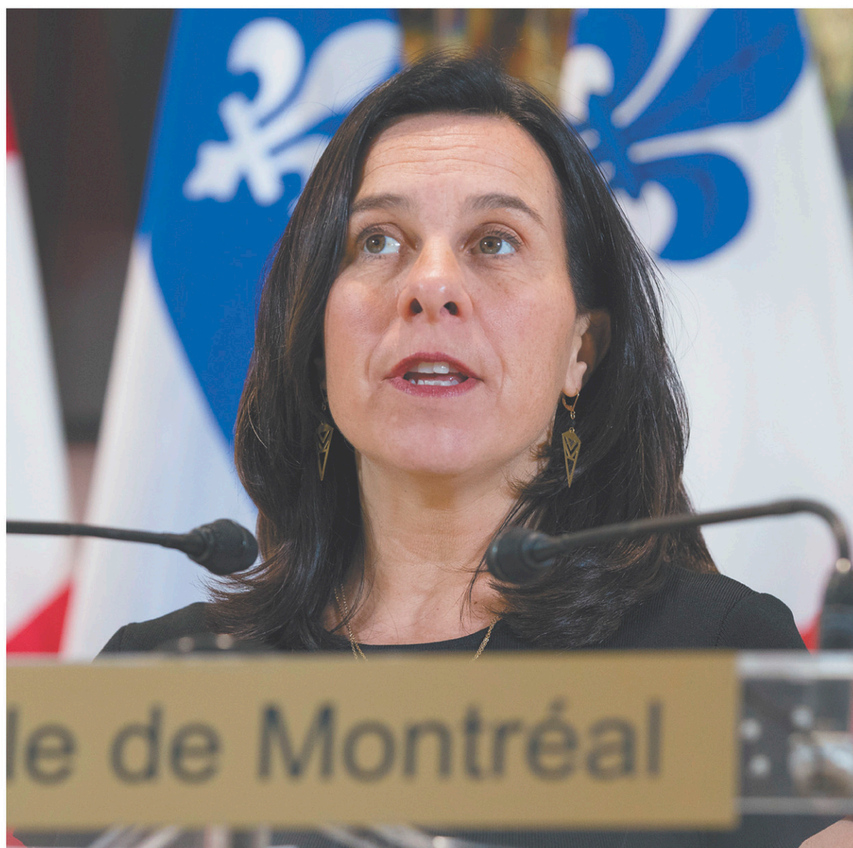
La mairesse de Montréal, Valérie Plante

La Ville consacra 624,7 millions à l'acquisition d'espaces verts, à leur préservation et aux sports. Une somme de 202 millions sera consacrée au secteur de l'habitation. Au chapitre des effectifs, la Ville comptera 402,9 années-personnes de plus en 2020, dont 33 postes supplé-