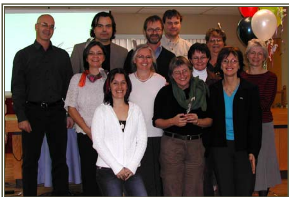
La merveilleuse équipe de l'événement Livres en fêtes!