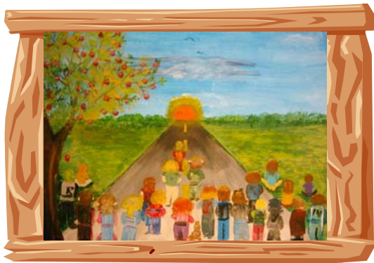
Un soleil pour nous

C'est avec fierté que nous vous présentons « Un soleil pour nous », œuvre collective créée par 22 élèves du primaire de l'école des Prospecteurs de Murdochville. Cette œuvre a été réalisée dans le cadre d'un projet spécial visant à promouvoir des valeurs telles que l'estime de soi et le sentiment d'appartenance.