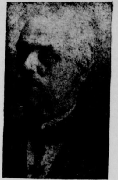
Portrait de monsieur le commandeur Alphonse Desjardins, fondateur des Caisses Populaires.