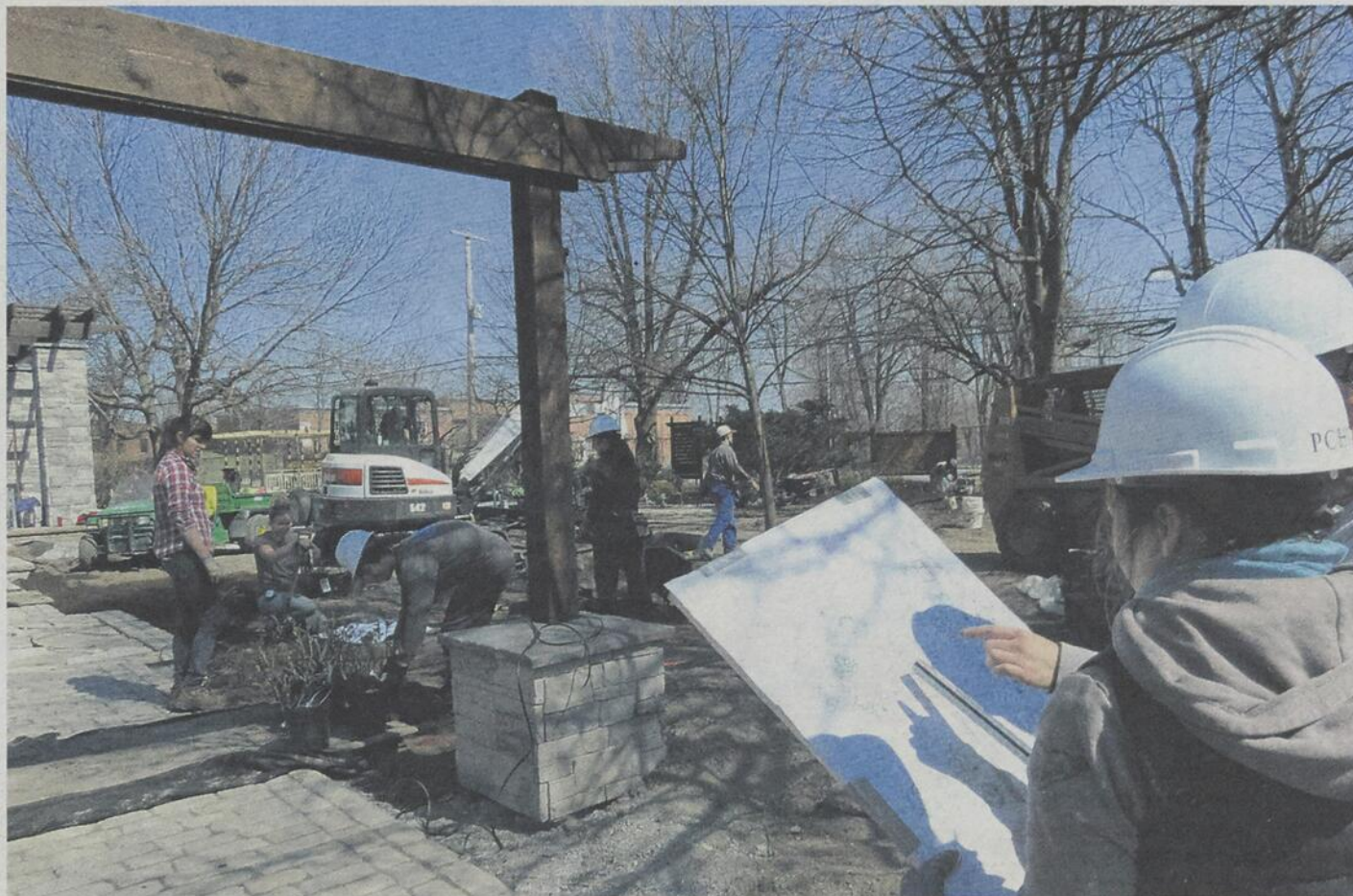
Le programme de paysage et commercialisation en horticulture ornementale est encore offert à l'ITA. Au cours de leur formation, les étudiants de ce programme réalisent un vrai jardin, de la planification jusqu'à l'inauguration.

Il est important de mentionner que les finissants de l'ITA s'assurent un emploi stimulant au terme de leurs études, puisque l'ensemble des programmes se distingue par des taux de placement qui avoisinent les 100 %.