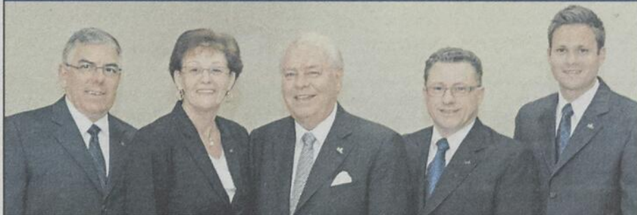
Équipe de conseillers

Salon | Chapelle | Salle de réception | Colombariums | Crématorium | Cryptes