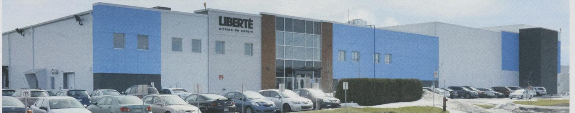
Depuis son acquisition par Yoplait en décembre 2010, l'usine Liberté du boulevard Choquette a connu un essor considérable.