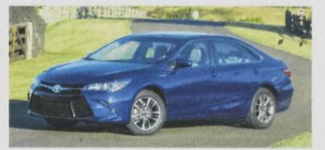
UNE CAMRY REVISITÉE