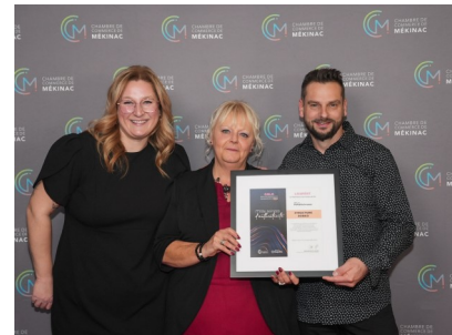
Structure Robko Entreprise accueillante