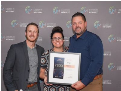
Excavation L.E.D. inc. Entreprise de service