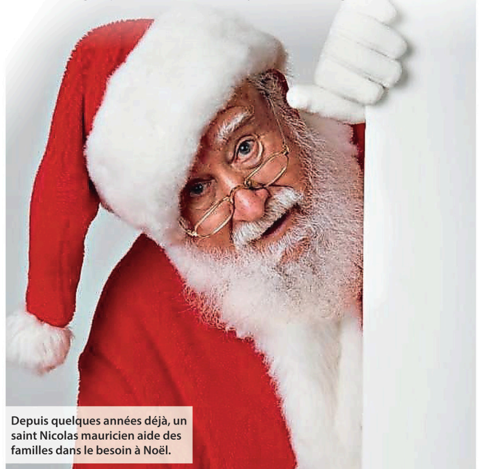
Depuis quelques années déjà, un saint Nicolas mauricien aide des familles dans le besoin à Noël.

«Les familles sont tellement contentes! Elles sont très réceptives et tout le monde a les larmes aux yeux. Ce sont des larmes de joie. C'est pour ça que j'aimerais que mon initiative soit contagieuse et tout le monde peut faire une différence. Si on est plusieurs à le faire, ça va aider à faire changer certaines choses», conclut-il.