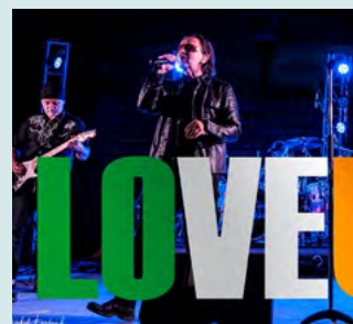
26 mai - 34 $ LOVE U2