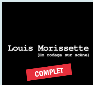
8 juin - 39,50 $ LOUIS MORISSETTE