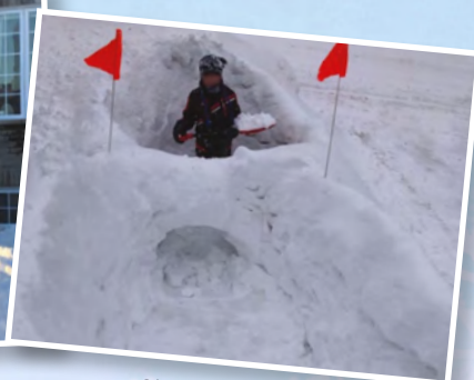
Château de Yan