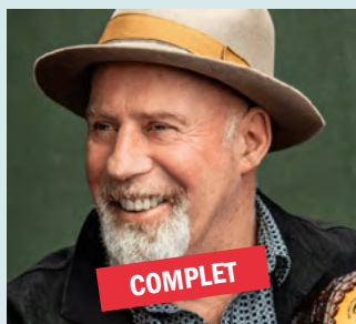
21 avril - 37 $ HARRY MANX

INSCRIVEZ-VOUS À L'INFOLETTRE! Soyez informé-e-s en premier des spectacles à venir et des préventes à La petite église Cabaret Spectacle.