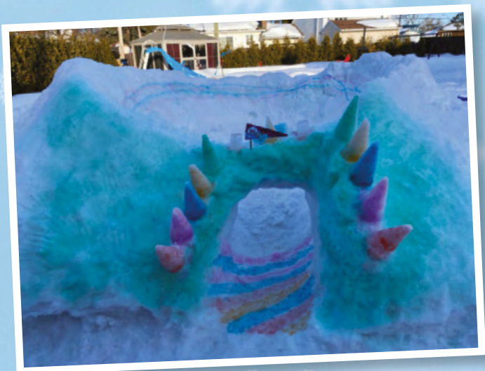
Le « Super château de neige coloré »

Voici les gagnants des deux grands prix tirés au sort par la Ville de Saint-Eustache parmi tous les châteaux participants :