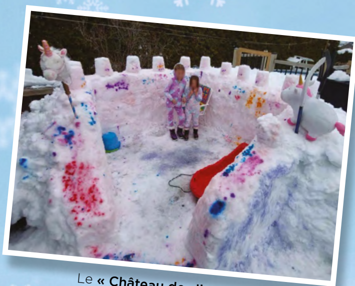
Le « Château des licornes »

CI-DESSOUS QUELQUES CHÂTEAUX DE NEIGE PRÉSENTÉS LORS DU DÉFI.