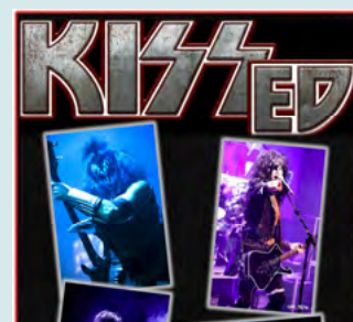
28 avril - 34 $ KISSÉD : HOMMAGE À KISS