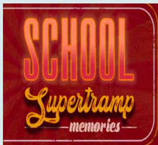
13 mai - 43 $ SCHOOL - HOMMAGE À SUPERTRAMP