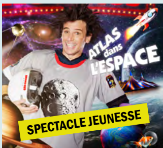
28 mai - 18 $ ATLAS GÉOCIRCUS 3