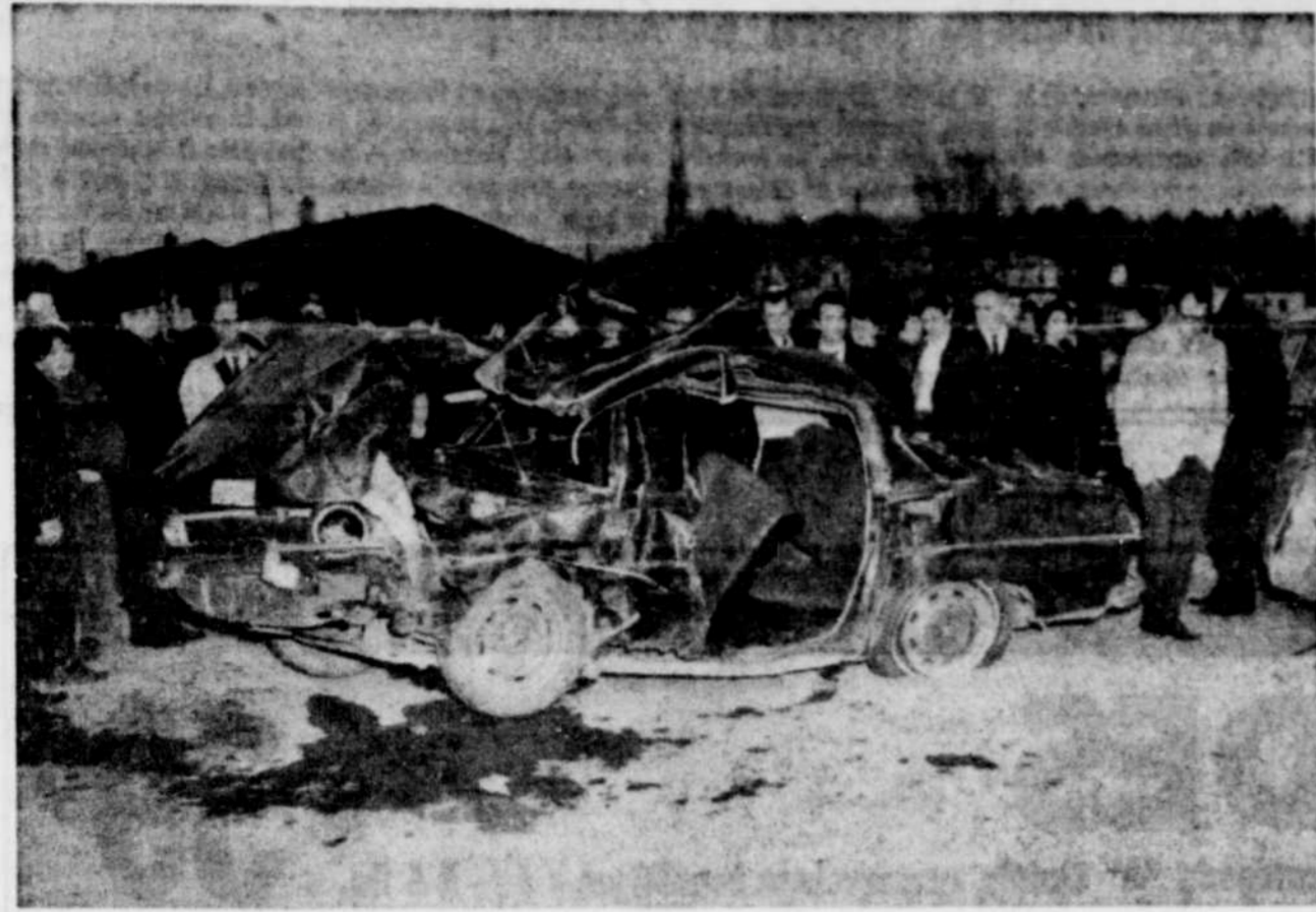
EN EXAMINANT L'ETAT DE CETTE petite automobile Renault, on peut imaginer quelle force avait l'impact de l'accident impliquant deux automobiles à Victoriaville, dimanche à l'heure du souper. On comprend également

que cette tragédie de la route ait causé la mort d'une personne et que cinq autres ont subi des blessures. La collision est survenue sur le boulevard Juras-Ouest, au niveau de la rue St-Henri.