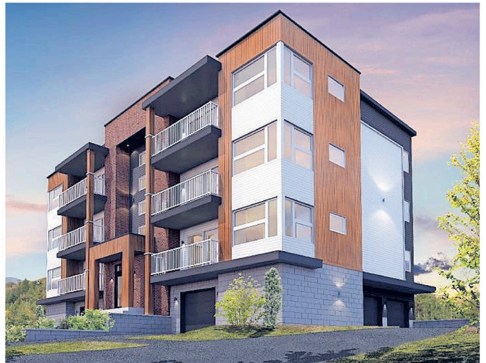
Le marché du condo devrait se développer à la faveur de la densification et du vieillissement de la population, croit Carl Lafontaine.

Carl Lafontaine estime que les entrepreneurs