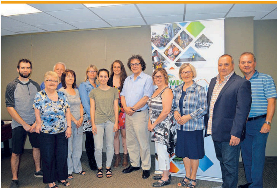
Des représentants de diverses organisations ont préparé le rendez-vous du 29 mai.