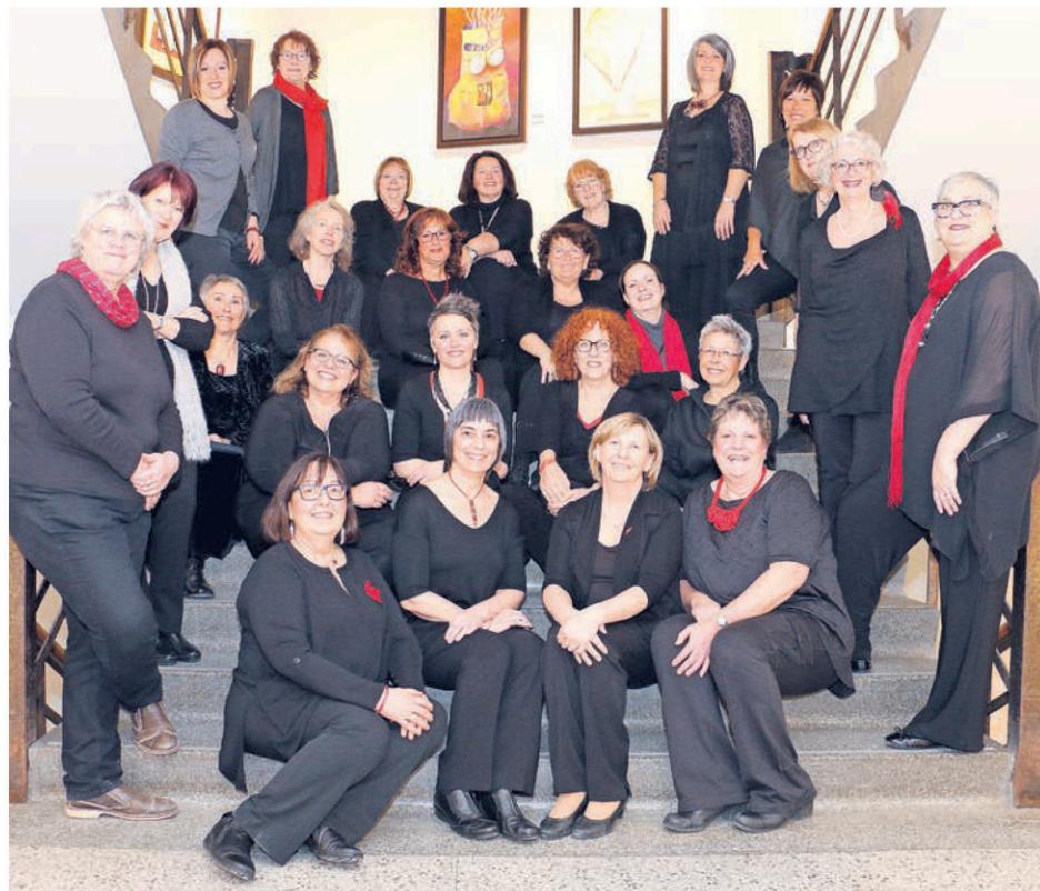
Les Chante-Dames se préparent à célébrer leur 10 e anniversaire.

Les chœurs de femmes étant assez rares dans la région, il ne faut pas manquer l'occasion d'entendre les Chante-Dames. Les billets sont disponibles auprès des choristes, à l'Épicerie Provencher, à la Brûlerie Reno de Victoriaville et à la Tabagie Bélanger de Plessisville.