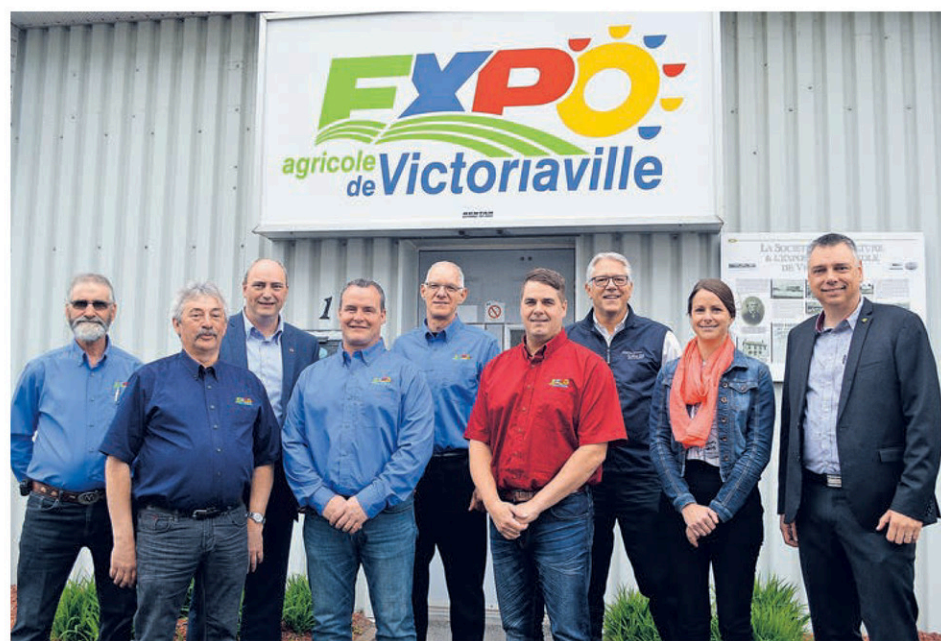
Des membres du conseil d'administration de la Société d'agriculture des Bois-Francis avec d'importants partenaires d'Expo Victo