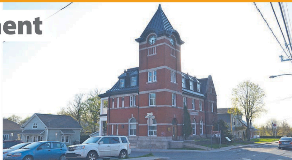
L'Hôtel des postes sera le septième bâtiment ou ensemble détenant une citation de la Ville de Victoriaville.

Dans le cas de la Maison Laurier, elle est également reconnue comme Lieu historique national du Canada. La Ville de Victoriaville a enfin cité comme monument historique la maison Alfred-Paris (48, rue Laurier Est) ainsi que la maison Marc-Aurèle Plamondon située tout à côté du Musée Laurier (14, Laurier Ouest).