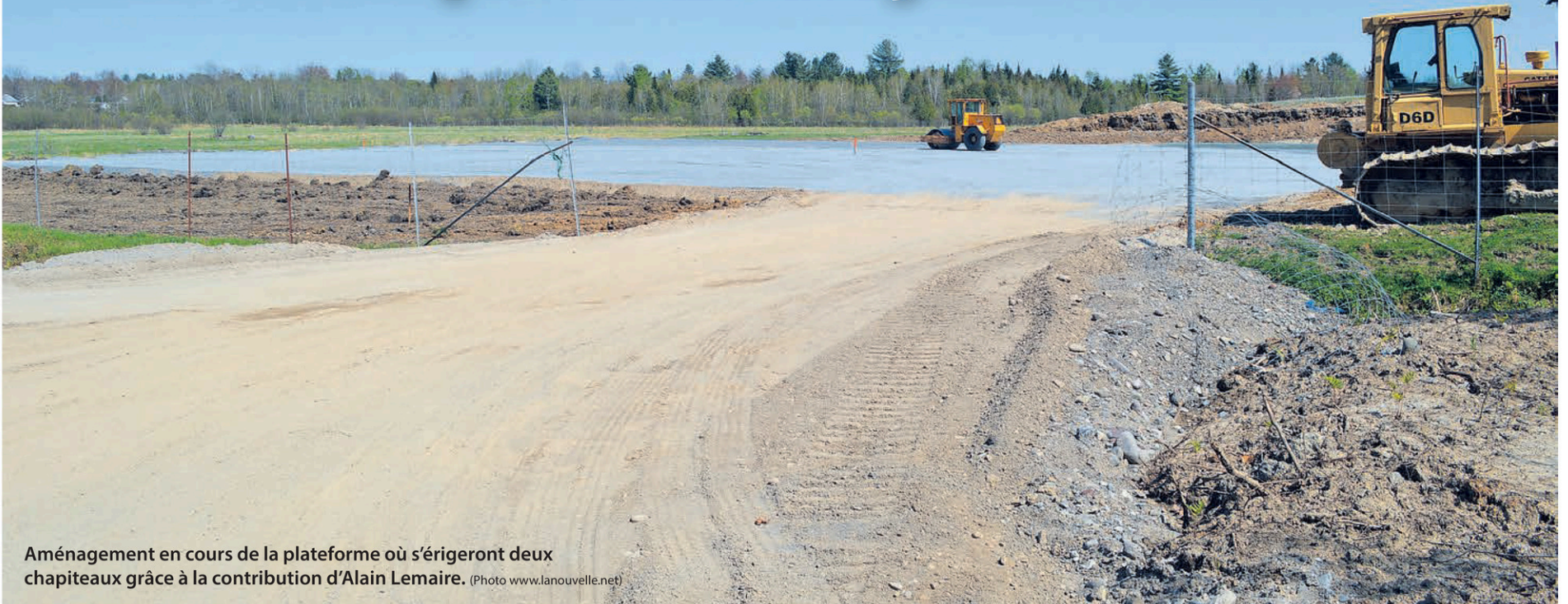
Aménagement en cours de la plateforme où s'érigeront deux chapiteaux grâce à la contribution d'Alain Lemaire.