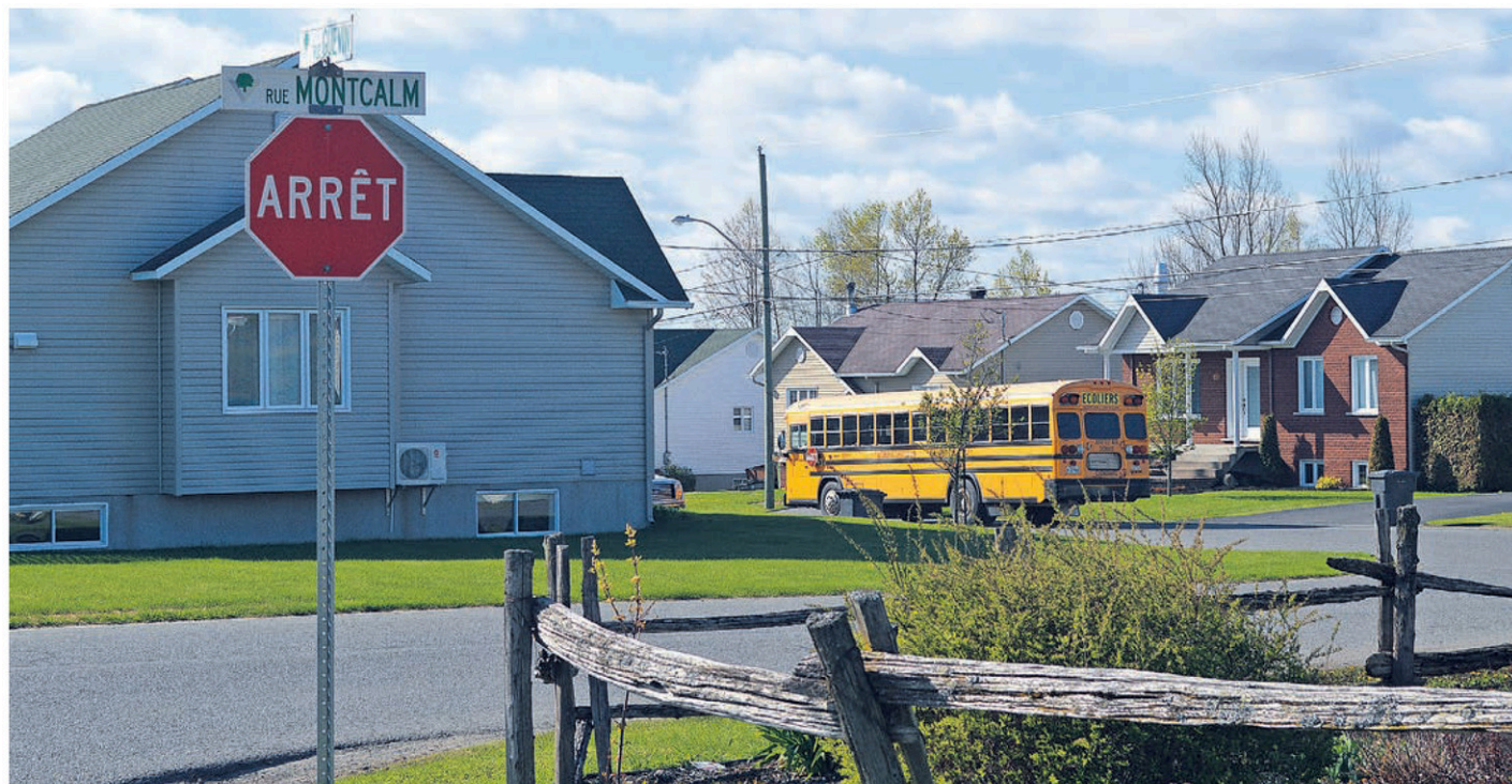
Un quartier paisible, le secteur de la rue Montcalm à Victoriaville

Thibeau et ses invités investissent même la voie publique pour danser, boire et lancer au