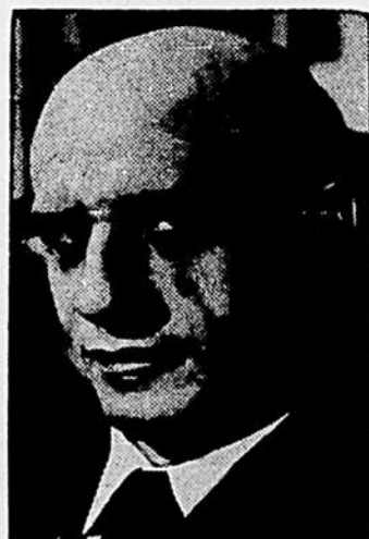
Dimitri Mitropoulos, chef de l'Orchestre Symphonique de Minneapolis qui reviendra diriger ce merveilleux ensemble composé de 90 musiciens virtuoses. Mitropoulos est le chef attiré de l'Orchestre de Minneapolis depuis 1937 alors qu'on lui confia ce poste jusqu'à ce moment occupé par Eugène Ormandy.